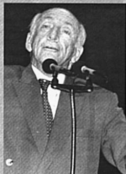
Lauro: "Ele só pensa na reeleição"

Para Lauro Campos, o problema do país não é o chamado "Custo Brasil", mas o que ele denominou de "Custo FHC": a política econômica e o fato de o presidente "só pen-