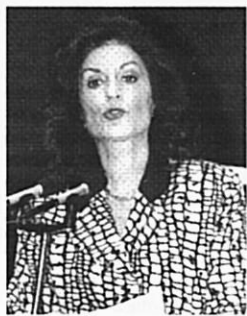
Emília: exclusão de milhões

- Uma economia que, de antemão, trata como fato normal a exclusão de milhões de pessoas do processo produtivo, ou, ainda, que estimula a competição mesquinha, indi-