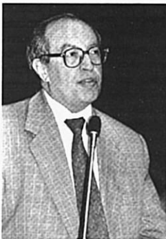
Alcântara lembrou gênio de Darcy

Depois de reportar-se ao trabalho de Darcy Ribeiro como indigenista, e que resultou em várias obras literárias, o senador destacou a atuação do homenageado na administração pública, salientando que ele foi responsável pela elaboração das diretrizes educacionais do go-