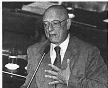
Barragens estão em estado precário, alerta Amin

cício, melhorando seu desempenho na sala de aula, além de concorrer, inclusive, para sua habilitação, já que constitui valioso recurso didático nos cursos de formação do magistério. Quanto aos alunos, o benefício é ainda maior, já que se lhes oferece um instrumento moderno de apoio pedagógico que muito enriquecerá o conteúdo das aulas que lhes serão ministradas - disse.