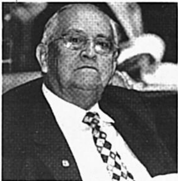
Boaventura: sociedade alerta