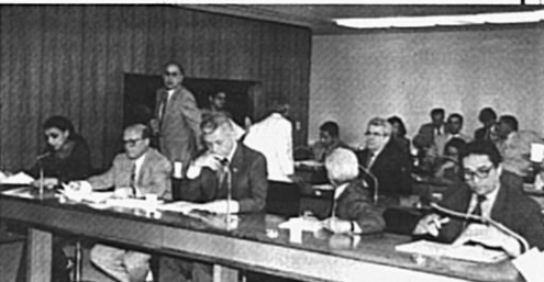
Reunião da Comissão de Assuntos Sociais, uma das sete permanentes

A composição das comissões é definida proporcionalmente ao tamanho dos partidos e dos blocos parlamentares. Os lugares nas comissões pertencem aos partidos e seus membros são escolhidos ou substituídos por indicação dos líderes partidários. As comissões permanentes têm reuniões ordinárias uma vez por semana.