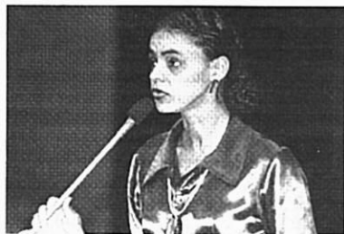
Marina participou de solenidade com FHC

A solenidade de homologação, no Palácio do Planalto, foi dirigida pelo presidente Fernando Henrique Cardoso e teve a senadora Marina Silva entre os convidados. Ela lamentou em sua comunicação ao plenário que o governo fez um corte de 78% nas verbas do Orçamento da União destinadas à Funai para demarca-