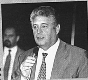
Requião: meios adequados para o Judiciário

tico-parlamentar, têm-se alcançado resultados positivos na identificação dos responsáveis pelos crimes financeiros ou contra o erário público; entretanto, conforme ressaltou, razões de natureza estrutural dificultam a ação da Justiça para puni-los.