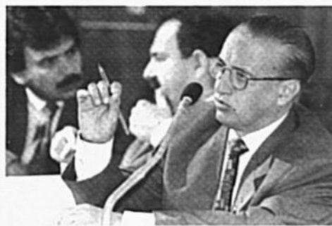
Valadares: financiamento público a partir do ano 2000

O projeto prevê a distribuição proporcional dos recursos recebidos do fundo entre partidos registrados na Justiça Eleitoral que tenham conquistado na eleição imediatamente anterior, no mínimo, dez cadeiras para a Câmara dos Deputados. O fundo partidário será constituído por