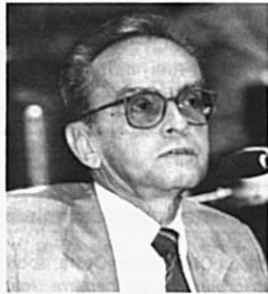
Jefferson: “o mundo inteiro de luto”

nardo Cabral (PFL-AM) disse que o mundo não vai esquecer dessa fase que marcou o apogeu de Frank Sinatra. Lembrou que ele e Jefferson participaram, na juventude, da fundação de um fã-club em Ma-