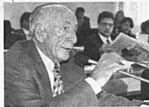
Lauro: contra a reeleição

Em aparte, o senador Edison Lobão (PFL-MA) contestou as opiniões dos intelectuais citados por Lauro Campos. "Eu acho que todos nós temos um pouco de vaidade em alguns momentos. Agora, chamar o presidente da República de um déspota e um tirano é, evidentemente, um absurdo", defendeu Lobão, afirmando que considerava Fernando Henrique "um democrata, um intelectual, um homem inteligente, capaz".