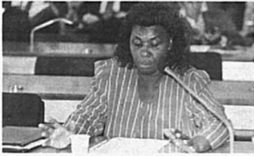
Benedita fez as críticas ao lembrar o Dia do Enfermeiro