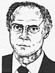
Suplicy: União deve fazer o mesmo