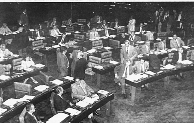
Plenário delibera também sobre propostas de se criarem comissões para o desemprego e a reforma tributária

A emenda constitucional que tem como objetivo acabar com a guerra fiscal é uma das propostas em exame no plenário do Senado na quarta-feira. Com ela, podem ser estabelecidas regras uniformes dos benefícios fiscais destinados a atrair investimentos. Outra matéria na pauta é o projeto que cria incentivos tributários às empresas que oferecerem o primeiro emprego a jovens de 14 a 18 anos. Devem ser votadas também emendas dos deputados à proposta do Senado que inclui o Vale do Jequitinhonha na área de atuação da Sudene. Está na pauta, ainda, a criação de comissões temporárias para estudar a reforma tributária e as causas do desemprego. Página 3