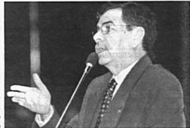
A CAE reúne-se amanhã para analisar projeto de José Bianco

A modificação proposta pelo substitutivo acrescenta ao artigo 64 do Estatuto da Terra (Lei 4.504/64) parágrafo com a seguinte redação: "O custo de cada parcela não excederá a 20% dos investimentos necessários à implantação do núcleo, nele se incluindo o preço pago pela desapropriação e das valorizações resultantes