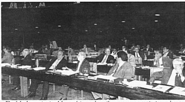
Plenário deve votar também projeto que incentiva empresas a contratarem jovens

Discutida durante meses na Comissão de Constituição, Justiça e Cidadania (CCJ), a proposta acrescenta um inciso ao artigo 155 da Constituição, prevendo que a futura resolução do Senado estipulará as situações em que os estados poderão conceder anistia, isenção, remissão, moratória, crédito presumido, devolução de tributos ou qual-