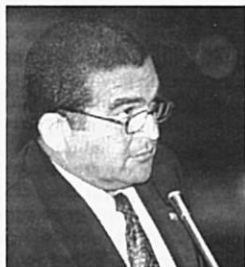
Amorim pede critérios diferenciados

Para Amorim, a ausência de projetos para o Norte do país – como o intercâmbio permanente entre órgãos como Emater, Sebrae, Ceplac, Basa, Suframa e Sudam – dificulta a dotação de recursos para a Amazônia. Ele lastimou tam-