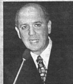
Arruda foi o autor da iniciativa

Como defensores da democracia, dos direitos humanos e outras causas nobres, deploramos o fato de que haja um povo sob ocupação militar e privado de seus direitos elementares. Autodeterminação, direito a ter seu Estado e o retorno dos refugiados a sua terra são a base dos direitos do povo palestino,