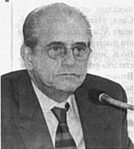
Tebet é relator da proposta

— Isso talvez explique o elevado índice de inadimplência, apesar das obrigações contratuais fixadas pelo prazo de 20 anos. Não resta a menor dúvida de que o preço de cada parcela deve ser fixado de forma racional e realista, de sorte a atingir os objetivos do assentamento rural, com a fixação do homem à terra e o desenvolvimento da produção agrícola — concluiu o relator.