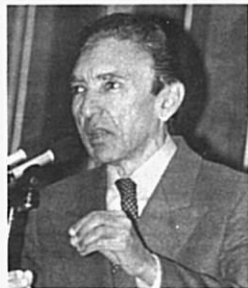
Lobão: impunidade é estímulo em gavetas entupidas por não poderem ser cumpridos - observou.

Além desses fatores, a violência no Brasil está umbilicalmente vinculada à impunidade e ao caos da nossa organização carcerária. Rouba-se e mata-se sob a perspectiva da impunidade. Bandos de criminosos enfrentam a polícia com a vantagem das armas contrabandeadas. Milhares de mandados de prisão dormem