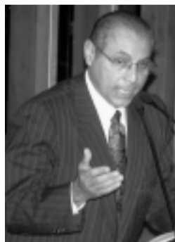
Júlio Campos defende participação de empresas estrangeiras

Entre as propostas de emendas à Constituição, destaca-se a que permite a participação de empresas ou capitais estrangeiros na assistência à saúde no país. O primeiro signatário da proposta é o senador Júlio Campos (PFL-MT) e o parecer, favorável, foi elaborado pelo senador Jefferson Péres (PSDB-AM).