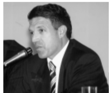
Agaciel: população recebe pouca informação

O secretário-geral da Mesa citou ainda a criação da agenda mensal com a