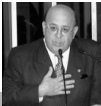
Suassuna garantiu que governo não contará com seu voto para prejudicar Norte e Nordeste

Segundo cálculos de Suassuna, o ônus global do aumento da Co-