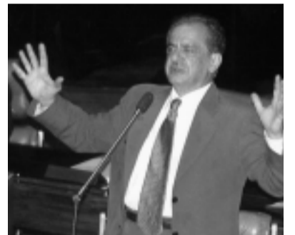
Pedro Simon foi o autor da proposta de homenagem a dom Paulo Evaristo Arns

Ao associar-se à homenagem, o senador Eduardo Suplicy (PT-SP) elogiou a proposta “de inegável justiça e oportunidade” de Simon. O parlamentar lembrou a iniciativa de dom Paulo de criar a Comissão de