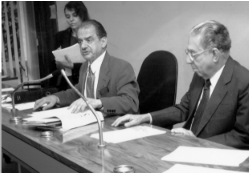
Senador Pedro Simon (tendo a seu lado o senador Josaphat Marinho) preside a comissão para estudar as causas do desemprego

O senador Jefferson Péres (PSDB-AM) sugeriu que em uma das próximas reuniões seja convocado um representante da Fundação Instituto Brasileiro de Geografia e Estatística (IBGE). Ele quer incluir na pauta de discussões a metodologia utilizada para estabelecer os índices de desemprego no país. Também participaram da reunião os senadores Wellington Roberto (PMDB-PB), Josaphat Marinho (PFL-BA) e Elói Portela (PPB-PI).