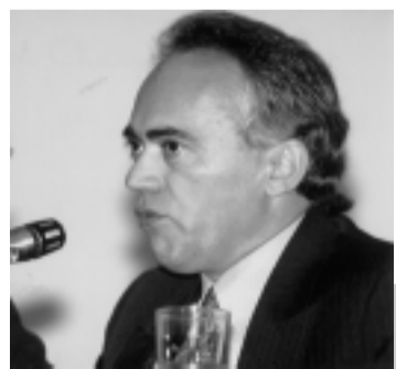
Carreiro: previsão facilitou trabalhos da Casa

– Essa distorção só pode ser corrigida pela divulgação – avaliou.