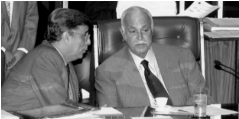
Antonio Carlos, ao lado de Elcio Alvares, recebeu ofício em que Mendonça de Barros se dispõe a prestar esclarecimentos sobre o processo de privatização da Telebrás

O ministro enfatizou, no comunicado, a gravidade com que se reveste a matéria, justificando seu interesse em se oferecer para prestar os esclarecimentos que se fizerem necessários. A iniciativa do ministro foi elogiada pelo líder do Bloco Oposição, senador Eduardo