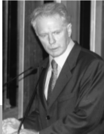
Senador Gerson Camata deu parecer favorável à operação de crédito

O contrato está no âmbito do Programa de Apoio à Reestruturação e ao Ajuste Fiscal dos Estados e segue as regras estabelecidas na Medida Provisória nº 1.654-25. Essa medida prevê mecanismos para a redução da presença do setor público estadual na atividade fi-