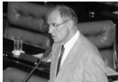
Para Suplicy, deve ser do “interesse do governo” a instalação da CPI sobre a privatização de estatais

As possíveis irregularidades que o Bloco Oposição pretende apurar no processo de privatização brasileiro compreendem o seguinte: a viabilização pelo BNDES da contratação de