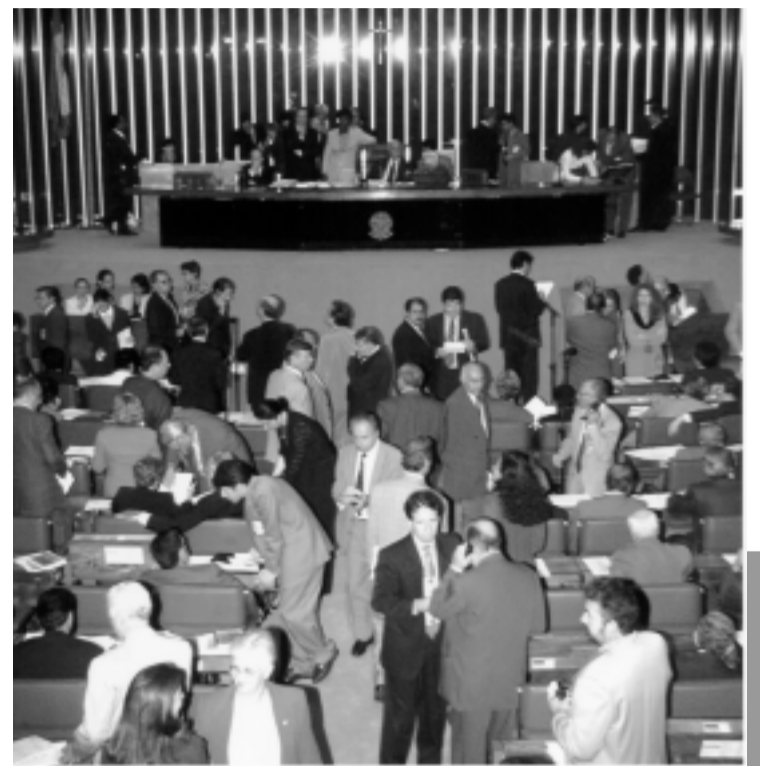
Os deputados e senadores também examinarão a MP que define as novas regras previdenciárias para os servidores públicos

Também deverá ser votada hoje, mas em primeiro turno, a PEC de autoria do senador Osmar Dias (PSDB-PR) que cria um prazo de prescrição das ações trabalhistas movidas por trabalhadores rurais. A matéria tem parecer