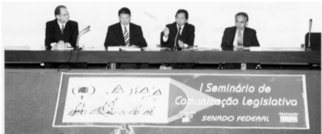
Diretores do Senado participam da abertura do seminário, que tem como objetivo a troca de informações

previsão dos trabalhos do Senado e a atualização do Diário do Senado Federal, outra importante fonte de informação da Casa.