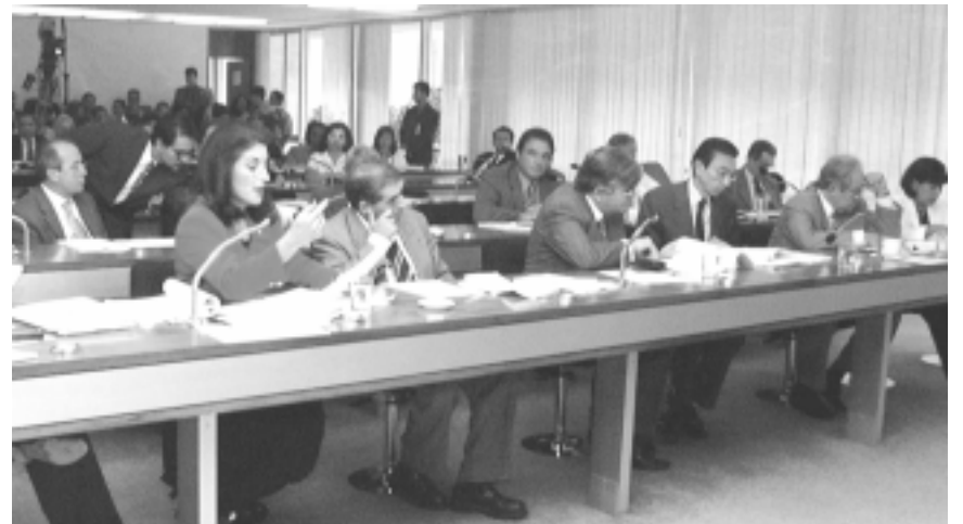
Comissão acolhe parecer favorável ao projeto sobre demissão de servidores, que já passou pela Câmara e vai agora ao plenário do Senado

Pelo projeto, servidores que exercem atividades definidas como “exclusivas de Estado” só podem ser desligados depois que o órgão a que pertencem já tiver reduzido em 30% o pessoal que não faça parte dessas carreiras. Também existe um teto para a