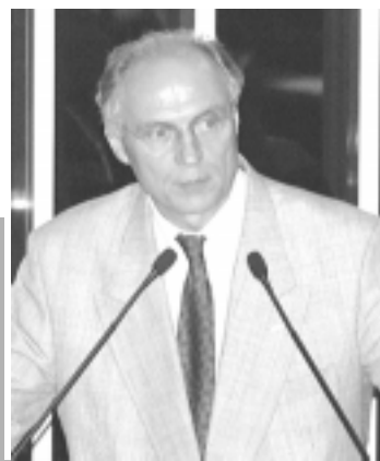
Para Suplicy, as suspeitas de irregularidades no sistema financeiro crescem a cada dia

— Também foi aceito consensualmente pelos membros da comissão nosso requerimento pedindo que sejam transferidos à CPI os sigilos bancário, fiscal e telefônico dos presidentes e componentes das diretori-