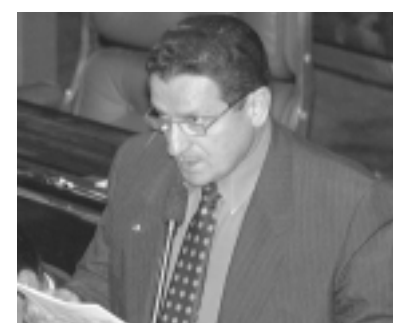
Mozarildo lembrou que parecer da Consultoria e de Josaphat Marinho são divergentes

No parecer, o relator concluiu que, quanto à natureza jurídica, o projeto de lei autorizativa é um pro-