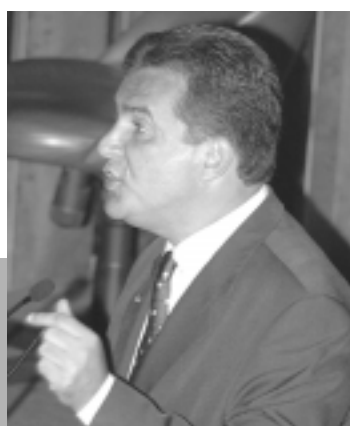
Luiz Otávio vai pedir a presença no Senado do secretário da Receita Federal

Para o senador, enquanto as empresas dilapidam as riquezas do Pará, cabe ao estado enfrentar essa herança de destruição. O governador Almir Gabriel, destaca o senador, "tem investido em infra-estrutura, recuperado sua malha viária, vem saneando o estado e introduzindo energia elétrica em todos os municípios". Luiz Otávio ressalta que seu pronunciamento tem o objetivo de apontar problemas e procurar soluções. Para ele, se, por exemplo, o Banco da Amazônia não contribui para o desenvolvimento da região, deve-se discutir a utilidade de sua existência.