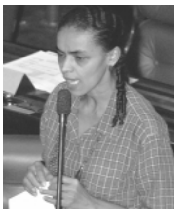
Marina: desmatamento desenfreado pode unir todos em defesa da Amazônia

Para Marina, os 20 milhões de habitantes da Amazônia estão abertos a uma nova proposta, uma vez que todas as tentativas de desenvolvimento realizadas até hoje não tiveram êxito. “As reuniões representam um esforço conjunto de buscar um novo caminho, talvez por entendermos que as tentativas anteriores falharam por serem setorializadas. Estamos buscando um conjunto de ações afirmativas que possam resultar em benefícios econômicos e sociais para a po-