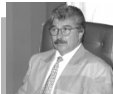
Para Patrocínio, condenado com recursos financeiros deve pagar despesas do presídio

No entender do senador, nada indica que haverá reversão espontânea na política das empresas de excluir de seus quadros as pessoas mais velhas. “Como nos próximos 30 anos continuará o alargamento da pirâmide etária no meio e no topo, o problema da marginalização dos idosos vai adquirir contornos dramáticos, se medidas não forem tomadas com o objetivo de estimular as empresas a mudar a política de pessoal”, afirmou.