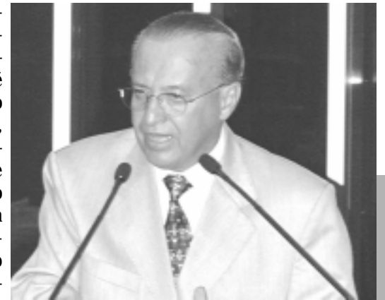
Valadares: com a TR, "as prestações crescem sem medida e o saldo devedor se multiplica, mesmo que o mutuário cumpra seus compromissos em dia"

Heloísa Helena (PT-AL) apoiaram a iniciativa. Para Amir Lando (PMDB-RO), é trágica a situação do sistema habitacional, por não haver compatibilidade entre renda do assalariado e sua prestação da casa própria. "O governo é perdulário quando vende estatais, mas tem sido duro quando trata os mutuários do SFH", observou.