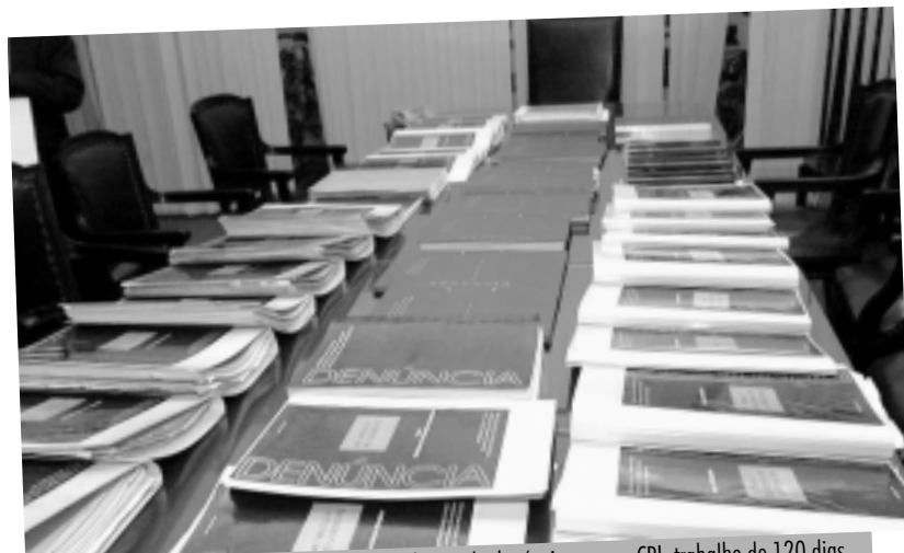
Volumes de denúncias para a CPI: trabalho de 120 dias mistura as atribuições de promotores de justiça e de agentes policiais

Ao final do prazo determinado, geralmente 120 dias, o relator da CPI apresenta um relatório para votação dos parlamentares que compõem a Comissão. As conclusões, se for o caso, são encaminhadas ao Ministério Público, para que abra processo judicial por responsabili-