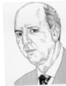
José Roberto Arruda

ser Aeroporto Internacional de Brasília Presidente Juscelino Kubitschek.