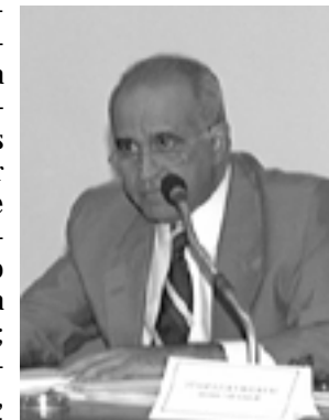
Souto requisitou vários documentos para subsidiar os trabalhos da CPI

Paulo abriu inquérito para apurar denúncias de superfaturamento na contratação das obras e chegou a pedir a quebra de sigilo bancário e indisponibilidade de bens de dois juizes do TRT-SP e da empresa Incal Incorporações (inclusive seus sócios).