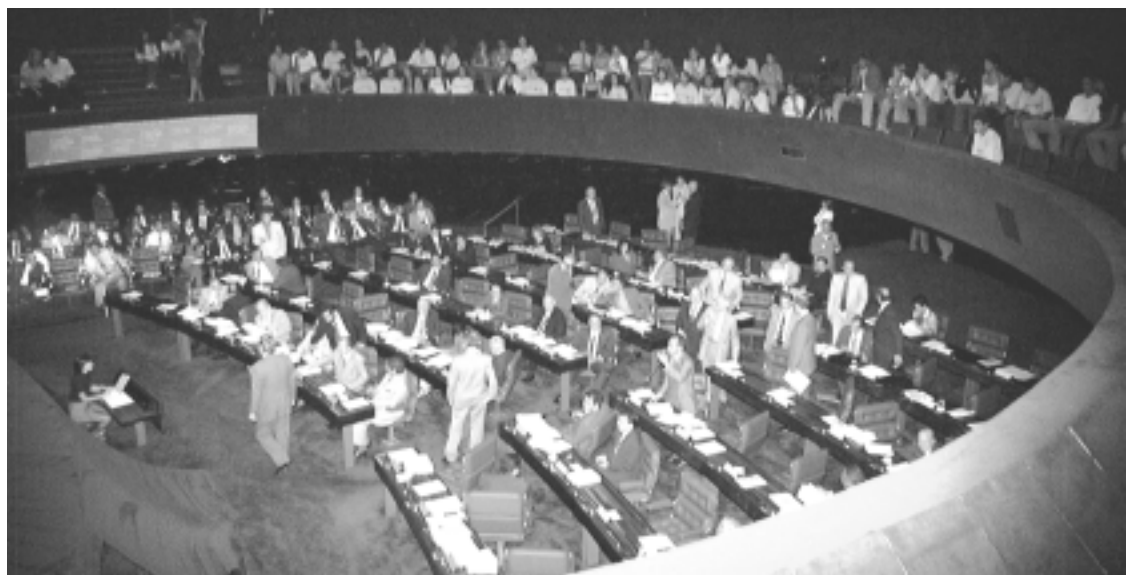
O plenário também decidiu ontem dedicar a sessão do próximo dia 29 ao Dia do Trabalho

A comissão aprovou requerimento da senadora Heloísa Helena para a realização de audiência pública destinada à discussão dos problemas causados pelo consumo de bebidas alcoólicas e de fumo e da influência da propaganda sobre os hábitos da população, com a participação de representantes do Ministério da Saúde, do Conselho Nacional de Saúde, do Centro Brasileiro de Informações sobre Drogas Psicótropas (Cebrid), do Conselho Nacional de Defesa da Criança e do Adolescente (Conanda), da Procuradoria Federal dos Direitos do Cidadão, da Associação Brasileira de Empresas de Rádio e TV (Abert), da Secretaria de Direitos Humanos, da Conferência Nacional dos Bispos do Brasil (CNBB) e dos Alcoólicos Anônimos.