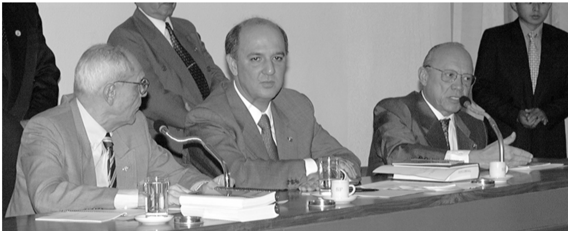
Os senadores Bello Parga (à esquerda) e José Roberto Arruda (ao centro) foram eleitos presidente e vice da CPI dos Bancos, que tem como relator o senador João Alberto (à direita)