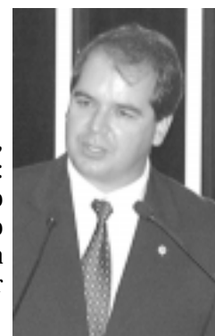
Viana espera que FHC reveja decisão de Eliseu Padilha

O governador anterior, Orleir Cameli, com os vários processos judiciais a que ainda responde, lembrou o senador, recebia recursos federais para a construção de estradas. "O atual, honestamente comprometido com a realização do sonho acreano de se interligar ao país, não mereceu o mesmo tratamento",