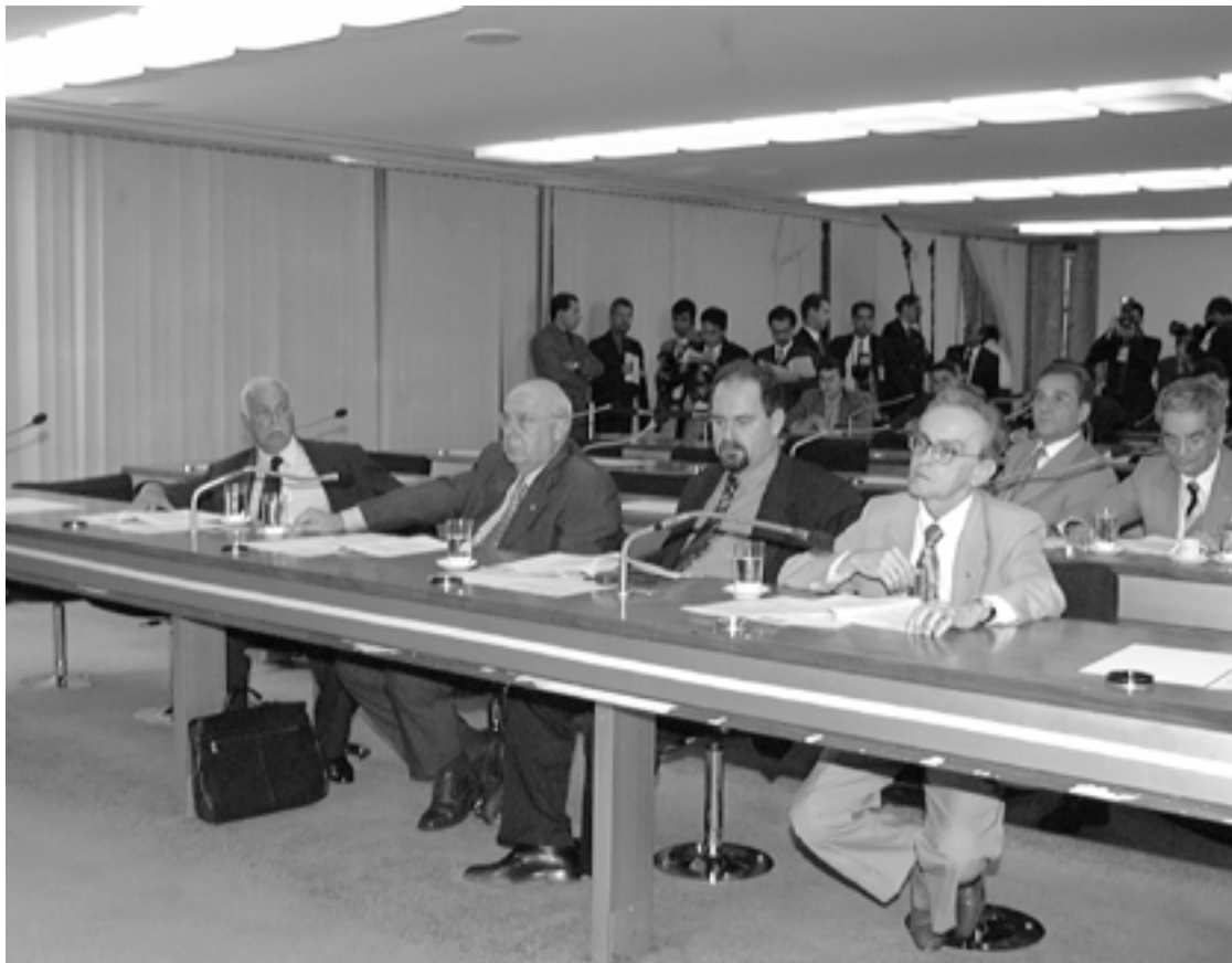
A comissão decidiu ainda convocar, para depoimento, a presidente do Basa e um funcionário do TRT da Paraíba

CPI do Judiciário decide convocar para depor na segunda-feira auditor do TCU que apurou denúncia sobre irregularidades na construção dos edifícios-sede das juntas de conciliação e julgamento da capital paulista