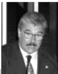
Patrocínio quer reduzir consumo de energia elétrica

O Conselho Nacional de Política Energética (CNPE) deverá estabelecer diretrizes para programas alternativos, como os de uso do gás natural, do álcool, do carvão e da energia termonuclear. É o que determina projeto de lei do senador Carlos Patrocínio (PFL-TO) aprovado em caráter terminativo ontem pela Comissão de Serviço de Infra-