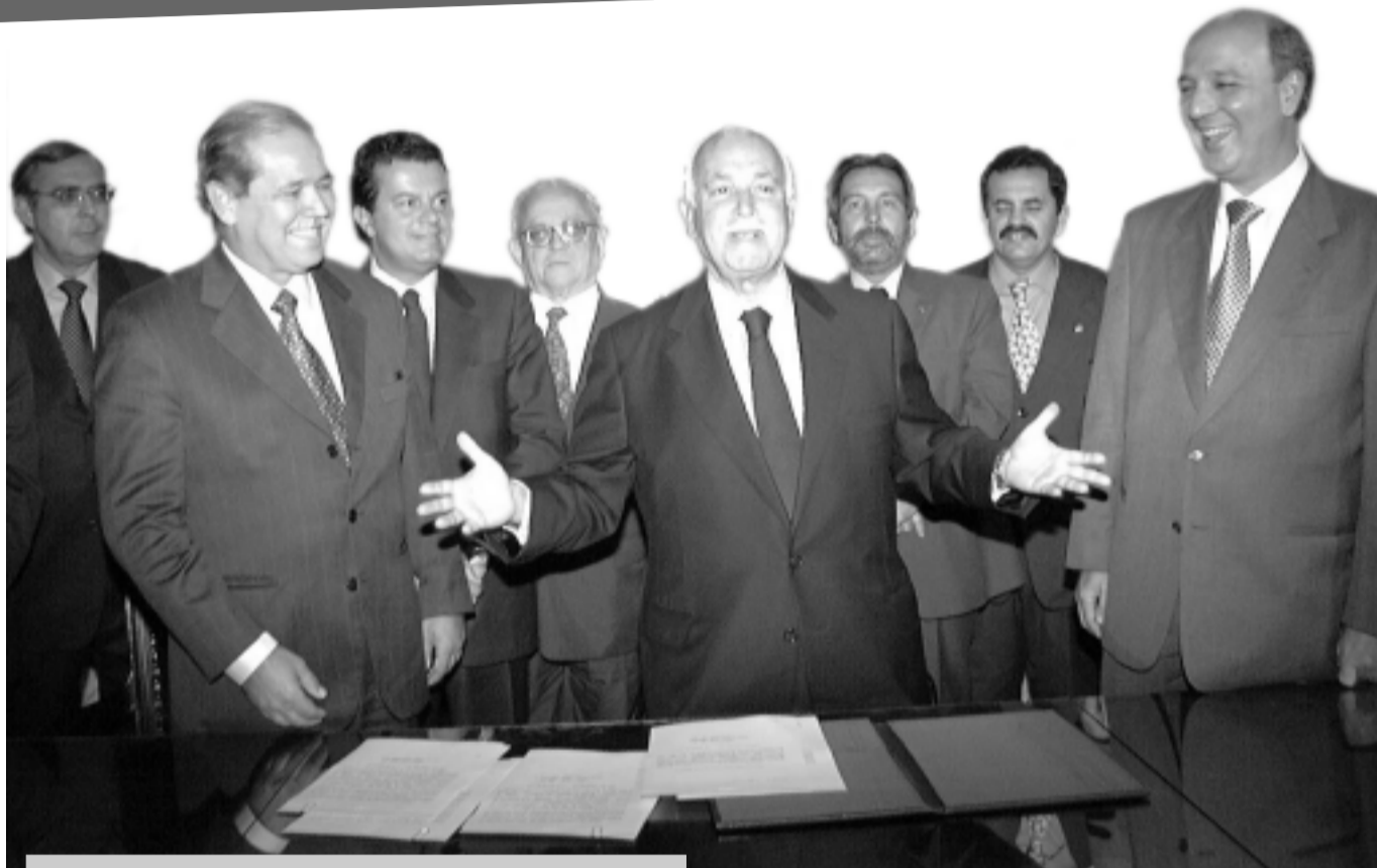
O governador baiano César Borges, o senador José Roberto Arruda e vários parlamentares prestigiaram o ato de promulgação da lei de incentivo à desconcentração industrial