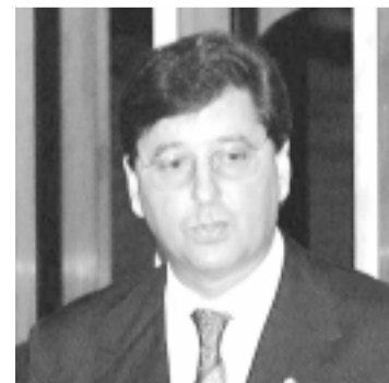
Maguito Vilela vê Cora como uma das pessoas “mais talentosas” de Goiás

— A consagração nacional veio quando Carlos Drummond de Andrade abençoou sua obra em um artigo no Jornal do Brasil . A partir daí, não faltaram editoras querendo publicar seus poemas — disse Maguito, lembrando que a poetisa ganhou diversos prêmios. A senadora Heloísa Helena (PT-AL) se uniu à homenagem prestada por Maguito.