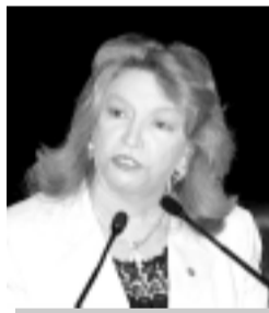
Marluce Pinto espera demarcação da terra dos ianomâmis em Roraima

A senadora Marluce Pinto (PMDB-RR) refutou, ontem, informações da imprensa sobre a intenção do governo federal de terceirizar o atendimento à saúde dos povos indígenas.