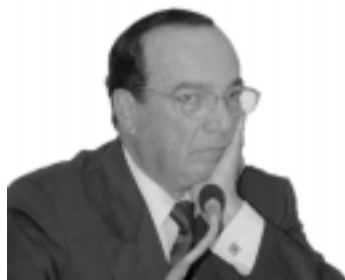
Calmon de Sá

Sistema Financeiro irá propor várias mudanças na fiscalização do Banco Central. O senador afirmou que o depoimento de Ângelo Calmon de Sá revelou como é vulnerável a fiscalização do BC e decidiu questionar a instituição porque, em 1988, ela concordou com uma operação do Econômico com uma coligada e, oito anos depois, após a intervenção, decidiu propor ao Ministério Público ação penal por conta de tal operação.