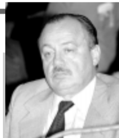
Freitas Neto: propostas foram arquivadas por falta de vontade política

que se enquadra perfeitamente nos objetivos de pôr fim à fome, repartindo de maneira mais justa recursos de um banco que tem como finalidade desenvolver o país harmonicamente — concluiu Freitas Neto.