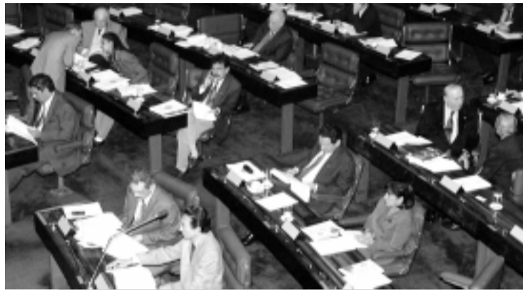
Senadores aprovaram a obrigatoriedade de divulgação dos índices de evasão escolar e acordo com Colômbia contra o narcotráfico

O Congresso Nacional, por sua vez, aprovou 14 medidas provisórias, entre elas a que permite a instalação de uma fábrica da Ford na Bahia. Trata-se da MP 1.916, que cria incentivos fiscais para o desenvolvimento regional e isenta de IPI (Imposto sobre