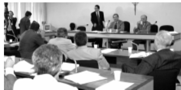
CCJ votará na próxima quarta-feira o novo texto do relator Edison Lobão

Segundo explicou Lobão, seu próximo substitutivo acatará a emenda do senador Antonio Carlos Valadares (PSB-SE) que propõe a formação de