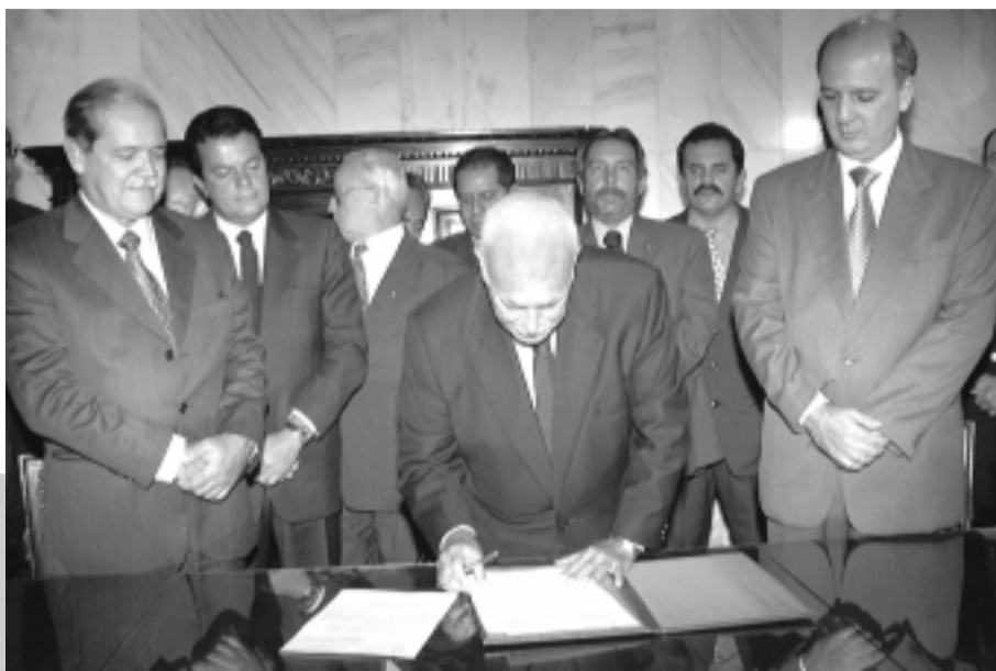
Antonio Carlos promulgou a lei por ela ter se originado de MP aprovada sem modificações

A lei foi promulgada pelo senador Antonio Carlos Magalhães, na condição de presidente do Congresso, por ter se originado de uma medida provisória editada pelo Executivo e aprovada sem alterações pelo Legislativo. Caso a MP tivesse sido aprovada com mudanças, resultando em um projeto de lei de conversão elaborado pelo Legislativo, teria que voltar ao Executivo para sanção pelo presidente da República.