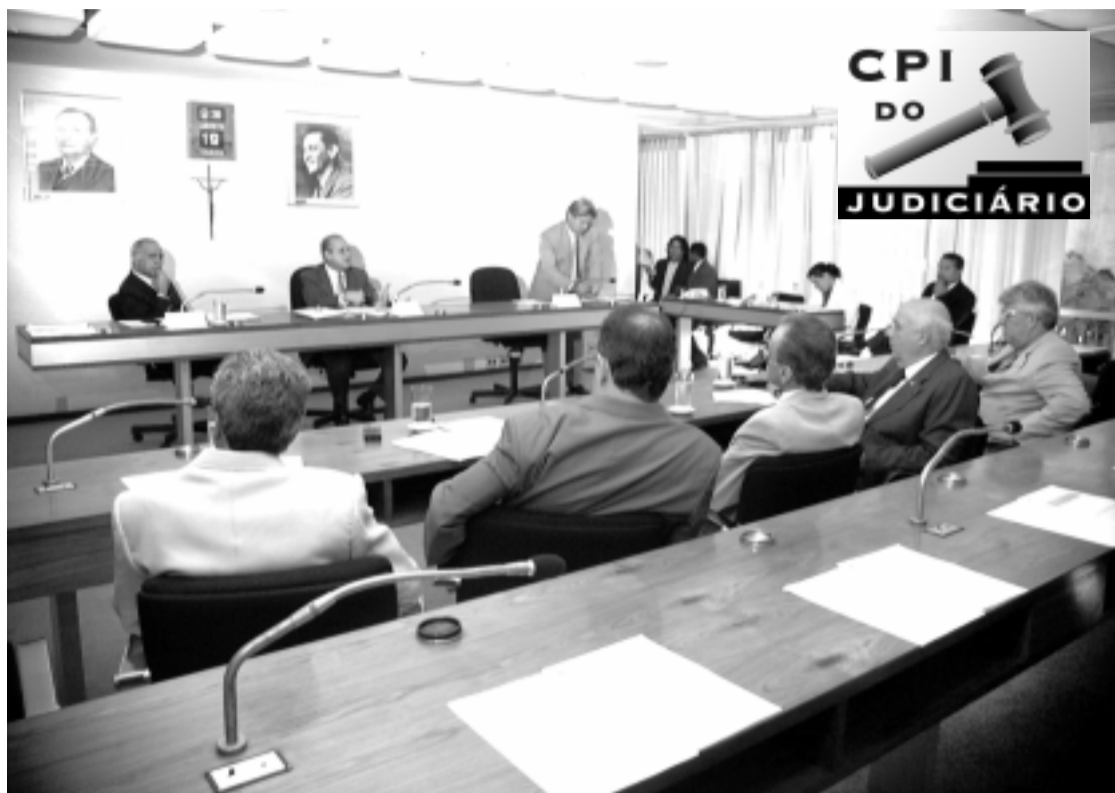
CPI decidiu complementar as investigações sobre os TRTS de São Paulo e da Paraíba e o caso Encol

O esclarecimento de alguns fatos relativos ao caso Encol ficará a cargo da Polícia Federal, conforme requerimento do senador Carlos Wilson (PSDB-PE) também aprovado ontem.