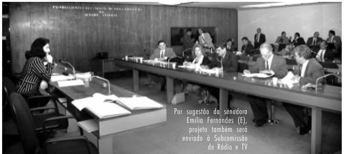
Por sugestão da senadora Emilia Fernandes (E), projeto também será enviado à Subcomissão de Rádio e TV

Ela entende que a importância da matéria aumenta na medida em que a regionalização da programação das emissoras de rádio e TV “procura resgatar as intenções do constituinte, quando da elaboração dos incisos I a IV do artigo 221 da Constituição federal”. No entanto, Luzia Toledo admite sua preocupação quanto à aplicação prática do projeto.