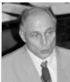
Eduardo Suplicy quer saber os nomes dos beneficiários dos juros

O senador Eduardo Suplicy (PT-SP) apresentou requerimento solicitando que o ministro da Fazenda, Pedro Malan, informe as razões que levaram o governo federal e o Banco Central a aumentarem a parcela destinada ao pagamento de juros. Segundo o senador, o governo comprometeu