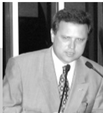
Para Blairo Maggi, só com dados confiáveis pode-se "decidir o que fazer com a agricultura nacional"

Após a conclusão da auditoria, no entender do senador, será possível identificar as pessoas que não usaram o dinheiro oficial para o fim específico. O senador sugeriu que sejam separados "os créditos totalmente podres" que o Banco do Brasil, o BNDES ou qualquer outra instituição não têm mais condições de receber e que podem ultrapassar mais de R$ 4 bilhões.