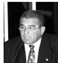
Amorim diz que projeto não eleva despesas

Ele acrescentou que os cargos extintos serão transformados em cargos geradores do novo quadro funcional, “em montante suficiente para cobrir, com sobras, a despesa com a nova reorganização funcional”.