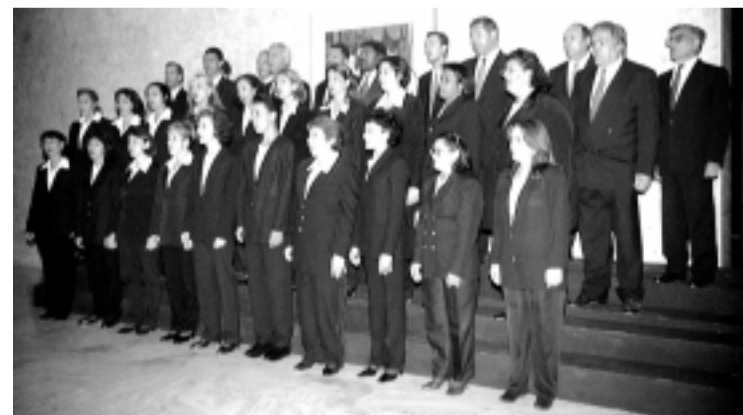
O Coral do Senado participa de evento junto com 12 outros grupos vocais de Brasília, cujo repertório vai do erudito ao folclórico

Além do Coral do Senado, estão convidados, entre outros, o grupo do Clube Internacional de Brasília, o coral infanto-juvenil Mokiti Okada, o coral da Universidade Católica de Brasília e o Madrigal Bach-Roco, sob a regência do maestro Wander Oliveira. Hoje e amanhã, as apresentações vão acontecer às 20h, e no domingo, às 19h30, no auditório do Sesc que fica na 504 Sul.