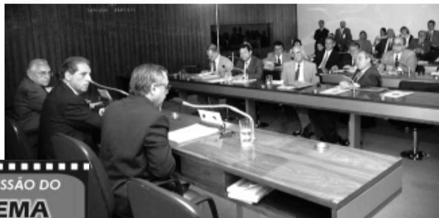
Senadores e representantes do governo discutem fórmulas para estimular produções do cinema nacional: objetivo alcançado