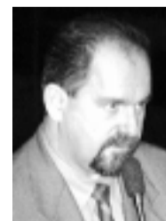
Dutra espera que recursos sejam recuperados