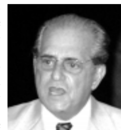
Tebet: promessas do governo não foram cumpridas

Em seu pronunciamento, ele parabenizou o jornal Correio do Estado pelo editorial publicado sobre o aniversário de Mato Grosso do Sul.