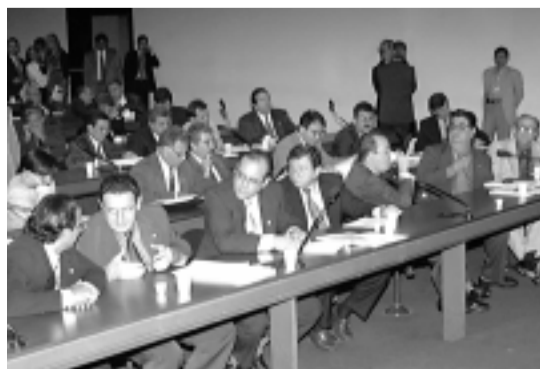
Valor dos créditos que serão analisados pela Comissão Mista de Orçamento é de R$ 4,2 milhões

A proposta de Hartung se baseia em sugestões de especialistas do BNDES e da Caixa Econômica Federal, em um projeto apresentado há quase três anos pelo senador licenciado José Serra e em sua experiência como prefeito de Vitória (ES).