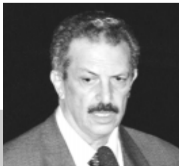
Conforme Romeu Tuma, projeto repara danos causados por decreto de Getúlio Vargas

O plenário aprovou a tramitação conjunta dos projetos de Lei do Senado nº 169 e nº 502, de 1999, que propõem normas para estimular o primeiro emprego. As matérias serão encaminhadas à Comissão de Assuntos Sociais (CAS) e à Comissão de Assuntos Econômicos (CAE), para votação em caráter terminativo.