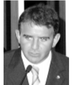
Eduardo: "Ameaça ao futuro da nação"

– Refiro-me não só a movimentos espúrios freqüentemente levados às ruas, onde se misturam causas legítimas com interesses escusos de ordem ideológica, mas também ao festival de denúncias, que, mais do que à verdade e à transparência, buscam desmoralizar as instituições e os que legitimamente as representam.