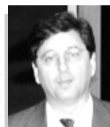
Maguito Vilela participou de audiência pública

Ontem, às 10h, a comissão, presidida pelo senador Maguito Vilela (PMDB-GO), promoveu uma audiência pública na Assembléia Legislativa do Ceará. Senadores, deputados federais e estaduais e vereadores debateram, entre as várias propostas analisadas para o combate à pobreza, a transposição do rio São Francisco, o incremento de polí-