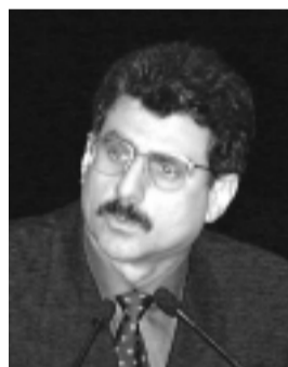
Jucá acha que medidas representam "pequena revolução financeira"

Na avaliação de Jucá, o pacote será altamente benéfico para o setor produtivo e para as pessoas físicas de modo geral, uma vez que, tanto para as empresas como para os indivíduos, a progressiva redução das taxas referenciais de juros vinha tendo pequeno efeito