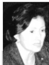
Maria do Carmo pede proteção ao Nordeste

As regiões Norte e Nordeste exigem tratamento diferenciado na aplicação dos recursos públicos, pois ainda necessitam da presença do Estado para se desenvolver, conforme alertou ontem em plenário a senadora Maria do Carmo Alves (PFL-SE). Ela defendeu que o corte de R$ 1,2 bilhão no Orçamento do próximo ano — anunciado pelo governo para cobrir perdas decorrentes da decisão do Supremo Tribunal Federal sobre a contribuição previdenciária de servidores ativos e inativos — seja feito de forma seletiva e ponderada.