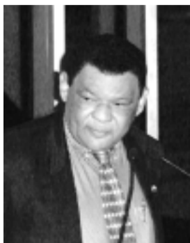
Geraldo Cândido: PNE “aprofunda exclusão de amplos setores”

Segundo o senador, a proposta das entidades educacionais, conhecida como PNE da Sociedade Brasileira em projeto de lei de iniciativa popular.