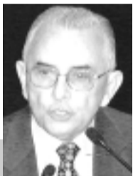
Francelino aponta exemplo para juventude

Os cem anos de nascimento do jurista e ministro do Supremo Tribunal Federal (STF) Themístocles Brandão Cavalcanti foram lembrados ontem pelo senador Francelino Pereira (PFL-MG). “A vida e a obra de Cavalcanti sempre se confundiram com a defesa intransigente dos direitos dos cidadãos e das liberdades políticas”, lembrou.