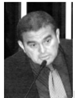
Amorim: "Não se pode falar uma coisa e fazer outra"

O senador também protestou contra o que chamou de "dilapidação do patrimônio nacional", praticada pelo Banco Nacional de Desenvolvimento Econômico e Social (BNDES), quando financia a privatização de estatais para empresas estrangeiras.