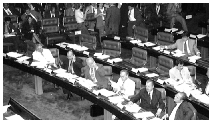
Dezoito senadores, além do presidente do Senado e do relator da matéria, participaram da discussão sobre o substitutivo de José Fogaça

Antonio Carlos informou que vai conversar com o presidente da Câmara, Michel Temer, para garantir a aprovação da matéria, sem emendas, naquela Casa. Uma comissão de deputados e senadores seria constituída "para que isso ocorra o mais breve possível, talvez na convocação extraordinária".