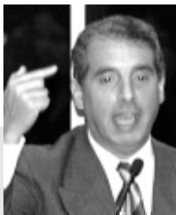
A proposta em nada ameaça o exercício da Presidência, diz Fogaça

Fogaça explicou que os novos prazos para votação de MPs não atingirão as medidas provisórias que hoje tramitam no Congresso, valendo só para aquelas editadas após a mudança. Ele já verifi-