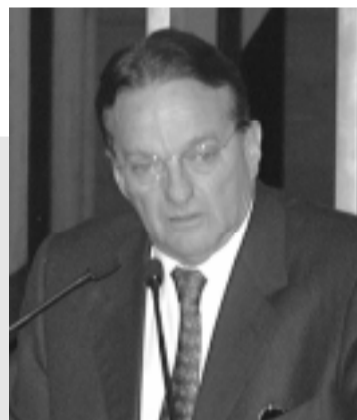
Jorge Bornhausen é autor da proposta que amplia lei sobre crimes de responsabilidade

Segundo Jorge Bornhausen, o projeto corrige “abusos de prerrogativas e condutas omissivas nitidamente inspirados em interesses pessoais, políticos e até escusos, os quais ferem de morte a prestação jurisdicional do Estado e fragilizam tanto o Poder Judiciário e o Ministério Público”. A proposta, acrescentou o autor, pune também condutas de fiscais federais, estaduais e municipais que lançam mão de “expedientes menores para obter vantagens pessoais”.