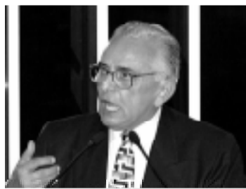
Francelino: duas regiões brasileiras serão declaradas como Patrimônio Natural

Segundo Francelino, as regiões escolhidas pelo Comitê de Patrimônio da Unesco são a chamada Costa do Descobrimento, abrangendo uma unidade de conservação e dois parques, dentre eles o Parque do Monte