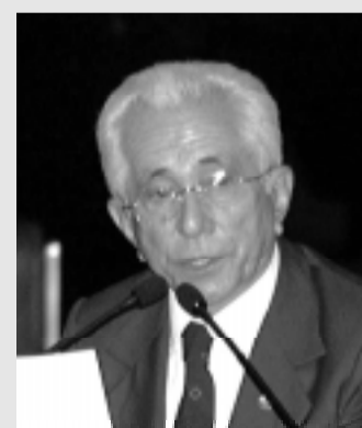
Nabor atribuiu o prêmio concedido pelo jornal à "importância institucional" do Senado

Em dois outros registros, Sebastião Rocha anunciou a criação, na Comissão de Assuntos Sociais, da Subcomissão de Saúde, e a realização, no próximo sábado, da Convenção Estadual do PDT do Amapá e da Convenção Municipal do PDT de Macapá. Ambas definirão as diretrizes de atuação partidária para as eleições do ano 2000.