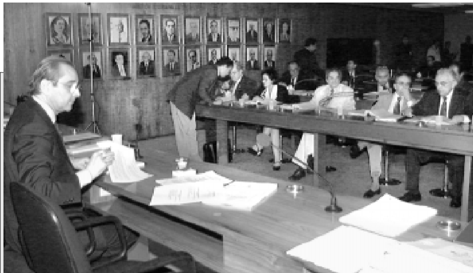
A CCJ aprovou parecer favorável a substitutivo da Câmara, que agora seguirá para o plenário do Senado