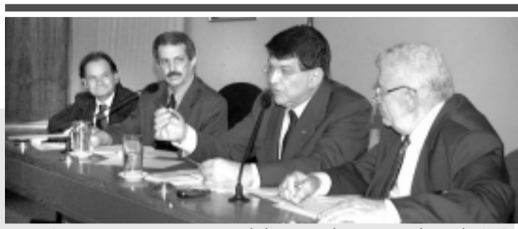
Comissão mista ouviu universidades particulares e presidente da UNE

Respondendo a Romeu Tuma (PFL-SP) sobre a segurança dos vôos, Grossi afirmou que o DAC realiza cuidadosa inspeção dos aviões brasileiros e de países com os quais o Brasil não tem convênio nesse sentido.