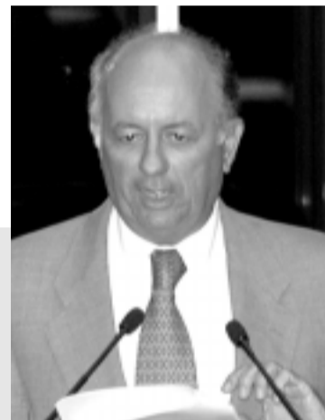
Althoff explicou, na audiência pública, que incremento ao turismo rural desenvolverá o interior

O senador Geraldo Althoff (PFL-SC) defendeu o incentivo ao turismo rural como alternativa de fonte de renda para as famílias e de melhoria da qualidade de vida e de trabalho, o que poderia contribuir para fixar o homem no campo, evitando o êxodo rumo às cidades. O senador fez essas considerações ao tomar parte de uma audiência pública sobre o tema "Turismo Rural, Profissionalização e Cooperação para o Desenvolvimento", na Comissão Parlamentar Conjunta do Mercosul. Tomaram parte dos debates representantes do governo, parlamentares e entidades ligadas ao setor.