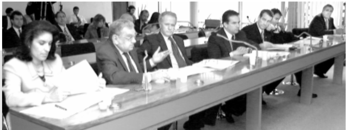
Na Comissão de Educação, os senadores discutem a importância da proposta de apoio aos músicos antes de aprová-la

Depois dessa visita, os senadores da subcomissão devem participar de um encontro com o Conselho Estadual do Meio Ambiente (Conema) do Rio de Janeiro para ouvir membros do governo e das organizações não governamentais.