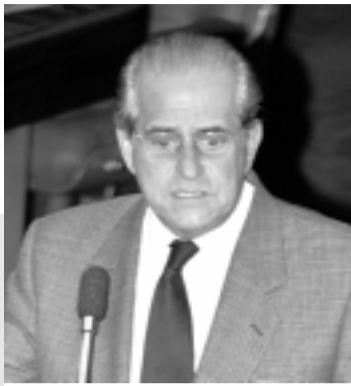
Tebet preside comissão mista que examina alterações na legislação sobre os fundos constitucionais