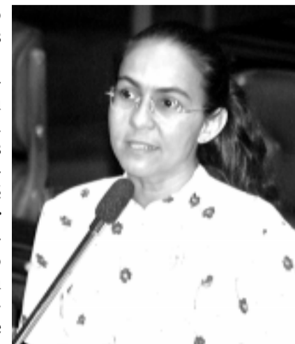
Heloísa: política agrícola penaliza os mais pobres, aprofundando o quadro dramático do setor

Em aparte, o senador Maguito Vilela (PMDB-GO) afirmou que a agricultura brasileira está falida. “O governo penaliza os produtores de maneira criminosa, sem entender que esse é o único setor que pode gerar os empregos de que o país necessita”. Também em aparte, o senador Ernandes Amorim (PPB-RO) manifestou preocupação com o abandono em que se encontram os agricultores de seu estado e com “essa reforma agrária do governo que ninguém consegue ver”.