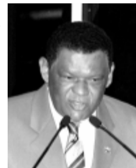
Cândido: pequena bancada no Congresso é prova da desigualdade

mulheres continuem a ser vítimas “da indiferença do poder público quanto as suas necessidades”, lembrando que o Brasil figura entre os países latino-americanos com os mais altos índices de mortalidade materna.