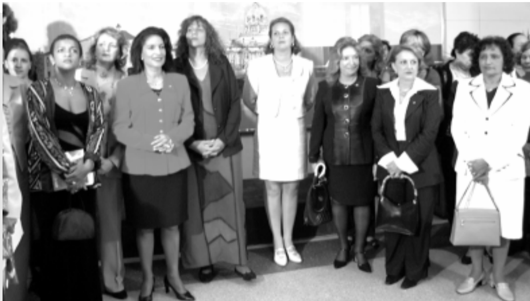
Senadoras e deputadas participaram de homenagem a 25 mulheres que marcaram a história brasileira