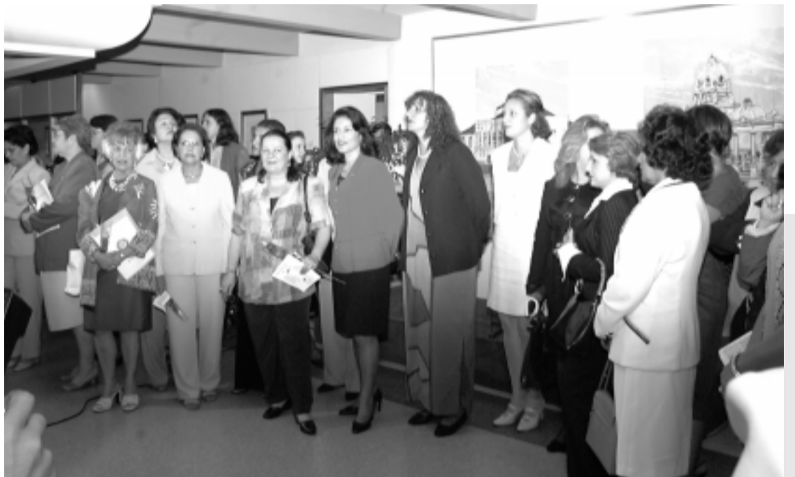
Solenidade na Biblioteca do Senado marcou a homenagem feita pelas parlamentares a 25 mulheres que marcaram a história brasileira, por seu legado de conquistas

Amanhã, senadoras e deputadas participam de dois eventos no Auditório Tancredo Neves, no Ministério da Justiça: às 10h, assinatura de protocolo de cooperação entre o CNDDM, Ministério do Trabalho, Fundação Roberto Marinho e Secretaria de Ação Social; e, às 11h, acontece o debate "Mulher e Poder".