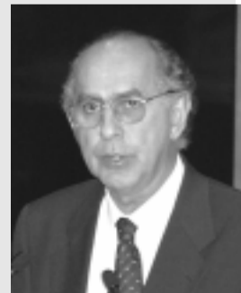
Mauro ressaltou que ainda há um longo caminho a percorrer

bém, que a representação feminina no Congresso Nacional – 28 deputadas e seis senadoras – é um indício significativo do quanto ainda é pequena a participação da mulher na política nacional, embora a população feminina constitua 47,9% do eleitorado brasileiro.