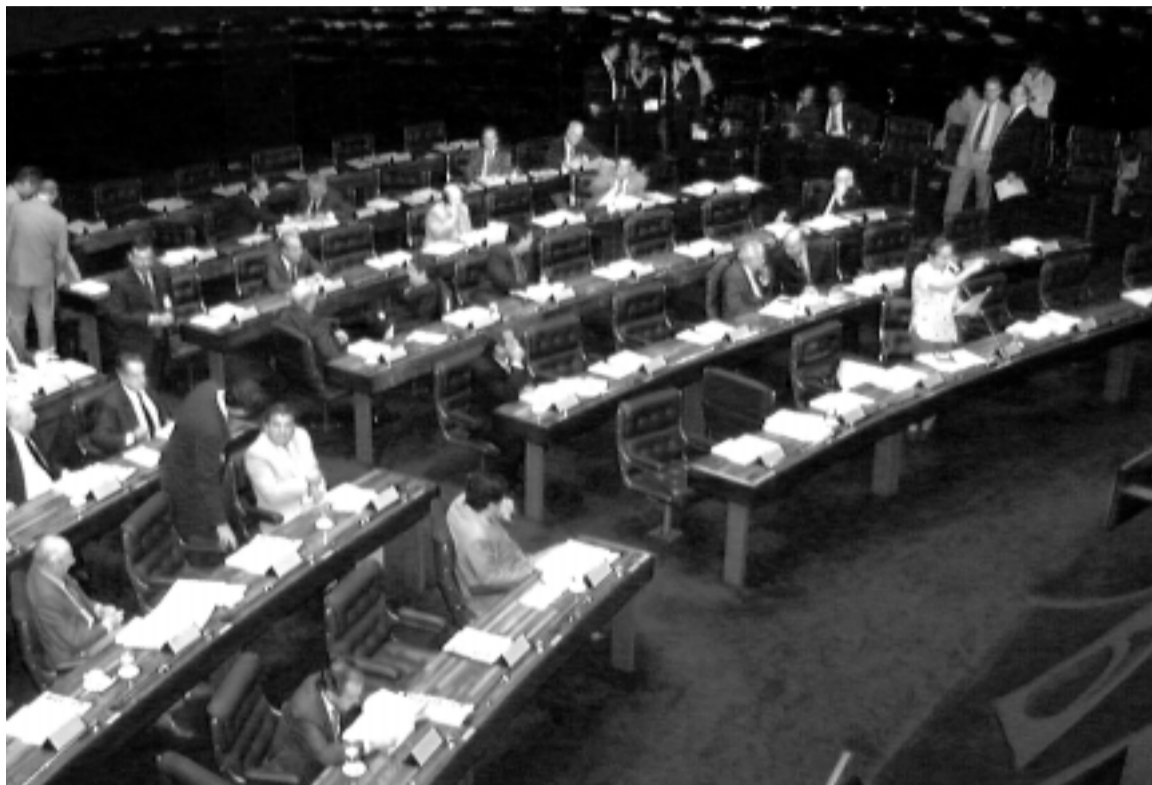
Plenário votou ontem acordos e empréstimos internacionais e hoje decide sobre a DRU

O Plenário do Senado aprovou ontem requerimento do presidente da Casa, senador Antonio Carlos Magalhães, para inserção em ata de voto de profundo pesar pela morte de Lucy Geisel, viúva do ex-presidente Ernesto Geisel. Na ocasião, foi também aprovada a decisão de enviar mensagem de condolências à família da ex-primeira-dama.