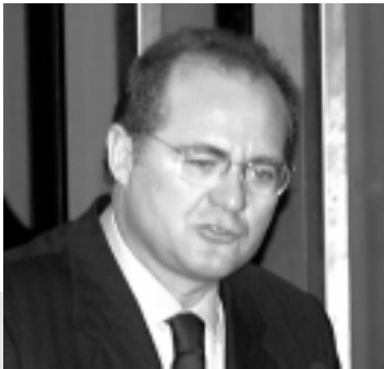
Para Renan Calheiros, a lei pode ser instrumento eficaz de combate ao narcotráfico