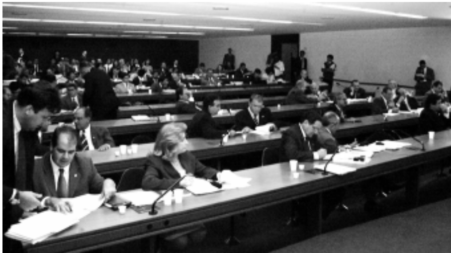
Comissão Mista de Orçamento faz audiência e aguarda decisão dos líderes sobre projetos

Na quarta-feira passada, o comitê de receitas da Comissão Mista de Orçamento decidiu propor às lideranças partidárias a destinação de metade da verba reservada às emendas de parlamentares no projeto de Orçamento – fixada em R$ 1,6 bilhão – para o aumento do salário mínimo. Além disso, o comitê concordou com uma sugestão do Poder Executivo de cortar R$ 300 milhões nas verbas de custeio no próximo ano. Mais R$ 1,7 bilhão seria adicionado a esse cálculo pela aprovação de dois projetos que tramitam na Câmara destinados a combater a sonegação de impostos e a elisão fiscal. As três medidas somadas seriam capazes de render aos cofres públicos os R$ 2,8 bilhões necessários para o custeio do novo salário mínimo.