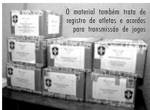
O material também trata de registro de atletas e acordos para transmissão de jogos

Sobre o depoimento do ex-treinador da Seleção Brasileira Wanderley Luxemburgo, marcado para as 9h da próxima quinta-feira, o senador Álvaro Dias esclareceu que o treinador terá as declarações que prestar aos mem-