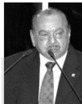
Mestrinho: as nações ricas devem financiar a conservação de florestas

O maior problema, para ele, é a recusa das nações ricas em diminuir a emissão de gases. "Sempre teremos posição contrária quando os países ricos defenderem o meio ambiente às nossas custas. Se que-