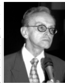
Jefferson: Congresso não pode ficar "impávido a esse abuso do Executivo"

Jefferson ressaltou que a não atualização das faixas de isenção do IR tem alto custo para os assalariados, sobretudo os servidores públicos, "que são duplamente lesados, com o congelamento dos salários e a não correção da tabela". Ele informou que juízes de 1º grau têm concedido liminares pela correção, mas elas vêm sendo cassadas pelo Supremo Tribunal Federal (STF), sem apreciação do mérito. "Duvido muito que o Judiciário considere constitucional o aumen-