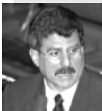
Jucá lembrou incêndio há dois anos e meio

O senador Romero Jucá (PSDB-RR) elogiou o anúncio pelo Ministério do Meio Ambiente de medidas preventivas ante a possibilidade de incêndios em Roraima. Há cerca de dois anos e meio, observou, o estado passou por situação de extrema dificuldade com um incêndio que devorou grande parte do território estadual, atingindo inúmeras propriedades de pequenos produtores rurais.