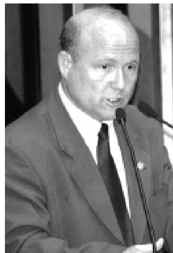
Sebastião Rocha comparou a trajetória de João Capiberibe com a de Fernando Collor

Na opinião do senador pelo Amapá, Capiberibe na verdade não pretende disputar a Presidência da República, por saber que não teria chances. "Ele quer ser o vice de Lula (Luís Inácio Lula da Silva, provável candidato do PT)", comentou. O senador Antonio Carlos Valadares (PSB-SE) defendeu o direito de Ronaldo Lessa emitir qualquer