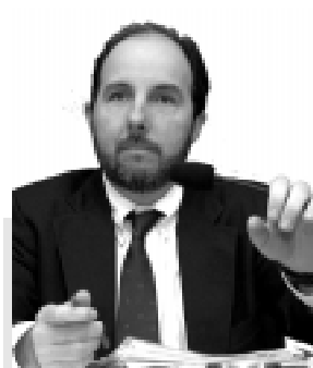
Armínio Fraga, presidente do BC, deve falar sobre ações contra vazamentos