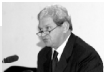
Humberto Souto falará sobre o trabalho realizado pelo TCU

Antes da exposição de Humberto Souto, a comissão votará proposta do Poder Executivo que abre ao orçamento fiscal da União crédito suplementar no valor de R$ 55,5 milhões destinado ao refinanciamento da dívida pública mobiliária federal.