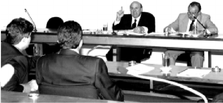
A Comissão de Fiscalização e Controle também requereu toda a documentação sobre a criação do Federal Cap, Federal Previ e Federal Card