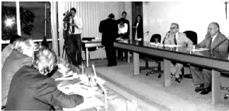
A proposta que limita o uso de armas de fogo gerou intenso debate entre os integrantes da Comissão de Relações Exteriores

A Comissão de Relações Exteriores e Defesa Nacional (CRE) aprovou ontem o substitutivo do senador Pedro Piva (PSDB-SP) que restringe o uso de armas de fogo, proibindo o porte para o cidadão comum, mas permitindo a posse na resi-