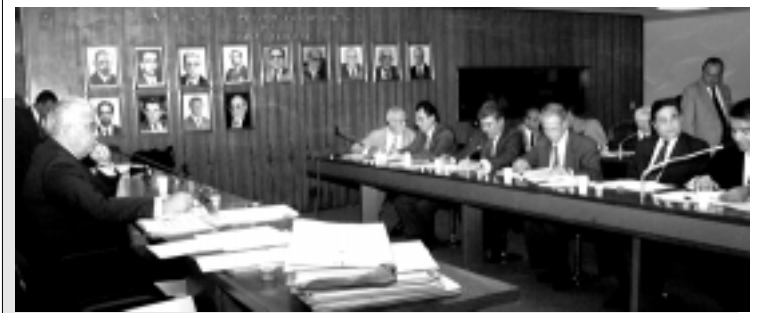
O projeto aprovado pela Comissão de Educação garante que os municípios recebam as verbas diretamente do Fundef

Segundo Álvaro Dias, com as alterações, os municípios poderão receber recursos do salário-educação diretamente do Fundef, sem a necessidade de interposição das secretarias estaduais.