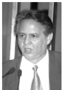
Antero considera atitude de Tasso “eleitoreira”

A postura de Tasso e o silêncio do PSDB quanto à posição que deve assumir na votação do relatório do senador Roberto Saturnino no Conselho de Ética e Decoro Parlamentar provocaram a indignação de Antero. O senador lamentou que, durante a convenção nacional do PSDB, realizada no último sábado, não se tenha debatido “a falta de ética que assola o Senado”. O senador classificou o partido de omissivo, pois no seu entendimento é inadmissível que o PSDB não se guie pela vontade das ruas e sim pelas conveniências político-eleitoreiras. “Longe das benesses oficiais, mas perto do pulsar das ruas” — concluiu, lembrando o lema do partido.