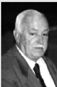
ACM já esperava prazo “bem maior” que 24 horas

— Eu tenho os meus juristas. Não pretendo criar caso, mas também não aceito segregação — disse. Antonio Carlos sustentou que, se o relator do processo na Mesa apresentar seu parecer em 24 horas, caso ele seja aprovado hoje pelo Conselho de Ética e Decoro Parlamentar do Senado, “terá de ser um gênio para conseguir ler as mais de 2 mil páginas do processo”.