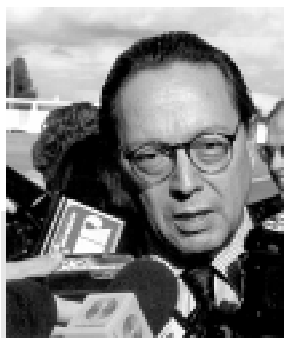
Pedro Malan, ministro da Fazenda, não quis comentar a denúncia

Segundo o senador Eduardo Suplicy (PT-SP), que apresentou requerimento juntamente com a senadora Heloísa Helena (PT-AL) e o senador Romero Jucá (PSDB-RR), a CAE deve apresentar questionamentos ao ministro e à diretora do BC sobre a suposta chantagem feita pelo ex-dono do Banco Marka, Salvatore Cacciola, ao ex-presidente do Banco Central Francisco Lopes. A chantagem teria levado o BC a vender dólares ao Marka abaixo do preço praticado pelo mercado.