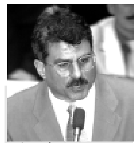
Segundo Jucá, oposição também se beneficiou com liberação de recursos

– Quero aqui restabelecer a verdade, porque todo ano o governo faz a liberação dos recursos das emendas apresentadas pelos parlamentares, mas a oposição fica