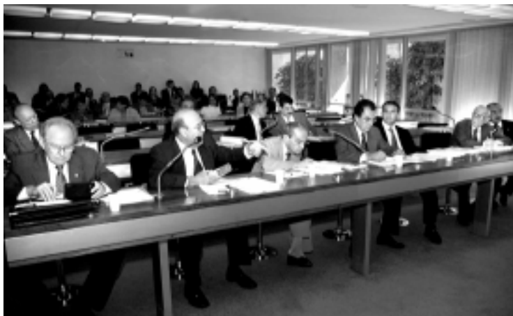
Membros da CAE acolheram também parecer de Amir Lando sobre despesas do Supremo Tribunal Federal

O líder do governo, Romero Jucá (PSDB-RR), apresentou voto em separado contrário ao projeto, por