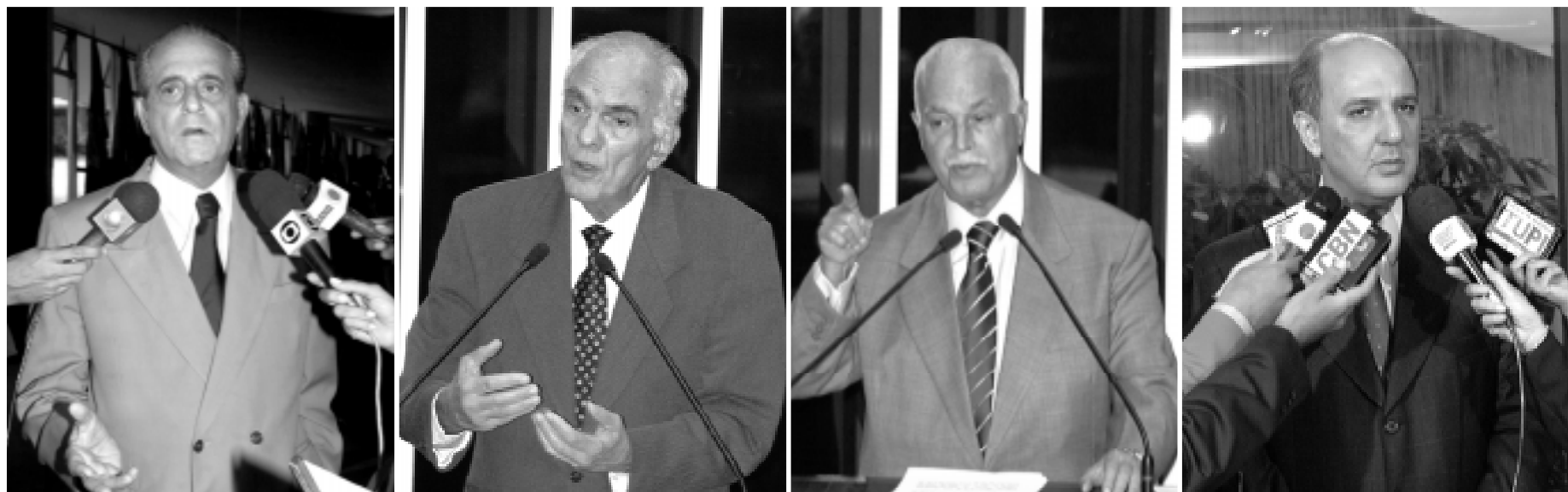
Ramez Tebet preside a reunião do Conselho de Ética em que será votado o relatório de Roberto Saturnino pedindo a abertura de processo contra Antonio Carlos Magalhães e José Roberto Arruda

ANO VII – Nº 1.302 – BRASÍLIA, QUARTA-FEIRA, 23 DE MAIO DE 2001