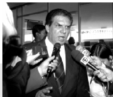
Jader Barbalho pediu informações à área técnica para agir “apoiado no Regimento”

O presidente do Senado disse também que foi informado de que poderá votar, ou, igualmente, abster-se, só sendo obrigado a manifestar-se para desempate. O relator será um dos sete membros titulares da Mesa do Senado, e terá sete dias para apresentar parecer; havendo pedido de vista, serão dados cinco dias, sendo estes prazos contados dentro da previsão de 15 dias de tramitação da matéria na Mesa.