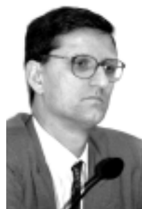
Tolmasquim: ajuste exigiu corte de despesas

Paulo (USP), que procuraram demonstrar ontem com argumentos e dados de pesquisas recheados de gráficos durante quatro horas de depoimentos na Comissão de Serviços de Infra-Estrutura (CI).