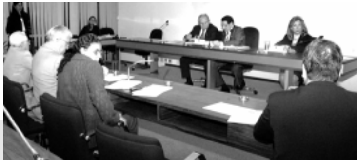
A CPI que investiga irregularidades na atuação de ONGs aprovou ontem agenda de trabalho que vai até o dia 18 de setembro

Segundo Jucá, o distrito agropecuário viabilizará o aumento da oferta de alimentos nos mercados da Amazônia Ocidental, o aproveitamento regional de recursos naturais e a diminuição dos custos de produção e comercialização de bens agrícolas e extrativistas, além de gerar novos empregos.