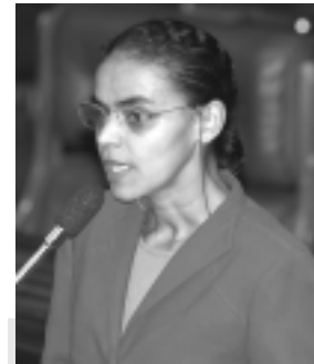
Segundo Marina Silva, medidas no Acre e Amapá têm reduzido os incêndios

Só Mato Grosso e Pará registram em agosto praticamente a metade de todos os incêndios da Amazônia. A exceção, conforme Marina, são Acre e Amapá, cujos governos vêm adotando políticas de preservação de suas matas e de conscientização dos agricultores para que evitem queimadas. No Acre, ocorreram neste mês apenas 136 incêndios, conforme o Inpe. Na noite de ontem, os satélites constataram 1.458 pontos de fogo em toda