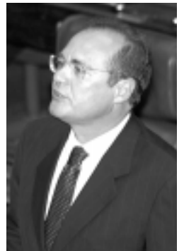
Renan Calheiros diz que medida satisfaz a população alagoana

do fornecimento de energia para a b a s t e c e r nova unidade de produção. O pedido, afirmou Renan Calheiros, foi feito antes do anúncio do racionamento de eletricidade.