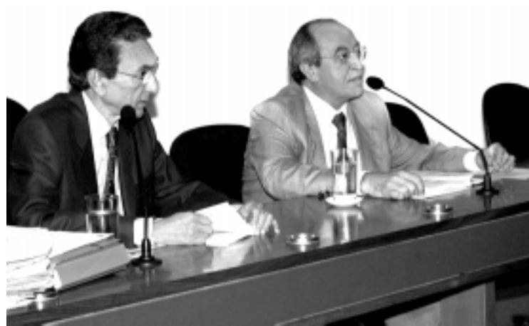
Ao lado do senador Edison Lobão, Alcântara (D) presidiu reunião da CAE

A CAE, presidida pelo senador Lúcio Alcântara (PSDB-CE), aprovou ainda pareceres favoráveis aos pedidos do Ceará e de Pernambuco para contratar operação de crédito junto ao Banco do Nordeste do Brasil, com recursos do Banco Interamericano de Desenvolvimento (BID). Para o Ceará, serão destinados US$ 7 milhões, e para Pernambuco, US$ 5,12 milhões para investimento no Projeto de Desenvolvimento do Turismo do Nordeste (Prodetur-