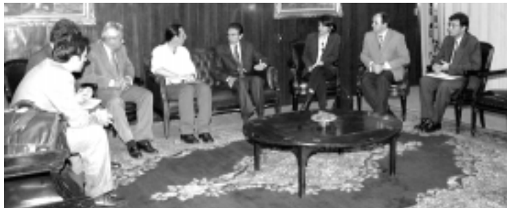
Representantes de entidades disseram a Lobão que é importante apressar a votação de proposta que federaliza os crimes de tortura