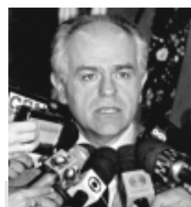
Pimenta da Veiga abordará atendimento às periferias pobres

A Comissão Mista de Orçamento ouvirá hoje, a partir das 14h30, esclarecimentos do ministro das Comunicações, Pimenta da Veiga, sobre o desempenho do Fundo de Universalização das Telecomunicações (Fust). O fundo retém 1% do faturamento das