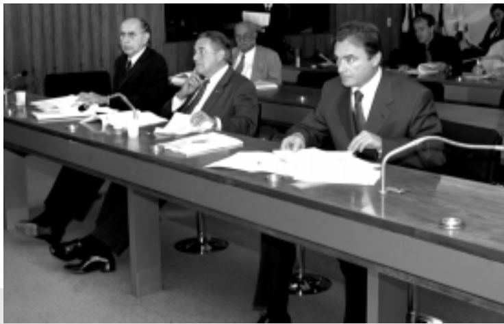
A Comissão de Educação aprovou o substitutivo em caráter terminativo

O substitutivo prevê a manutenção, pelos provedores da Internet, por no mínimo um ano, do registro de todas as conexões efetuadas por seu intermédio. As informações deverão conter hora de início e término da conexão e o protocolo acessado. Os provedores também deverão manter cadastro atualizado dos clientes, com identificação civil, inscrição no Cadastro de Pessoas Físicas (CPF) ou no Cadastro Nacional de Pessoas Jurídicas (CNPJ) e endereço. Os dados referentes às conexões realizadas pelo usuário, bem como o conteúdo, só poderão ser forneci-