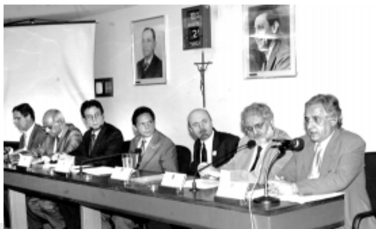
Representantes de diversas entidades participaram do debate sobre tarifa na comissão mista que estuda as causas da crise de energia