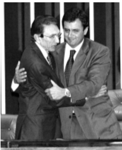
Edison Lobão visitou o presidente da Câmara dos Deputados, Aécio Neves

Lobão fez essa avaliação ontem, depois de visitar o deputado Aécio Neves (PSDB-MG), que se encontrava em Plenário presidindo sessão da Câmara. Ficou acertado entre os dois que não acontecerá mais o encontro das duas Mesas para discutir o assunto, em virtude da questão ter ido