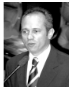
Hartung pediu ao relator na Câmara que não seja desfigurado o projeto

Ele afirmou não pretender que a Câmara aprove o projeto na forma como foi remetido pelo Senado. "Mas não deve ser feita uma negociação que desfigure a matéria, que transforme o seu sentido, que é o sentido da justiça social", enfatizou.