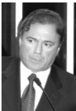
Álvaro Dias vê elementos consistentes para ação popular

De acordo com Álvaro Dias, o processo de privatização da companhia "é viciado desde o princípio". Ele afirmou que a licitação para contratação da consultoria que avaliou a empresa foi dirigida e que há a suspeita de que o edital para o leilão também esteja direcionado para que vença a empresa alemã RWE.