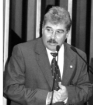
Carlos Patrocínio: Brasil precisa de serviço público eficiente

O senador Carlos Patrocínio (sem partido-TO) defendeu ontem um reajuste salarial digno para o servidor público federal. Ele lembrou que o Brasil só poderá inserir-se na economia globalizada se contar com um serviço público eficiente, com servidores capacita-