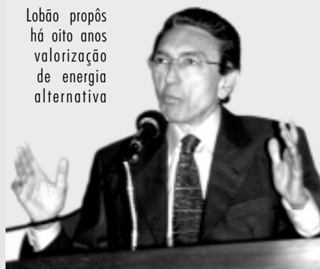
Lobão propôs há oito anos valorização de energia alternativa

O seminário foi uma iniciativa da Comissão de Serviços de Infra-Estrutura e da Federação Nacional dos Engenheiros. Teve