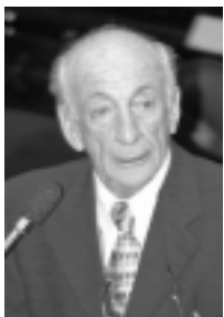
Lauro Campos: governo do DF mentiu