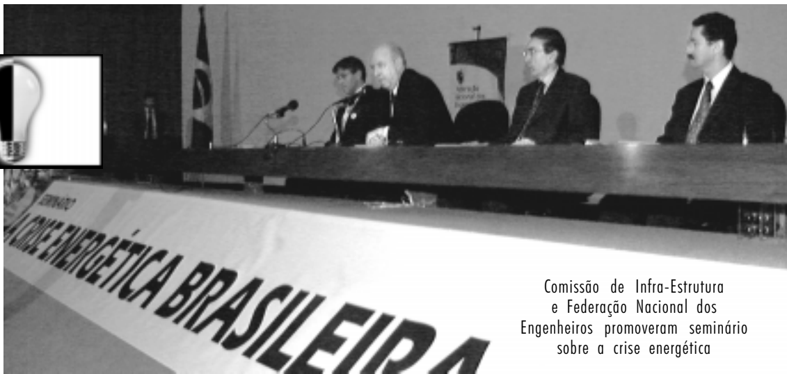
Comissão de Infra-Estrutura e Federação Nacional dos Engenheiros promoveram seminário sobre a crise energética

— O governo brasileiro está muito ocupado em resolver os pro-