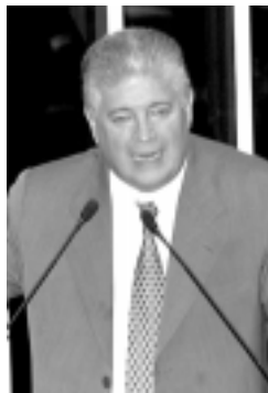
Segundo Requião, venda da Copel é compromisso com o FMI