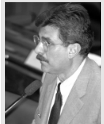
Jucá lembrou episódios importantes da história do Brasil que tiveram participação de maçons

O senador justificou sua ausência na homenagem prestada pelo Senado aos maçons. No dia, afirmou, ele estava participando de compromissos políticos no seu estado. Jucá elogiou a Maçonaria por ter como seu principal objetivo a luta pela construção de um mundo melhor para a humanidade.