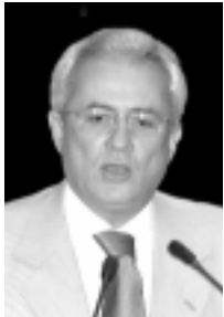
Carlos Wilson homenageou senadores do PPS

O senador Carlos Wilson (PE) comunicou ontem ao Plenário seu desligamento do Partido Popular Socialista (PPS) e sua filiação ao Partido Trabalhista Brasileiro (PTB). Ele disse estar ainda unido ao PPS na busca de um projeto