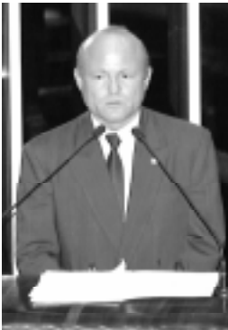
Sebastião Rocha, relator da proposta, solicitou audiências

O representante do Amapá no Senado observa que os cirurgiões plásticos não vêem risco no uso do silicone, embora sejam contrários à obrigatoriedade de o paciente assinar termo de responsabilidade assumindo que está se submetendo à cirurgia por seu livre consentimento e que está esclarecido de que o silicone tem caráter estritamente estético.