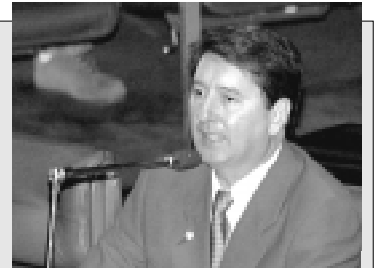
Segundo Maguito Vilela, "o PMDB não pode mais aceitar o rótulo de partido de elite"

Para o senador, "é inaceitável que o presidente da República, que integra um outro partido, queira influir nos rumos do