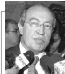
Alcântara: Brasil obteve prestígio internacional

— É forçoso que nos empenhemos em encontrar soluções capazes de devolver a dignidade profissional à categoria, expressa no elemento direito à remuneração e ao reconhecimento, por toda a sociedade, de suas tradições de competência e dedicação ao progresso do Brasil — concluiu Nabor Júnior.