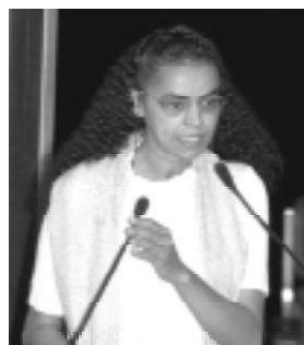
Marina afirma que não há compromisso com programas prioritários

A senadora lembrou que em 1999, logo após firmar acordo