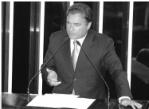
Álvaro Dias é relator de proposta sobre registro das conexões entre usuários e provedores

O projeto dá especial atenção aos delitos cometidos contra concessionárias de serviços públicos, como distribuição de energia elétrica, centrais telefônicas e outros. Nesses casos, o projeto estabelece agravamento das penas. Para a difusão de material injurioso na Internet, por exemplo, o senador propõe pena de detenção de seis meses e multa.