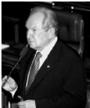
Bernardo Cabral: participação da OAB é fundamental