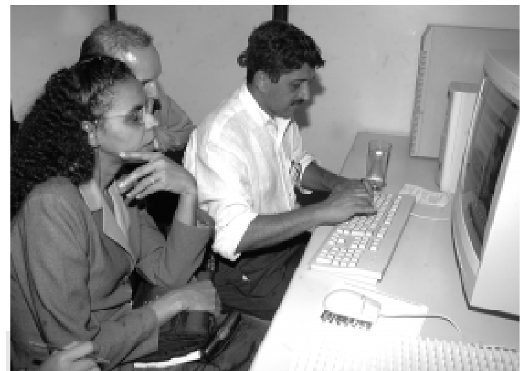
Perguntas de quase 400 internautas sobre política ambiental e agricultura no país foram respondidas por Marina Silva