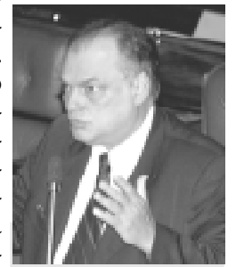
Para Roberto Freire, é preciso considerar a realidade da juventude

Ressaltando ser contrário à edição de medida provisória para regulamentar a matéria, Freire afirmou que