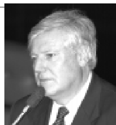
Lando defende investimentos para melhoria do rebanho e preço justo para o produto

derado uma commodity como outra qualquer, ao sabor das leis do mercado, principalmente o internacional — disse, lembrando que os países desenvolvidos subsidiam sua agricultura.