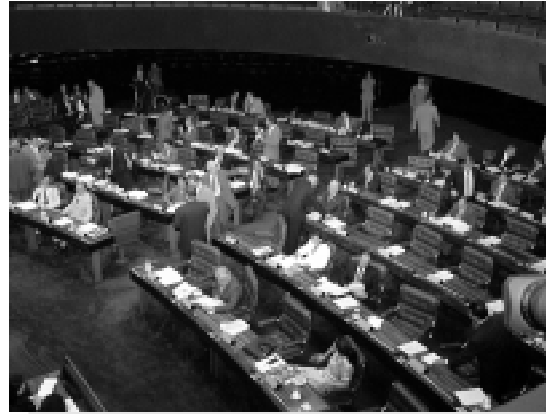
O Plenário também examina proposta sobre ICMS nas operações com petróleo

Também em segundo turno, o Senado vota na quarta-feira a PEC do senador Geraldo Melo (PSDB-RN) que atribui aos estados produtores a cobrança de ICMS nas