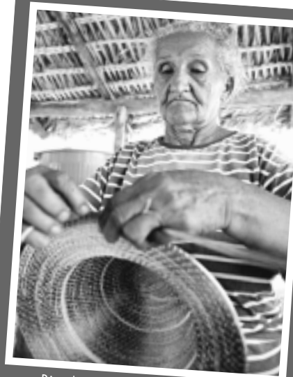
Dia do A ancião e Dia Internacional do Idoso foram registrados em Plenário

Senadores defendem medidas de proteção ao idoso