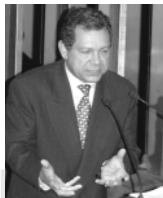
Segundo Leomar Quintanilha, há no Brasil mais de 15 milhões de idosos

Já o senador Romero Jucá (PSDB-RR) enalteceu os avanços dos direitos do idoso ocorridos no governo Fernando Henrique e anunciou o programa Cabelo de Prata , da prefeitura de Boa Vista (RR), que amplia o atendimento aos idosos. O senador Tião Viana (PT-AC), na presidência dos trabalhos, associou-se às homenagens.