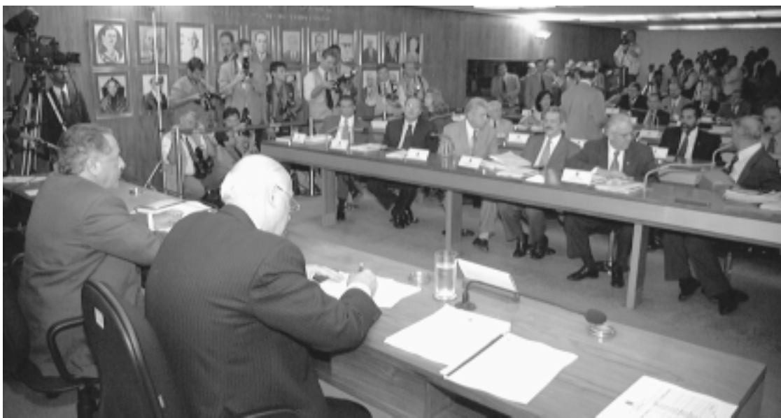
O Conselho de Ética aprovou por 11 votos favoráveis e 4 contrários relatório da comissão que investigou as acusações

— O senador terá todo o direito de apresentar sua defesa e pedir perícia dos documentos. Nós, do PT, nos comprometemos a votar pela absolvição, caso não se consigam provas que demonstrem que Jader é culpado — disse o senador José Eduardo Dutra.