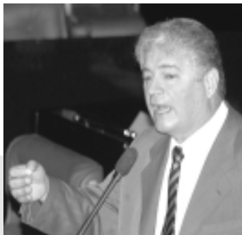
Projeto de Roberto Requião foi acolhido na forma de substitutivo apresentado por Romeu Tuma

— O projeto foi objeto de discussão com o Tribunal Superior Elei-