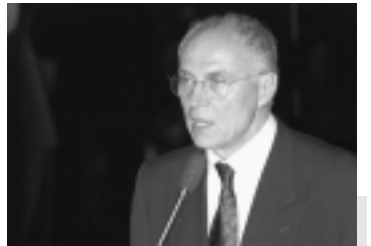
Conforme pedido de Suplicy, Malan deve esclarecer crédito do BNB a cooperativa no Maranhão

Com parecer favorável do senador Osmar Dias (PDT-PR), o Plenário aprovou projeto de lei da Câmara que revoga dispositivo de decreto-lei segundo o qual o credor de um financiamento de bem móvel pode pedir a prisão do devedor. Em defesa da proposta, o senador Hugo Napoleão (PFL-PI) alertou que, apesar de contrário às garantias dadas em uma democracia, o artigo do decreto-lei continua em vigor. A matéria volta à Câmara, pois recebeu duas emendas na Comissão de Constituição, Justiça e Cidadania.