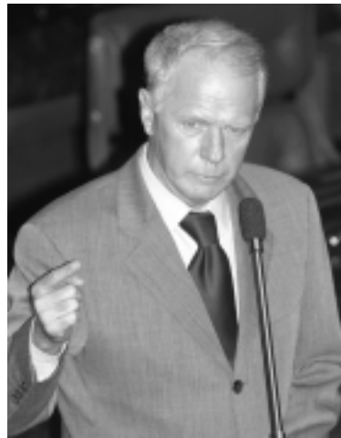
Camata registra demanda crescente por serviços e produtos de menor impacto ambiental

— Observa-se uma demanda crescente por serviços e produtos que causem menor impacto ambiental, sobretudo nos países desenvolvidos, cujos consumidores não hesitam em pagar mais pelos chamados “produtos verdes”. Ao conscientizar e incenti-