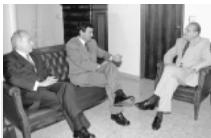
Michel Temer acompanhou Aécio Neves na visita a Ramez Tebet

contro com "expectativa muito positiva", mas não deu detalhes da fórmula pretendida, adiantan-