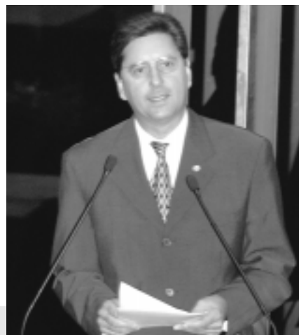
Maguito Vilela disse que o Brasil está envelhecendo rapidamente. A cada ano, 650 mil pessoas ultrapassam os 60 anos

Maguito lembrou que foi com base em preceitos da Organização das Nações Unidas (ONU) que Goiás criou o Vila Vida, projeto que vem contribuindo para a melhoria da qualidade de vida de mais de 1.500 idosos no estado. Segundo relatou, a implantação do projeto foi iniciada pelo ex-governador Iris Rezende. O programa teve continuidade durante a gestão do próprio Maguito, quando governador.