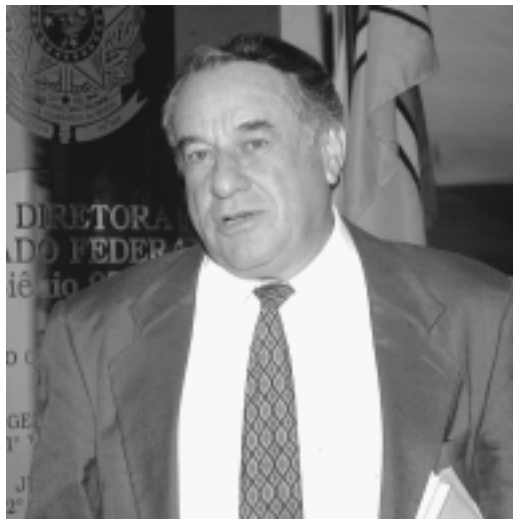
Juvêncio da Fonseca disse que Jader poderá requerer a produção de provas e perícia em documentos

— Ele agora poderá pedir todas as perícias e terá ampla defesa —