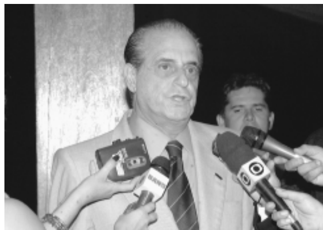
Ramez Tebet diz que fará “todo o possível, nos limites do razoável”, pela conciliação no Congresso Nacional

— Não houve prejuízo algum, porque a matéria, no mérito, já estava julgada — esclareceu.