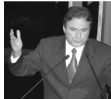
Álvaro Dias disse considerar “incompreensível e inaceitável” o comportamento de FHC

Jader não quer que a Mesa do Senado decida se aceita ou não a abertura de processo, aprovada ontem pelo Conselho de Ética, até que seja concluída a perícia determinada por uma juíza federal do Pará. O senador entende que a perícia irá inocentá-lo.