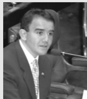
Eduardo Siqueira Campos defende implantação de usina eólica no Jalapão, no Tocantins

A implantação da usina, segundo informou o senador, demanda menos recursos do que os utilizados para a construção de usinas tradicionais, com a vantagem de viabilizar geração limpa, ecológica e barata de energia. Especialistas da Universidade de Campinas (Unicamp) e da Faculdade da Terra são os responsáveis pelo projeto, acrescentou.