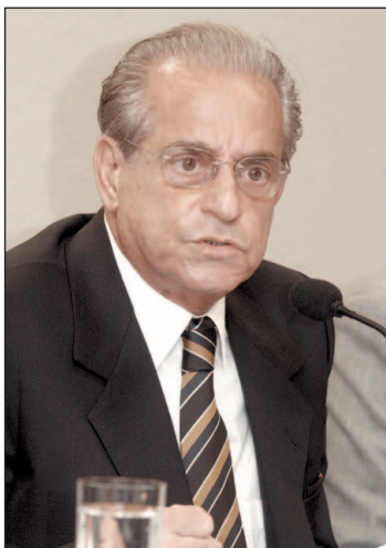
Tebet negocia com o governo o parcelamento das dívidas fiscais de empresas em recuperação