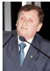
Mão Santa reclama do alto preço do gás e da gasolina