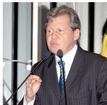
SINDICÂNCIA Governo não conseguiu esclarecer os fatos, diz Arthur Virgílio