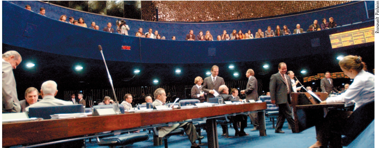
PROVIDÊNCIAS Ao presidir a sessão, Sarney (ao lado de Eduardo Siqueira Campos e Ney Suassuna) destacou a importância do debate – idéia apresentada no Plenário