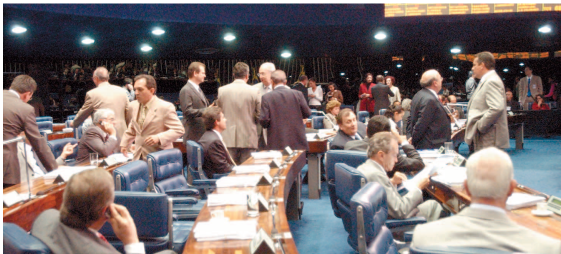
POLÊMICA Mudança na estrutura do Executivo é chamada de trem da alegria por opositores