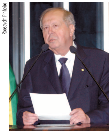
SOLUÇÃO João Tenório aponta necessidade de segurança para investidor privado

O senador João Tenório (PSDB-AL) anunciou que deverá apresentar no próximo dia 27, na Comissão de Serviços de Infra-Estrutura (CI), o relatório sobre o projeto que institui o sistema de parceria público-privada (PPP). Na opinião do senador, a questão das garantias para os investimentos a serem feitos pelo setor privado na construção de obras de caráter público, pelo novo modelo que o governo quer implantar, é o ponto do