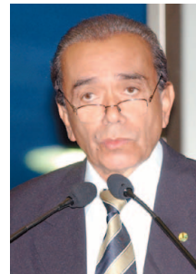
Região precisa do empreendimento, afirma Motta

O parlamentar pelo Piauí reclamou do alto preço da gasolina vendida no Brasil, 11,5% mais cara do que a média do mercado internacional.