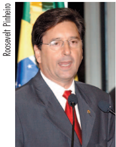
Maguito: arquivo da Casa recebe nome da poetisa

Para Maguito, Cora Coralina significa "a imagem e modelo da capacidade de superação das dificuldades enfrentadas como mulher que vive em uma sociedade de predominância masculina". A imposição de seu nome ao Arquivo do Senado, que guarda decisões importantes tomadas pela Casa desde o Império, reforçou o parlamentar, "será a junção de dois repositórios significativos da memória nacional: um físico, representado pelos documentos, e outro imaterial, representado por tudo o que significa Cora Coralina para o Brasil".