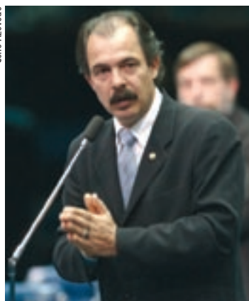
MUDANÇA Mercadante: diferença entre monitores de vídeo e de computadores vai acabar

Mercadante explicou que quando da aprovação da emenda constitucional da reforma tributária, no ano passado,