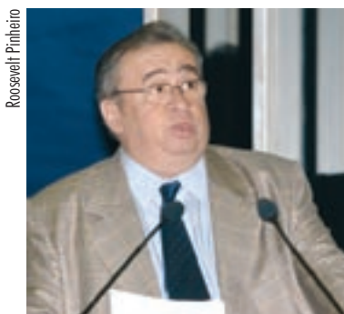
COBRANÇA Para Heráclito, decisão de "tecnocratas do governo" rompe entendimento com o Congresso