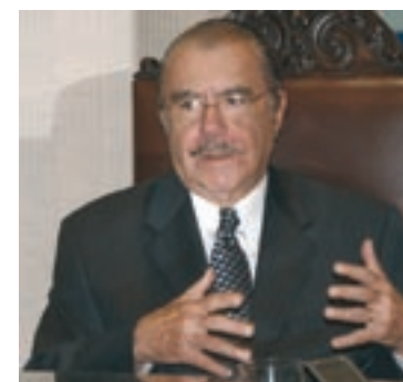
PREVISÕES Sarney vê caminho livre para Lei de Informática, reforma do Judiciário e biossegurança

sastres, e o benefício não pode exceder R$ 300 por família. As condições de concessão desse auxílio são condicionadas ao cumprimento das exigências do Comitê Gestor Interministerial. A urgência e relevância da matéria são justificadas pelo Ministério da Integração Nacional devido à falta de condições de sobrevivência da população atingida. O ministério apontou os seguintes problemas enfrentados pelas vítimas: frustração de safras, carência de alimentos, esgotamento de reservas hídricas, precariedade de habitações e dizimação de rebanhos. Duas emendas foram rejeitadas pelo relator da matéria, senador Flávio Arns (PT-PR).