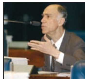
CONVITE Maciel deseja conhecer planos da secretária da organização de cooperação amazônica

A comissão aprovou ainda parecer favorável ao projeto