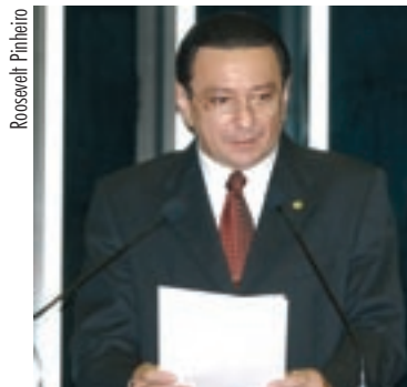
COMPETÊNCIA Segundo Papaléo, 2.200 pesquisadores da empresa são “altamente qualificados”

Papaléo classificou o corpo de funcionários da Embrapa como “altamente qualificado”. O senador acrescentou que, no total, são 2.200 pesquisadores