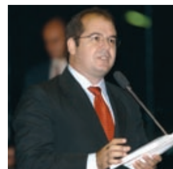
URGÊNCIA Tião Viana adverte que governo poderá ser forçado a editar medida provisória

O senador, que vai coordenar a subcomissão encarregada de buscar soluções para os pontos polêmicos da Lei de Informática, disse que o projeto deverá ser votado com duas ou três modificações em relação ao texto encaminhado pela Câmara, mas sem prejudicar o que determina a Constituição.