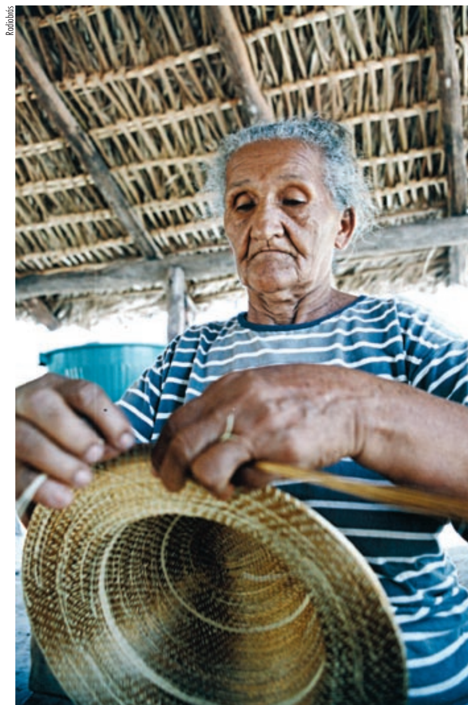
DIREITOS O Estatuto do Idoso é apontado por Paulo Paim como um "divisor de águas" na vida de 20 milhões de brasileiros que já passaram dos 60 anos de idade

Ao fazer balanço do primeiro ano de vigência da lei, senador observa que mais de 1 milhão de idosos recebem um salário mínimo mensal e os cidadãos da terceira idade estão obtendo prioridade no atendimento à saúde