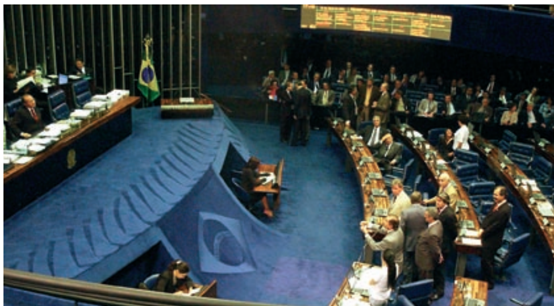
PAUTA Além do projeto de reajuste do IR, o Senado poderá analisar sete propostas de emenda à Constituição

Já o ministro da Defesa e vice-presidente da República, José Alencar, e o ministro do Turismo, Walfrido Mares Guia, participaram de audiência para debater a crise enfrentada pelas companhias aéreas. Em outra ocasião, o ministro do Turismo voltou à comissão para expor os programas de turismo do governo para as regiões Norte, Nordeste e Centro-Oeste.