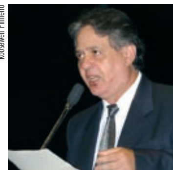
RIGOR Projeto de Antero visa evitar que culpados por crime contra ordem tributária escapem do fisco

– A CPI do Banestado, por exemplo, apontou vários suspeitos de crimes contra a ordem tributária que não podiam mais ser executados pelo fisco. Nesses casos, o crime compensa, pois, mesmo com a condenação na Justiça, o indiciado pode usufruir dos seus proven-