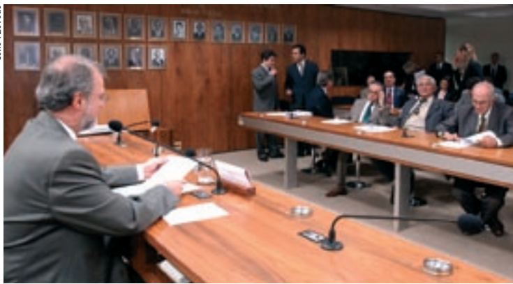
MISSÃO CRE vai examinar mensagem que indica o ex-ministro José Viegas para ocupar, cumulativamente com a embaixada na Espanha, a de Andorra