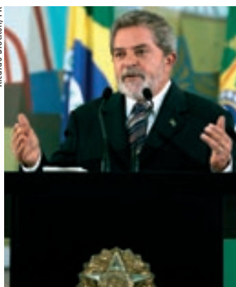
RAZÕES Lula explica, no relatório, que o Congresso havia reestimado previsão de arrecadação tributária

Conforme o relatório, haverá uma diferença de R$ 4,5 bilhões a menos na receita do Imposto de Produtos Industrializados (IPI), comparando-se a reestimativa do Congresso em dezembro passado e as mais recentes previsões da Secretaria da Receita Federal.