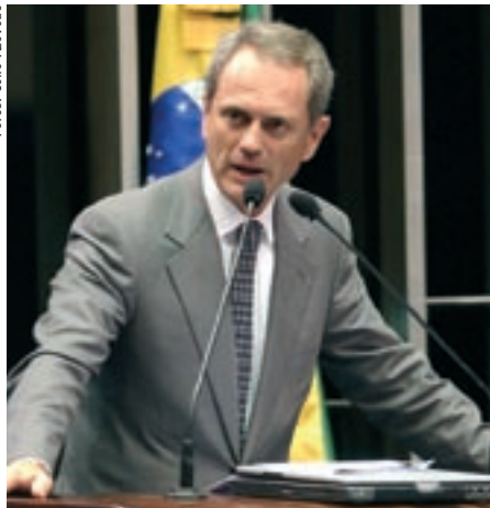
REFORMA Proposta fortalece organização sindical vertical, afirma Paulo Octávio

Ao saudar os trabalhadores e suas lideranças pela passagem do Dia Mundial do Trabalho, o senador Paulo Octávio (PFL-DF) disse que a data é oportuna para o debate sobre as mudanças necessárias na área trabalhista. Ele destacou que o Congresso está analisando a proposta de reforma sindical encaminhada pelo governo no mês de março.