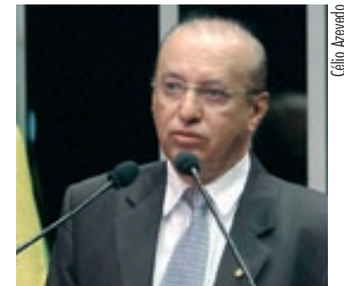
BENEFÍCIOS Pequenos litígios fiscais teriam rito célere e econômico, argumenta Valadares

O parlamentar acrescenta que o objetivo do projeto é “desatar as mãos do Estado perante as práticas espúrias de cidadãos inescrupulosos, que muitas vezes agem com o auxílio de funcionários do próprio Estado”.