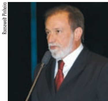
ALTERAÇÃO Para Osmar Dias, mudança no Estatuto da Terra vai beneficiar quem vive da agricultura

Com emenda do relator, senador Pedro Simon (PMDB-