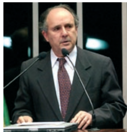
DÍVIDA Para Cristovam Buarque, ainda resta muito a fazer em benefício dos trabalhadores

– Os trabalhadores, no entanto, ainda convivem com o desemprego e com o subemprego; com o nível de renda decrescente e com a informalidade, que não pára de crescer – lamentou.