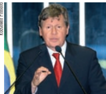
TRANSPARÊNCIA Virgílio propõe a divulgação do percentual de tributos no preço das mercadorias

Para Virgílio, as dificuldades de implantação de normas como essas, pela “complexidade do próprio sistema tributário”, não deve desestimular a adoção de mecanismo que garanta e amplie o direito à informação.