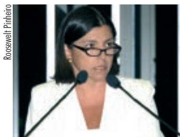
DIREITO Projeto de Roseana estende ao empregado doméstico benefício garantido aos demais trabalhadores

Para os que possuem remuneração superior a esse valor e recebam até R$ 586,19, a ajuda é de R$ 14,09. O salário-família, instituído em 1963, é pago sob a forma de uma cota percentual, calculada sobre o valor do salário mínimo local.