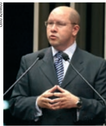
SUSTENTABILIDADE Demostenes também defende preferência a empresa que preserve o ambiente

A Lei de Licitações, de 1993, estabelece atualmente três critérios para preferência em caso de empate: bens ou serviços produzidos ou prestados por empresas brasileiras de capital