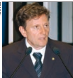
Segundo Marcelo Crivella, mais de 20 milhões de brasileiros estão fora do mercado de trabalho