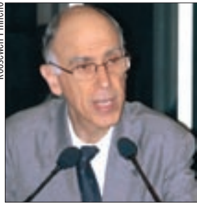
Refinaria no Nordeste reduzirá dependência da energia do Sul do país, afirma Marco Maciel