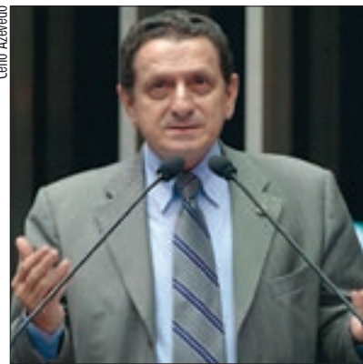
Projeto substitutivo de Mozarildo Cavalcanti entra pela terceira vez na pauta da CCJ

Na mesma reunião, marcada para as 9h30, a CCJ terá outras 11 proposições em exame. Entre elas, projeto de Antonio Carlos Magalhães (PFL-BA) que determina que os acusados de envolvimento no crime organizado