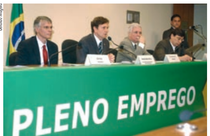
Entre economistas, Marcelo Crivella preside reunião da frente parlamentar