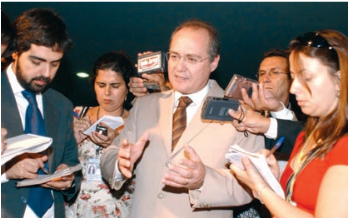
Renan Calheiros (C) afirma que coloca à disposição das CPIs todos os meios para que desempenhem seu trabalho de forma correta

Os presidentes e os relatores das CPIs dos Correios, do Mensalão e dos Bingos reúnem-se hoje, às 15h, com o presidente do Senado, Renan Calheiros. A busca de uma resposta mais rápida à demanda da sociedade pela punição dos envolvidos em corrupção é, segundo Renan, um dos objetivos da reunião. Os dirigentes das comissões e o presidente do Senado devem fazer uma avaliação dos trabalhos. "Nós havíamos acertado que, quando houvesse necessidade, faríamos reuniões para avaliar o andamento das investigações", afirmou Renan. Ele disse defender a idéia de prorrogar os prazos das CPIs, desde que seja uma decisão apoiada na necessidade de esclarecer e punir. O presidente do Senado voltou a defender a realização da reforma política. Página 3