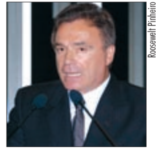
Alvaro Dias avalia que aumentar segurança jurídica pode melhorar competitividade do Brasil

– Ele não quer socorro médico nem remédio. Só uma coisa o fará cessar a greve de fome: a revogação do projeto de transposição e a reabertura da discussão sobre as prioridades do destino das águas do São Francisco. Se, depois da discussão, concluir-se que a transposição é viável, ele a aceitará, mas quer que antes seja feita a revitalização do rio e que sejam retomadas as centenas de obras paralisadas à sua margem – acrescentou o senador Teotonio Vilela.