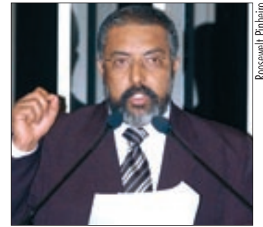
Paim condena ação da Brigada Militar que resultou na morte de um sindicalista

A Comissão de Meio Ambiente, Defesa do Consumidor e Fiscalização e Controle (CMA) se reúne às 9h30 para analisar avisos do TCU sobre auditorias e projetos. Entre eles, há o que exige substituição, em dois dias, de produto adquirido com defeito e fixa o prazo para a reparação.