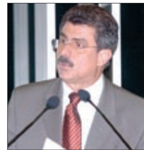
Jucá negocia mudanças no texto para atender a reivindicação de estados e municípios

Para o senador Delcídio Amaral, "a cada dia que passa e a cada documento analisado comprova-se que a teoria dos empréstimos não se sustenta".