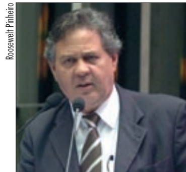
Requerimento de Antero Paes de Barros solicita informações a todos os ministros

O senador destacou que quem liderou a ação para a retirada das assinaturas foi o próprio presi-