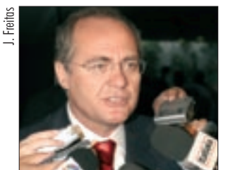
Renan Calheiros recebe a Medalha do Mérito da República

Teotônio Vilela Filho, além do presidente da Câmara dos Deputados, Aldo Rebelo. A solenidade marcou o 116º aniversário da Proclamação da República.