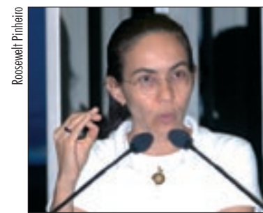
Governo não liberou recursos para compra de material didático, denuncia Heloísa

Arthur Virgílio comentou ainda reportagem do jornal O Globo , na qual a Transparência Internacional classifica Angola, entre 159 países, como o oitavo país mais corrupto do mundo.