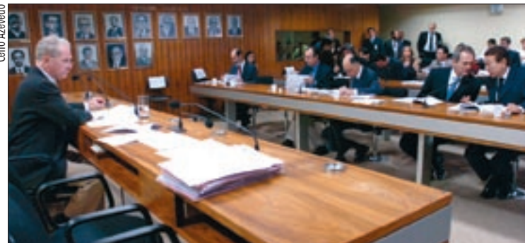
Comissão de Educação também examina projeto que muda processo de escolha de reitor