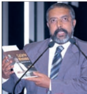
Estatuto representa a verdadeira carta de alforria que não veio em 1888, diz Paim

– O Estatuto da Igualdade Racial representa a verdadeira carta de alforria que não veio em 1888 – afirmou Paim, observando que a