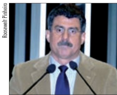
Jucá propõe reajuste da demarcação da Floresta Nacional de Roraima