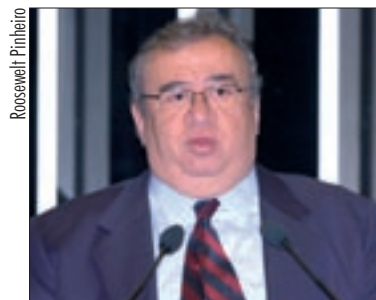
"Essa briga para abrir o cofre do Palocci me deixa intrigado", observa Heráclito

– A aprovação de um projeto de lei dará tranquilidade às 400 famílias nesses dois assentamentos, permitindo que a região possa ser apoiada e melhorada.