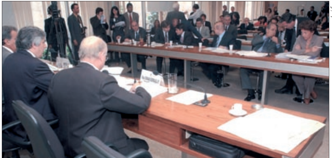
Além de Carla Cico, Comissão de Inquérito dos Correios toma depoimento de ex-secretária de Delúbio e de empregada da SMP&B

Paulo Okamoto, que teria pago empréstimo de R$ 30 mil contraído pelo presidente Lula junto ao PT, presta depoimento hoje na CPI dos Bingos