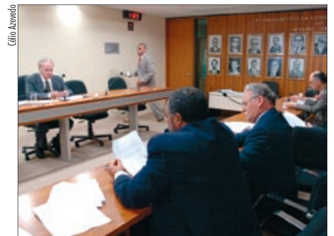
Projeto que obriga TV pública a veicular imagens de desaparecidos está entre as 33 propostas na pauta da Comissão de Educação. Página 3

CPI dos Bingos ouviu, em São Paulo, presidiários acusados de envolvimento no caso Celso Daniel. Depoimentos foram colhidos por Eduardo Suplicy. Página 3