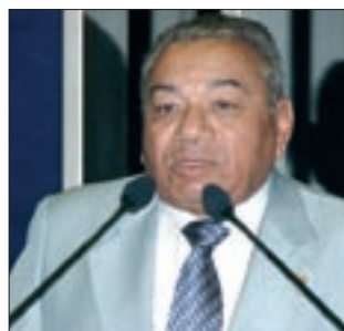
Jonas ressalta a experiência e dedicação do ministro das Cidades

Na ocasião, segundo o senador, Márcio Fortes desenvolveu um notável trabalho de reformulação daquele ministério ao imprimir à pasta dinamismo que acabou refletindo positivamente na agropecuária brasileira.