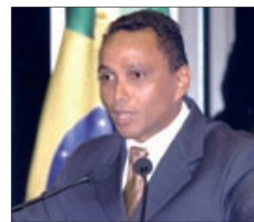
Sibá salienta importância da ligação internacional para a economia do país

Sibá também cumprimentou a Justiça do Pará pela agilidade