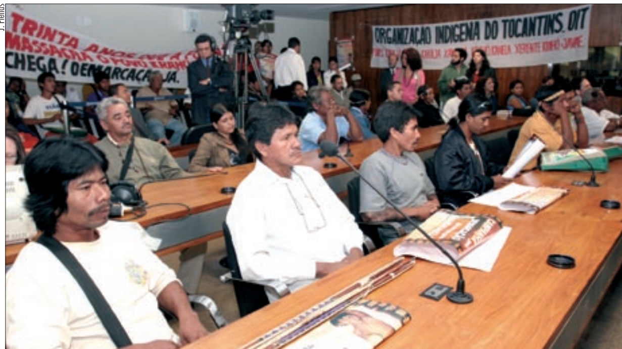
Presentes à audiência na Comissão de Direitos Humanos, índios reivindicam demarcação de terras no município de Lagoa da Confusão (TO)

No caso do Ministério da Saúde, Cristovam ressaltou que é preciso saber se o projeto foi autorizado pela Comissão Nacional de Ética em Pesquisa (Conep) daquele órgão. Ele disse ainda que é preciso saber se estão ocorrendo casos como esse em outros estados do país.