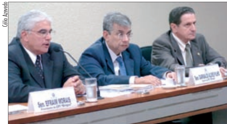
Membros da comissão não acreditam que o ministro compareça espontaneamente

O líder do PFL, senador José Agripino (RN), afirmou ontem em entrevista que acredita na aprovação do requerimento pela comissão, chegando a arriscar um prognóstico: oito votos a favor da convocação e sete con-