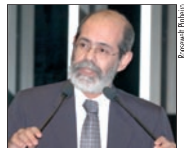
Mesquita Júnior também critica sistema tarifário anunciado pela Anatel

– Como não há limites para o emprego da calúnia, da difamação e de injúrias, peço que estejam prevenidos, pois não sei em que medida o recesso parlamentar vai servir para impedir-me de qualquer reação – assinalou.