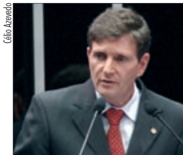
Proposta de Crivella altera o Estatuto da Criança para facilitar a adoção

Em sua justificativa, Crivella diz que “a medida prestigia a dinâmica do processo, pois dá ao juiz a oportunidade de avaliar semblantes e comportamentos de todos os interessados, em audiência, sob o crivo do Ministério