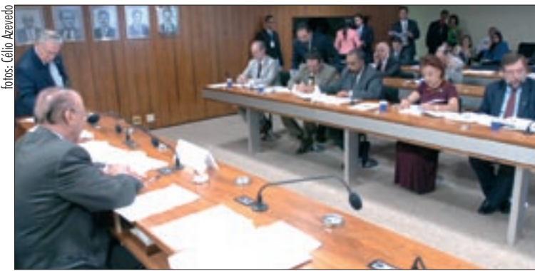
fotos: Célio Azevedo Maior estímulo ao uso de genéricos será discutido pela Comissão de Assuntos Sociais