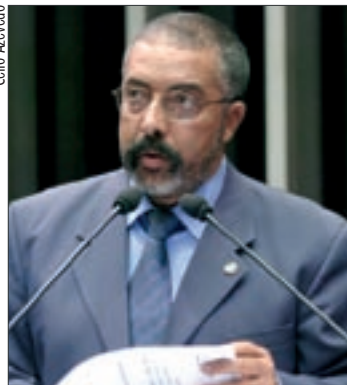
Paim ressalta garantias do estatuto, como os exames de prevenção do câncer

O Estatuto da Mulher estabelece, entre outras medidas, que o Sistema Único de Saúde (SUS) garanta periodicamente exames de prevenção do câncer de mama, do colo e de útero, da hipertensão e programas de acompanhamento de pré-natal e perinatal, além da distribuição de medicamentos e dispositivos contraceptivos. Também institui atendimento prioritário à mulher chefe de família, à mãe solteira, à mulher soropositiva, às portadoras de necessidades especiais e àquelas que comprovarem inca-