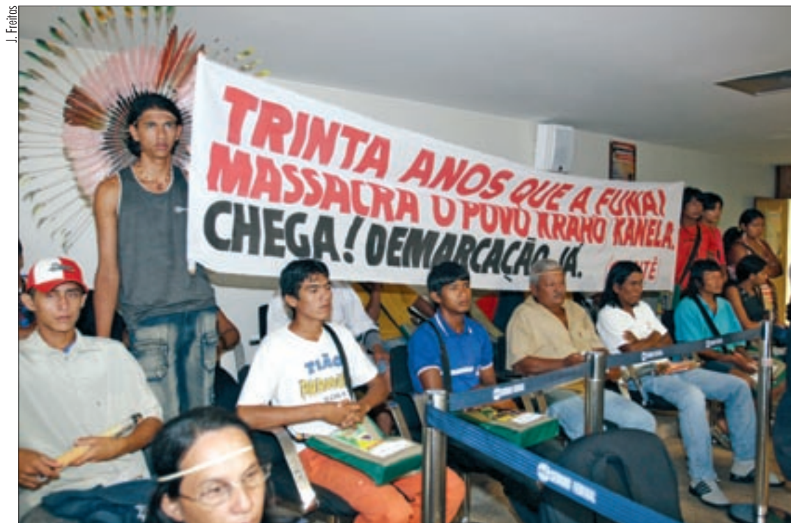
Na Comissão de Direitos Humanos e Legislação Participativa, os krahôs/kanelas cobram a demarcação de suas terras

Uma profunda reforma no sistema político, que fortaleça os partidos e permita um processo eleitoral mais ético e transparente, foi defendida ontem pelo presidente do Senado Federal, Renan Calheiros. Segundo ele, a fragilidade dos partidos e a contaminação das campanhas eleitorais pelo abuso do poder econômico ameaçam a democracia. Renan condenou a verticalização das coligações partidárias. Página 5