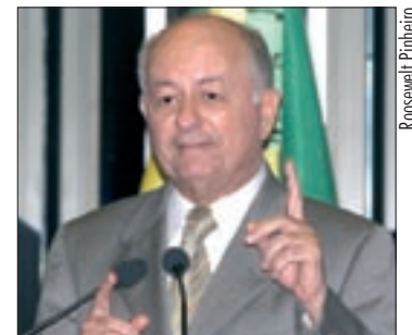
Para José Jorge, aliados do governo e integrantes do PT produziram a crise

José Jorge lembrou que a crise política foi gerada por aliados e integrantes do PT, como Roberto Jefferson, Delúbio Soares e José Dirceu. Ele ressaltou que a oposição nem sequer teve tempo para exercer o seu papel de crítica do governo e que, se não fosse democrática e cautelosa, o governo Lula já estaria enfrentando um processo de impeachment .