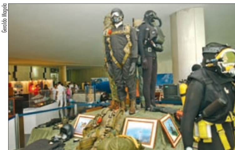
Fotos, maquetes e vídeos mostram os diversos programas da Marinha brasileira

Em reunião administrativa hoje, a partir de 10h30, a CPI dos Bingos deve votar vários requerimentos, entre eles o que convoca o ministro da Fazenda, Antonio Palocci. O sub-relator de Fundos de Pensão da CPI dos Correios, deputado Antonio Carlos Magalhães Neto, anunciou ontem que a comissão suspeita do envolvimento de 200 instituições financeiras internacionais nas operações com os fundos investigados. Página 4