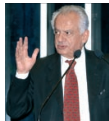
Simon avalia que soaria mal perante a opinião pública a interrupção das CPIs

– No México, onde o financiamento é público, há o caixa dois. O financiamento público pode reduzir, mas não elimina o problema – observou.