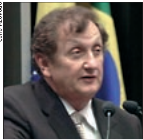
Para Mão Santa, Ministério da Pesca deve prorrogar prazo final de recadastramento