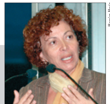
Ideli destaca o consenso que permitiu a aprovação da proposta