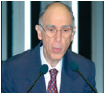
Para Maciel, base mais profunda do êxito no desenvolvimento está na educação