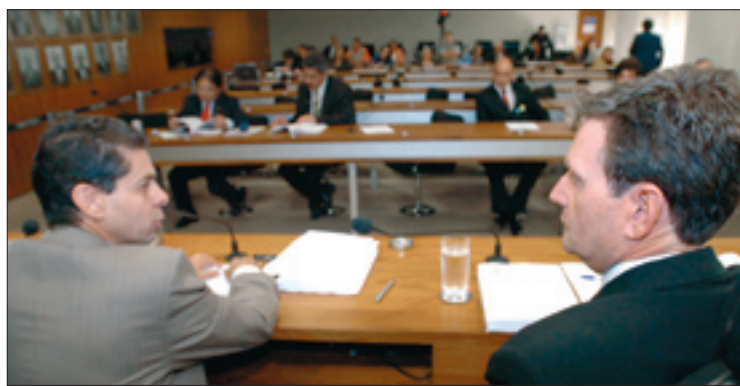
Documento propõe a criminalização do tráfico internacional de pessoas para emigração