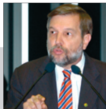
Arns acredita em revolução a favor do país com o início do Fundeb