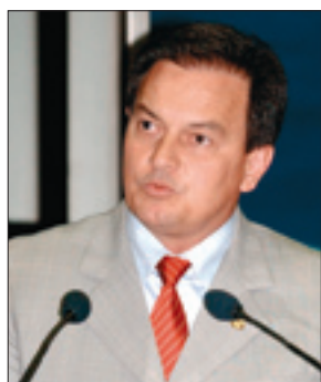
Aelton: projeto irá incluir jovens no mercado de trabalho formal