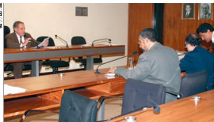
Comissão de Direitos Humanos ouve ministro da Previdência e sindicalistas

A proposição já foi aprovada pela Comissão de Assuntos Sociais (CAS), mas houve apre-