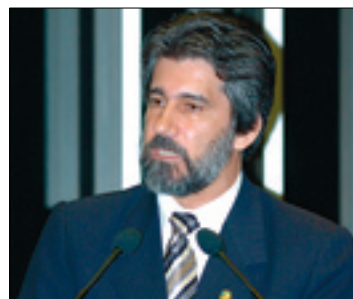
Medida beneficiará 16,6 milhões de deficientes visuais, informa Raupp

acesso ao meio em que vivem, os portadores de deficiência tornam-se capazes de trabalhar, circular e exercer seus direitos e deveres – observou.