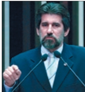
Raupp está preocupado com a situação dos estados e municípios

Raupp afirmou que conversou com governadores e prefeitos e que o governador de São Paulo, José Serra (PSDB), relatou a