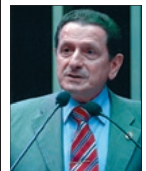
Mozarildo: proposta é antídoto para problemas do setor aéreo

– Isso acaba sobrecarregando esses aeroportos – observou o senador.