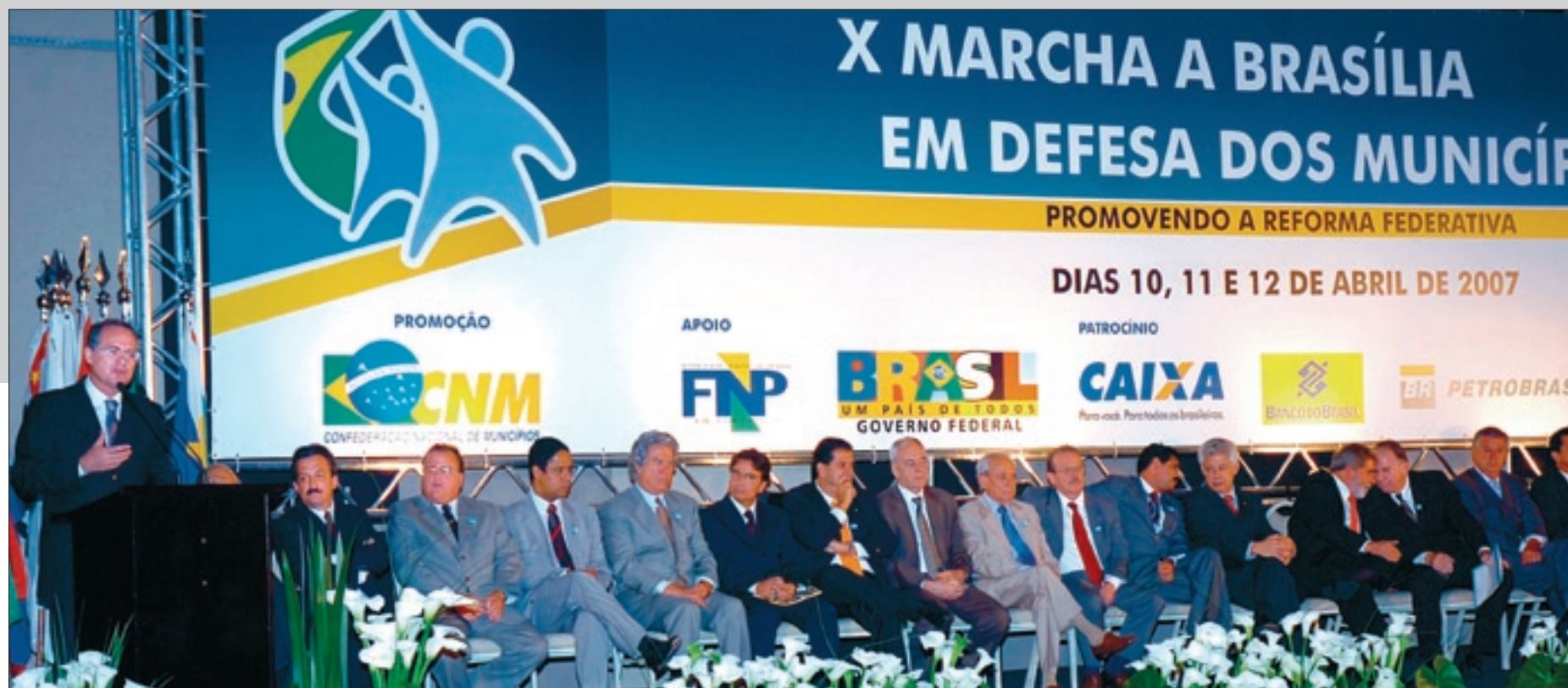
Renan Calheiros (E) discursa na abertura da marcha dos prefeitos; mesa dos trabalhos foi composta pelo presidente Lula, ministros de Estado, parlamentares e representantes dos municípios de todo o país

Cerca de 3 mil prefeitos e centenas de vereadores reunidos em Brasília receberam ontem apoio de senadores de diferentes partidos a suas reivindicações. Na mesma solenidade em que o presidente Lula anunciou providências para o aumento de um ponto percentual do Fundo de Participação dos Municípios, o presidente do Senado, Renan Calheiros, reconheceu a enorme injustiça que as prefeituras enfrentam na distribuição dos recursos públicos. Páginas 2 a 4