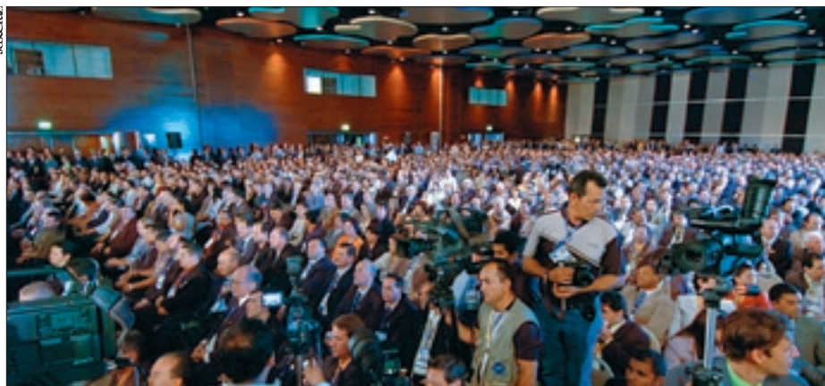
Prefeitos e centenas de vereadores participam da abertura da 10ª Marcha a Brasília em Defesa dos Municípios

De acordo com a Confederação Nacional dos Municípios, organizadora da marcha, participam da manifestação cerca de 3 mil prefeitos e centenas de vereadores, que estarão presentes ao II Fórum Nacional de Vereadores, evento paralelo à marcha, programado para hoje.