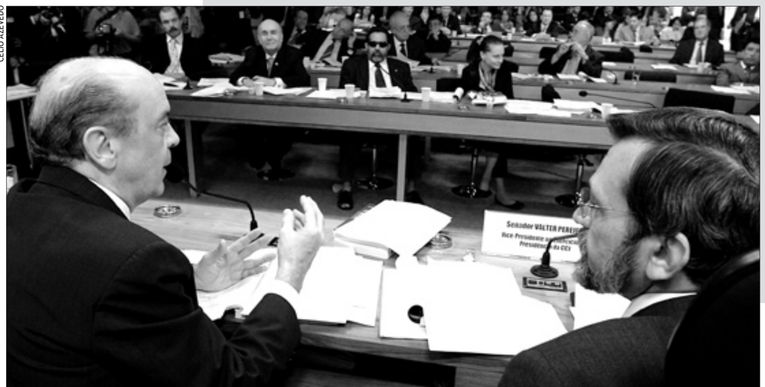
José Serra (E) acompanhou parte da reunião da CCJ destinada a votar o pacote antiviolação e defendeu monitoramento de presos

O relatório do senador Flexa Ribeiro (PSDB-PA) prevê que a instalação dos bloqueadores – ao custo de R$ 300 mil para cada um dos mil presídios do país – seja custeada pelo Fundo de Fiscalização das Telecomunicações (Fistel).