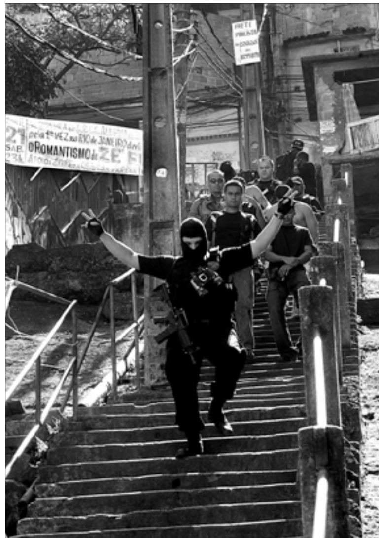
Polícia carioca efetua prisões no Morro da Mineira, no Rio de Janeiro, depois de sangrentos enfrentamentos entre traficantes

Atualmente, a lavagem de dinheiro só ocorre se associada aos seguintes crimes: tráfico de drogas ou armas; terrorismo; seqüestro; crimes contra a administração pública e contra o sistema financeiro nacional; os praticados por organização criminosa; e ainda os praticados contra administração pública estrangeira.