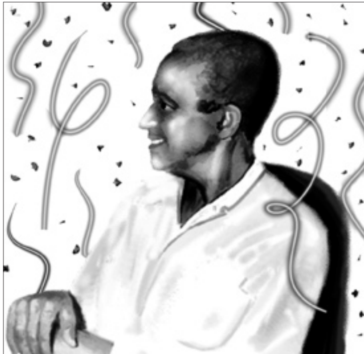
ARTE: CIRILO QUARTIM

Já no programa Música do Brasil, que será apresentado no sábado, dia 28, às 16h (reprise no domingo, às 11h), o destaque será o sambista carioca Ismael Silva, um dos principais nomes da música popular brasileira, cujas composições ficaram famosas nas vozes de Francisco Alves e Mário Reis, principais cantores da época. Constanam da programação as canções Antonico, Não há, Meu único desejo, Receio, Me faz carinhos, Amor de malandro, Arrependido, Quem não quer sou eu, Para me livrar do mal e Nem é bom falar, entre outras.