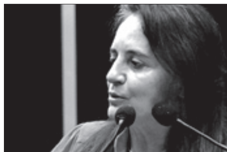
Serys garante empenho na busca por novos investimentos para capital de MT

– É uma situação que reclama por respostas imediatas e concretas. Assumo aqui o