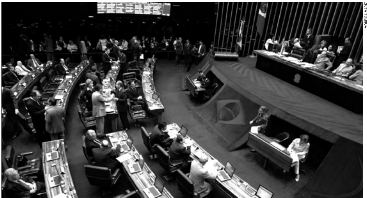
Senado aprovou projeto na terça-feira e, dois dias depois, a Câmara votou o texto, que agora só depende do presidente para virar lei

O líder do Democratas, José Agripino (RN), se disse incomodado com a aplicação do dinheiro no país vizinho, mas reconheceu a necessidade de ajudar os brasileiros residentes próximos da fronteira. Por isso, liberou a bancada para votar como desejasse.