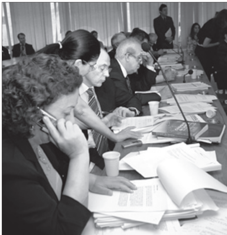
Senadores que integram a Comissão de Justiça examinam pacote de projetos que objetivam a redução da criminalidade no país

De todas as medidas, a única que não está acessível a uma mudança legislativa no momento é a da prisão perpétua (veja texto abaixo).