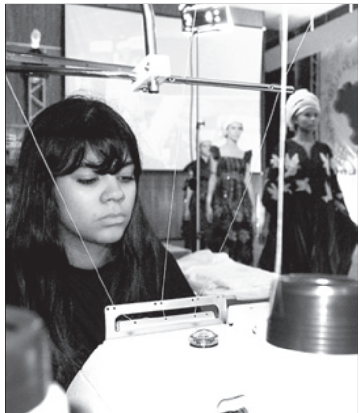
Do total de 1,65 milhão de empregos gerados pelas empresas têxteis e de confecção, 75% são ocupados por mulheres

Carga tributária chegaria a 54,4% do faturamento do setor