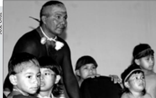
Mais de mil lideranças de 98 povos discutem, no Congresso Nacional, os direitos indígenas durante evento em comemoração ao Dia do Índio