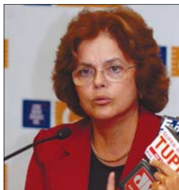
Dilma poderá ser questionada sobre elaboração de dossiê contra FHC

O requerimento de convocação de Dilma Rousseff, de autoria de Flexa Ribeiro (PSDB-PA), foi aprovado na comissão no dia 3 de abril, em um momento em que não havia nenhum senador da base do governo na reunião. Logo