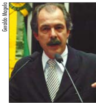
Senador quer apoio do Senado a resolução da OEA que pede diálogo