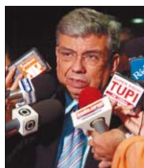
Presidente do Senado vê líderes dispostos a desobstruírem a pauta

O presidente do Senado propôs aos líderes que fizessem uma lista dos projetos prioritários entre os mais de 70 à