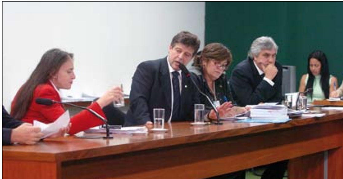
CMO ainda discute os critérios para liberação de recursos do PAC caso o Orçamento de 2009 não seja aprovado este ano

Há ainda a proposta de emenda à Constituição (PEC) que dispõe sobre aplicação de recursos para irrigação, quatro PECs que acabam com o voto secreto no Congresso e seis PECs que reduzem a idade para imputabilidade penal.