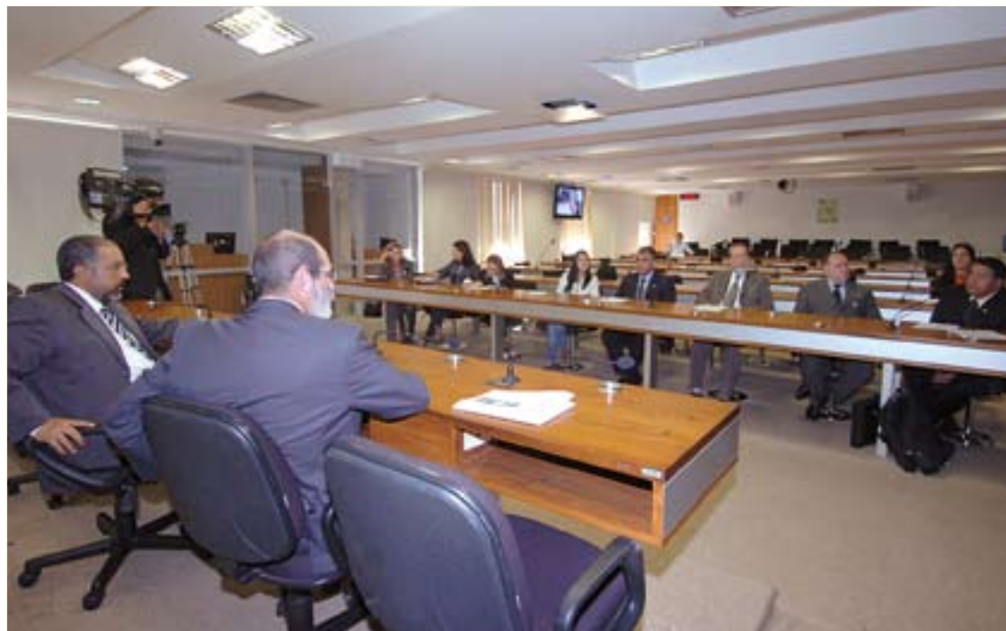
Reunião da CDH discute amanhã o trabalho infantil na produção de fumo no Paraná, que seria "semelhante à escravidão"

Em audiência pública realizada pela CDH na última quinta-feira, representantes dos caminhoneiros denunciaram que são submetidos a trabalho escravo e pediram a regulamentação da profissão.