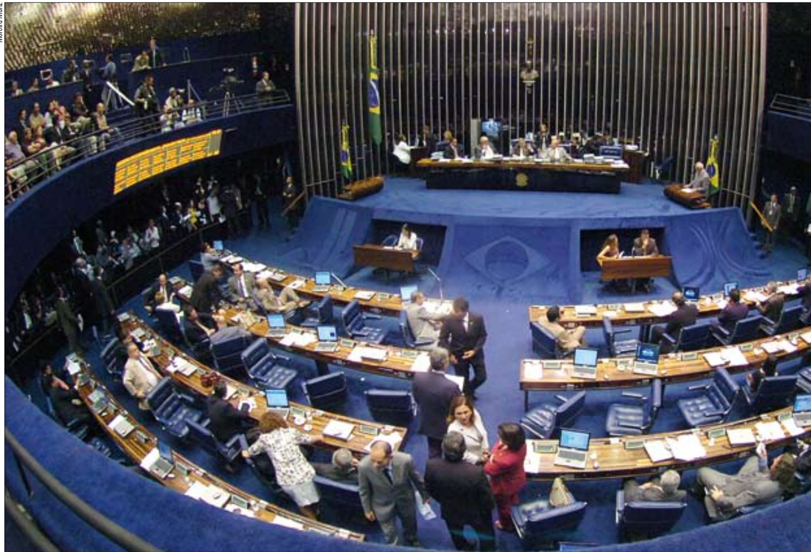
Pauta do Plenário tem 87 itens. Caberá aos líderes partidários, segundo Garibaldi Alves, decidir quais matérias serão levadas a voto até o dia 17, último dia de trabalho da atual sessão

Um dos itens que podem ser incluídos na ordem do dia é o requerimento em que Alvaro Dias (PSDB-PR) solicita auditoria do Tribunal de Contas da União (TCU) sobre os empréstimos concedidos a outros países pelo Banco Nacio-