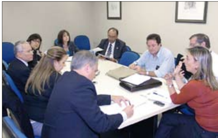
Membros da Comissão do Ano Cultural definem agenda para agosto e setembro