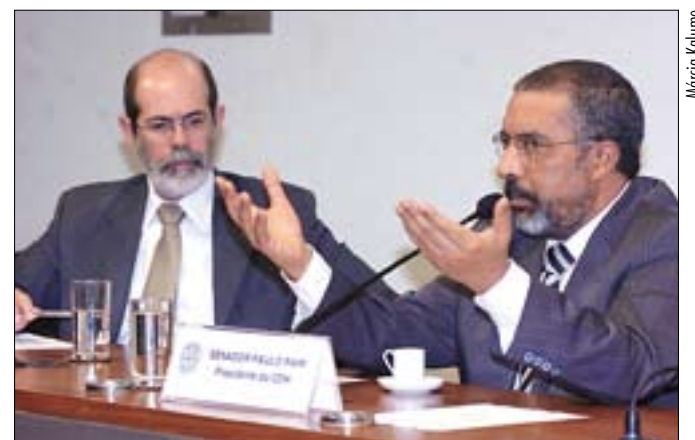
Representantes do governo e dos motoristas buscam formas de melhorar condições de trabalho da categoria; senador Mesquita Júnior (à esq., na foto menor) ouve Paulo Paim, presidente da CDH