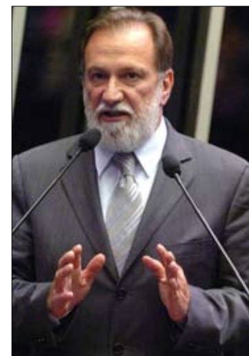
Osmar Dias relatou o projeto na Comissão de Constituição e Justiça

A proposta não altera, no entanto, os procedimentos e prazos para interposição de recursos a multas que não sejam consideradas justas, tampouco para a apreciação desses recursos pelas juntas administrativas de recursos de infrações (Jari) – órgãos colegiados componentes do Sistema Nacional de Trânsito, responsáveis pelo julgamento dos recursos.