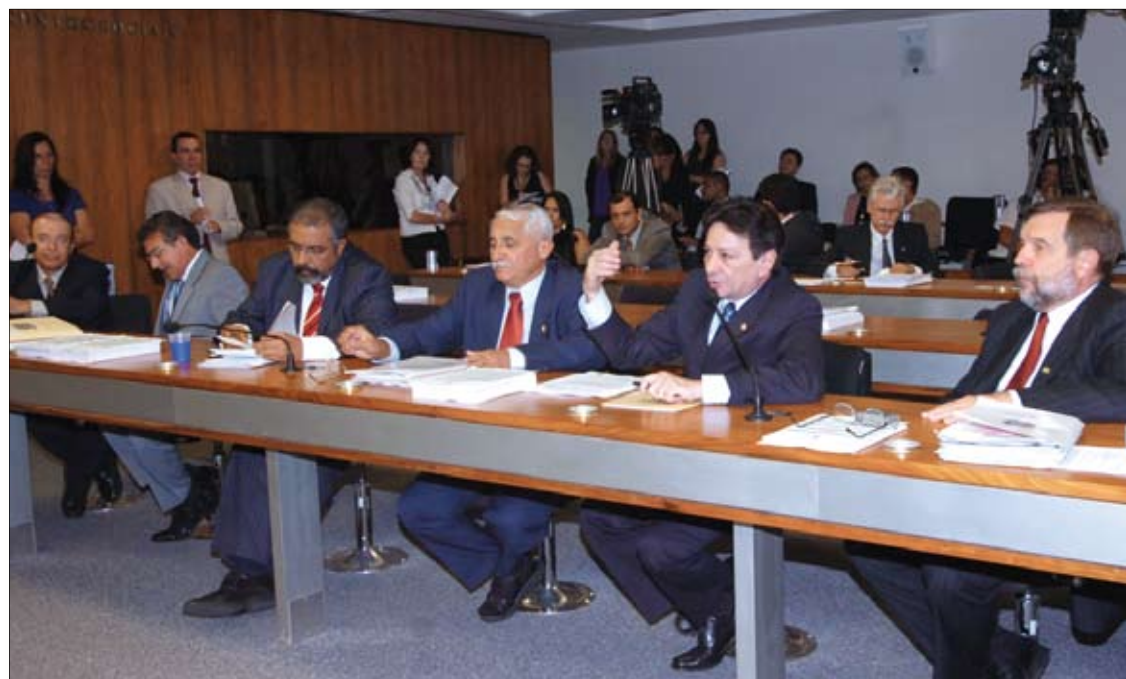
Aguarda votação na Comissão de Assuntos Sociais projeto que estabelece 30 horas semanais de trabalho para categoria

vital, dentro do entendimento de que o planejamento familiar é direito de todo cidadão – é uma forma de garantir o acesso da população ao conhecimento desenvolvido pela ciência. A senadora lembra que o diagnóstico precoce é exatamente uma das maiores promessas da medicina genômica.