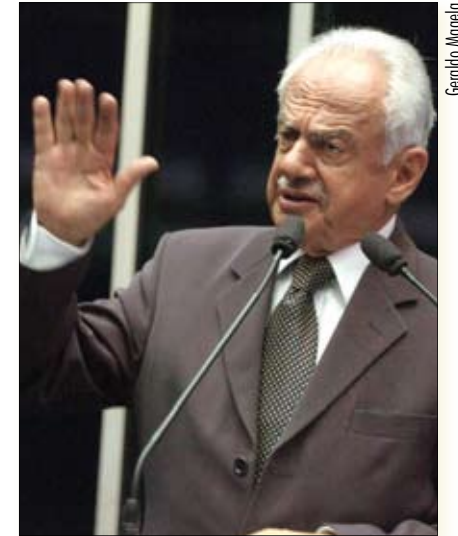
Simon propõe restrição à liberdade provisória em caso de crime contra a economia popular

O valor da fiança deverá ser fixado pelo juiz nos limites de mil a 10 mil vezes o valor do salário mínimo de referência vigente na data do crime. Para Osmar Dias, a legislação atual sobre crimes de lavagem de dinheiro não é eficaz. Mas se o projeto se tornar lei, a pessoa presa em flagrante pelo crime de lavagem de dinheiro será obrigada a prestar fiança,