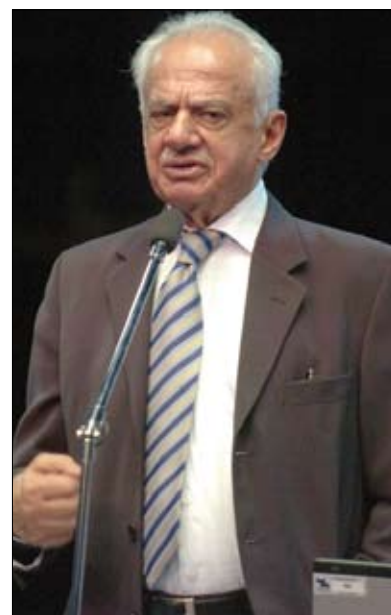
Iniciativa de Simon facilita apreensão de bens de procedência ilegítima

As medidas cautelares para sequestro de bens de origem ilícita se tornarão mais eficazes se transformado em lei projeto que deverá ser votado em fevereiro pelo Plenário. A proposta, do senador Pedro Simon, estabelece que, para a autoridade decretar o sequestro de um bem, bastará a constatação de indícios veementes da sua procedência ilegítima. O projeto extingue o direito a liberdade provisória, no caso de prisão em flagrante pela prática de crime de lavagem de dinheiro ou ocultação de bens. Outra iniciativa de Simon, que se encontra na Comissão de Relações Exteriores, substitui a chamada carta rogatória – solicitação de um juiz de um país ao de outro – por procedimentos mais ágeis de combate à criminalidade, embutidos em normas de cooperação jurídica. 3