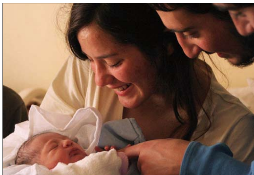
Projeto estabelece oferta de dados, dentro do planejamento familiar, sobre doenças geneticamente determinadas