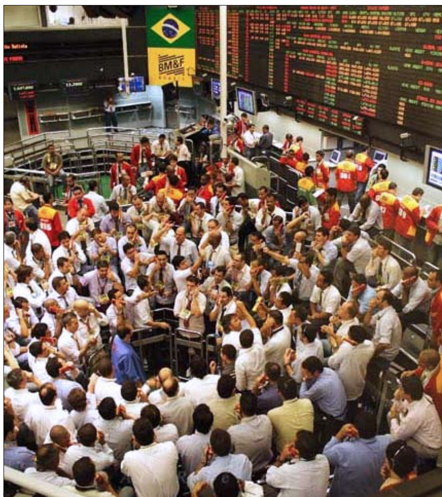
Proposta visa aperfeiçoar o mercado acionário com a ampliação dos direitos dos investidores

que tramita na Comissão de Justiça. O projeto objetiva o aperfeiçoamento do mercado acionário, com regras que assegurem mais transparência e controle na gestão das empresas. 3