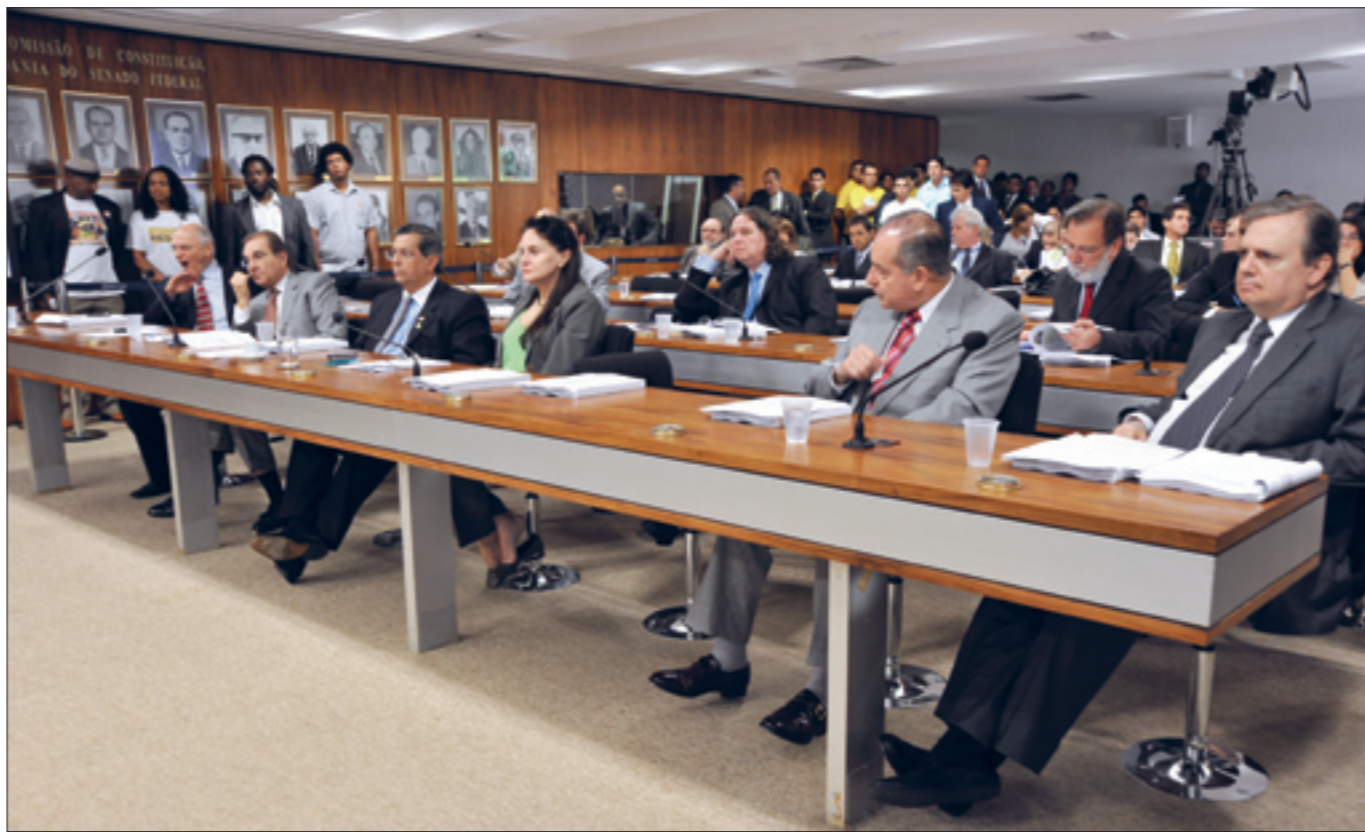
CCJ tem em pauta alteração feita pela Câmara em projeto do Senado que agrava pena para crime cometido contra policial, procurador ou magistrado

Depois da CCJ, a matéria será ainda apreciada em Plenário. Os trabalhos da comissão ocorrem normalmente às quartas-feiras, mas como a última reunião, realizada dia 1º, foi suspensa antes de concluídos os itens em pauta, o presidente da CCJ, senador Demostenes Torres (DEM-GO), decidiu dar continuidade hoje às votações pendentes e manteve a reunião ordinária para amanhã.