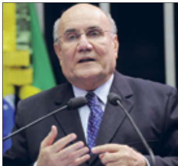
Senador critica atuação do Inbra na distribuição de terras no Pará