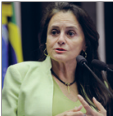
Serys sugere "remover gargalos" no diálogo do estado com a União

Na avaliação de Serys, isso ocorre porque falta articulação entre