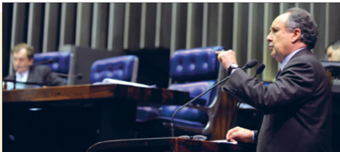
Cristovam (D) lembra que vários países instituíram a representação de seus trabalhadores que vivem no exterior

Cristovam Buarque contestou ontem críticas da imprensa à proposta, de sua autoria, que prevê a representação, na Câmara dos Deputados, dos brasileiros que vivem no exterior. O projeto foi aprovado pelos senadores em primeiro turno. O senador lembrou que "3,5 milhões de brasileiros trabalham duro em outros países e enviam ao Brasil 6 bilhões de dólares por ano". 8