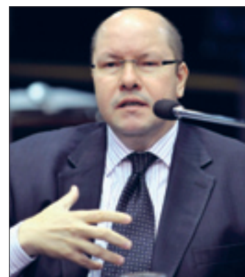
Demostenes diz que informações são essenciais a órgãos de investigação

Caso o projeto seja acolhido, deixam de ser sigilosos os dados cadastrais; os que informam em que instituições financeiras e agências a pessoa mantém contas, aplicações ou investimentos e os respectivos números; a capacidade – ou a falta dela –