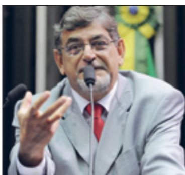
Couto afirma que "acabaram com a economia do Pará" e pede apoio a Lula

O senador lembrou que já havia denunciado a possibilidade de seu estado chegar a essa situação. Ressaltou que o Pará é o sexto maior exportador do Brasil