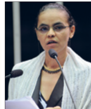
Marina: jovens farão caminhada hoje e entregarão carta a Lula

A Comissão de Meio Ambiente, Defesa do Consumidor e Fiscalização e Controle (CMA) reúne-se, às 11h30, para votar 11 itens. Entre os itens da pauta, o projeto que trata de medidas para a devolução de embalagens vazias de produtos de uso veterinário.