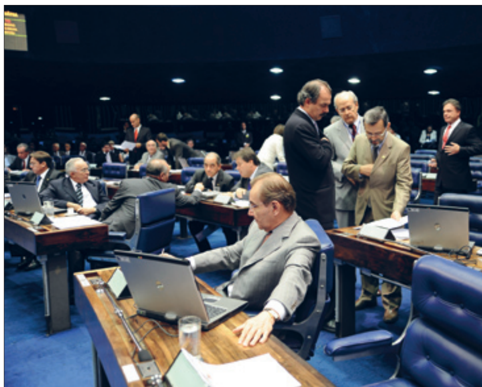
Pauta do Senado inclui propostas referentes a dados sigilosos e exigência de carta de fiança

Por sua vez, no parecer que apresentou à Comissão de Constituição e Justiça, favorável à matéria, o senador Demostenes Torres (DEM-GO) destaca afirmação de Gim Argello de que não estão mais presentes “as razões históricas fundamentadoras da necessidade de que a União organizasse e mantivesse a Defensoria Pública” da capital federal.