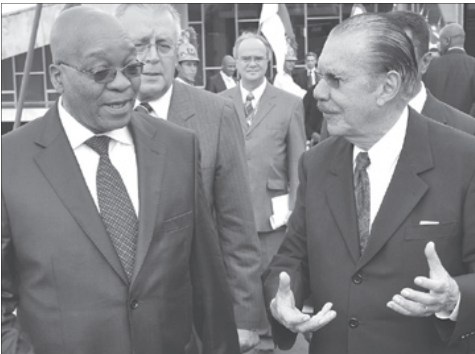
Sarney recebe Zuma (E), que veio ao Brasil para assinar acordos ampliando as relações bilaterais