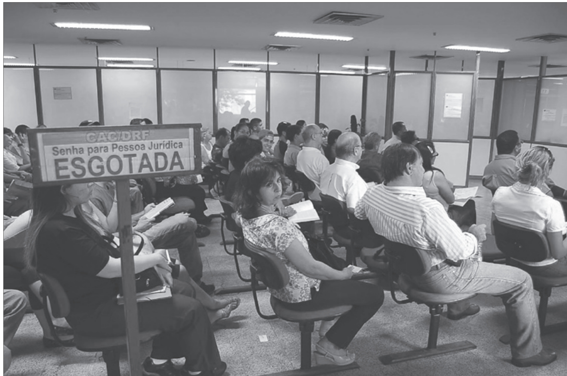
Atendimento a pessoa jurídica da Receita Federal em Brasília: proposta incorpora num único texto exigências como certidão negativa de tributos e da dívida ativa da União e de contribuições previdenciárias