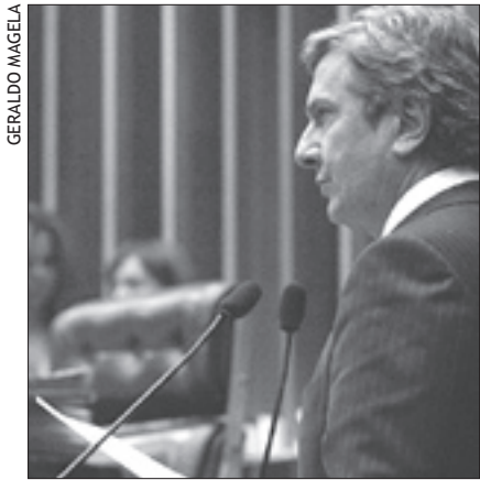
Texto relatado por Fernando Collor cria Estatuto da Igreja Católica no Brasil