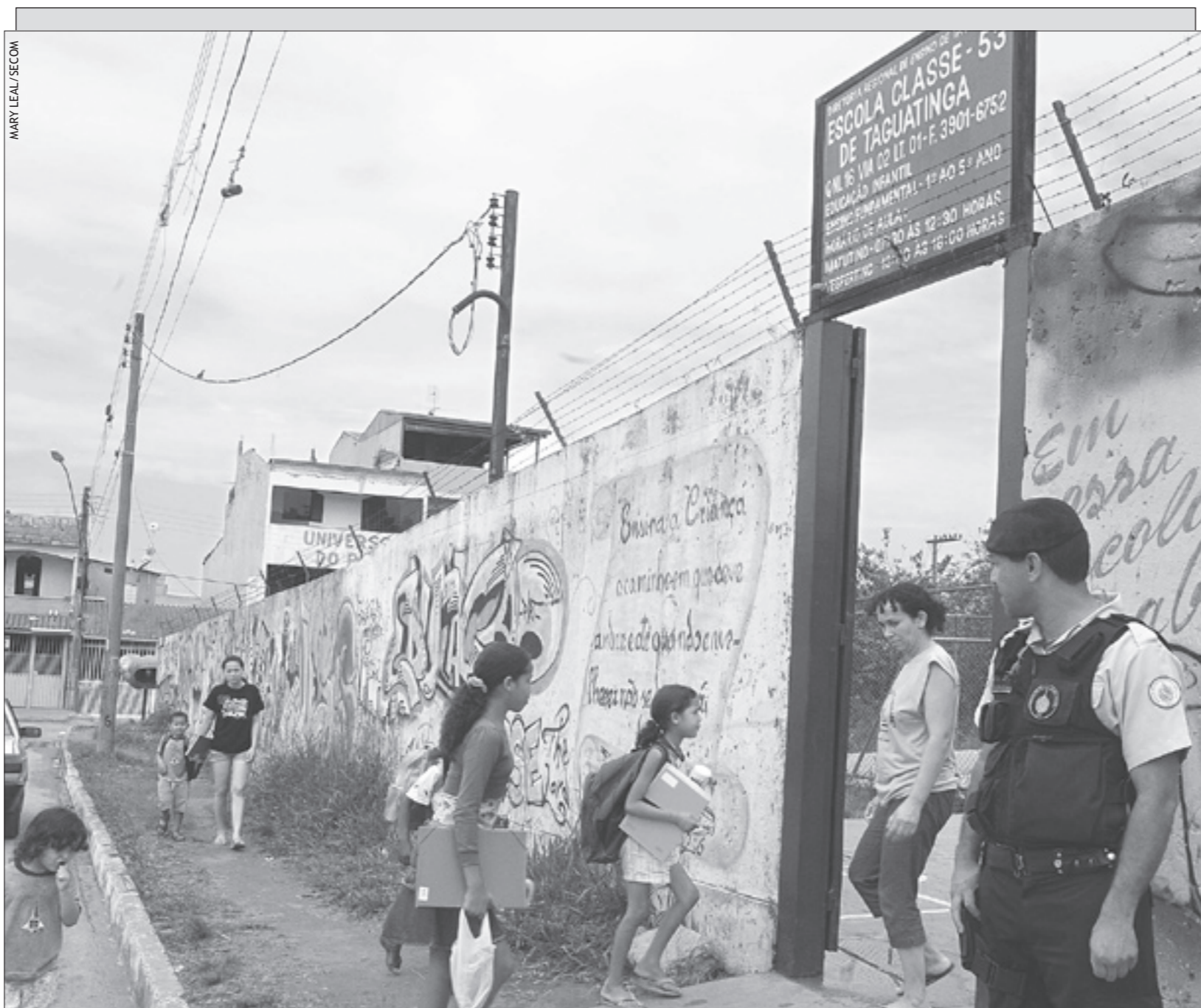
Alunos chegam a escola pública em Taguatinga, cidade do Distrito Federal. Mesmo tida como uma das melhores do país, a rede pública do DF não escapa à violência

Muitas escolas hoje se defendem da violência externa com muros e arame farpado, com guaritas e guardas até mesmo armados. Temos que construir pontes de relações pacíficas com a comunidade adjacente à escola, em primeiro lugar pela própria ação dos profissionais da educação – disse Suplicy, em seu relatório.