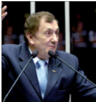
Mão Santa propõe homenagem do Senado a professora paranaense