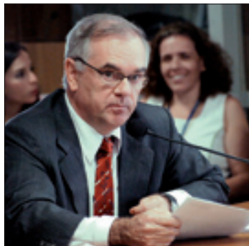
Goellner faz ressalva, mas aceita acordo que possibilitou aprovação

A oposição defendeu as exigências às empresas de