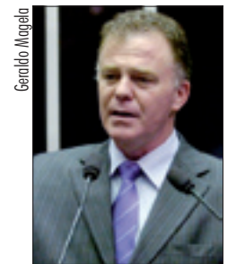
Casagrande aponta diferença de posições

Ele apontou a diferença entre o Brasil e outros países, como China, Rússia, Austrália e Estados Unidos, especialmente este último, onde, após um ano de administração, o presidente Barack Obama não conseguiu aprovar a sua lei de redução de emissões no Senado. – Os Estados Unidos não têm uma posição clara e acabaram se aliando a outros países que não têm posição e propõem que, na reunião da Dinamarca, só se fechem posições políticas e que o acordo liderado pela ONU seja consolidado no ano que vem, o que é um atraso.