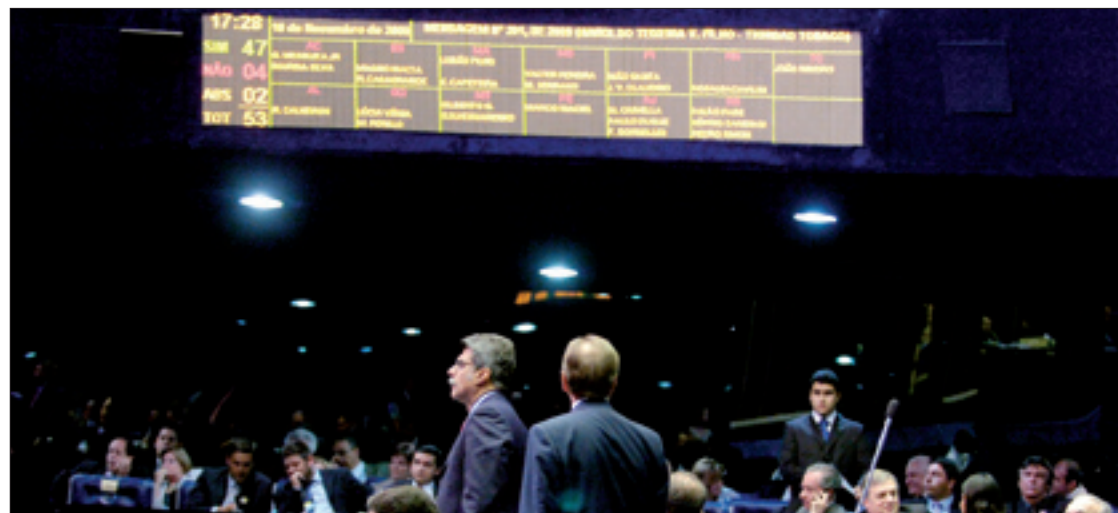
Senadores aprovam acordos internacionais e adiam votação sobre ingresso da Venezuela no Mercosul