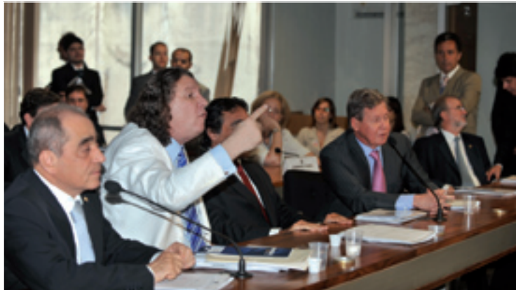
Cavalcanti (E), Wellington, Lobão Filho, Virgílio e Azeredo discutem vinda de ministros

PEDRO SIMON (PMDB-RS) homenageou ontem o centenário da Faculdade de Direito da Universidade de Caxias do Sul, onde foi o primeiro professor de Economia Política e de Sociologia, na Faculdade de Filosofia. Ele disse que foi o portador do documento oficial de autorização para a criação da universidade, assinado pelo então presidente da República, João Goulart. – Naqueles tempos, ainda numa idade em que a busca molda caminhos, a Universidade de Caxias do Sul me possibilitou juntar, em uma mesma travessia, a Economia, a Política, a Sociologia, a Filosofia e o Direito. Estão aqui, portanto, as bases da minha formação como ser social e político – assinalou.