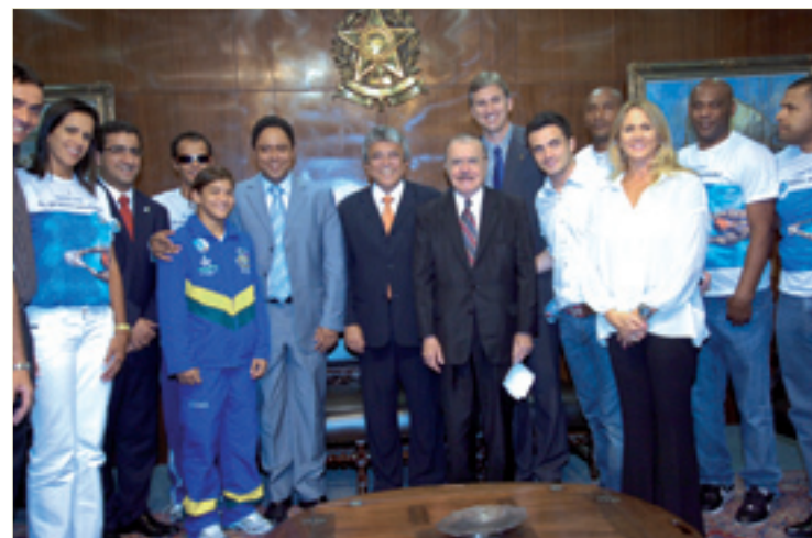
Sarney recebe o ministro do Esporte, Orlando Silva, e vários atletas

Em encontro na Comissão de Educação, Cultura e Esporte (CE) com dirigentes e atletas, senadores assumiram o compromisso de apoiar as demandas do esporte.