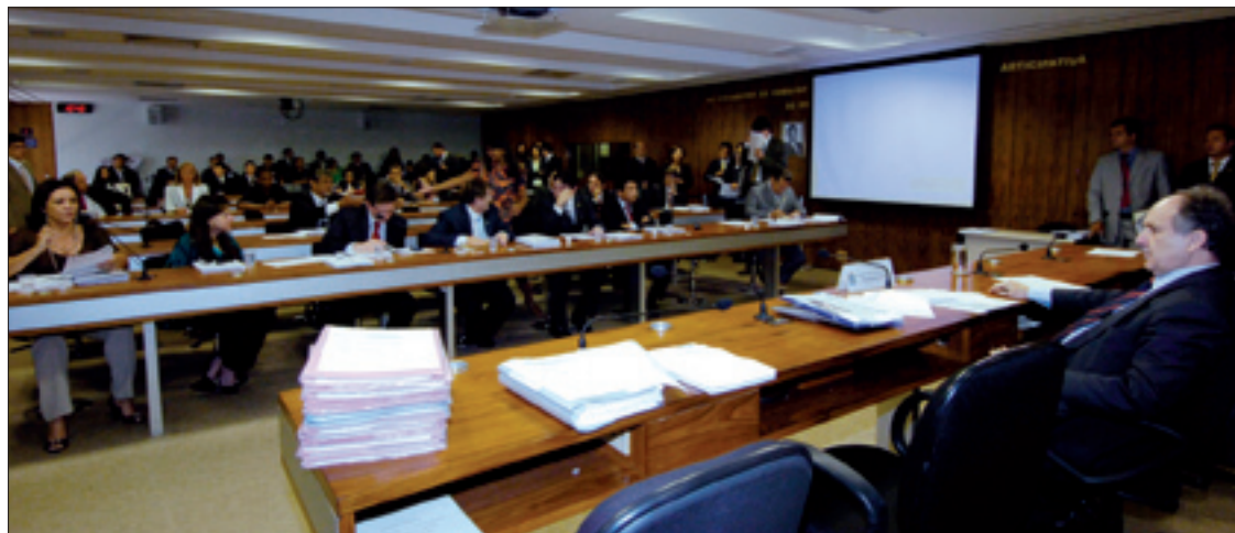
Cristovam preside reunião da Comissão de Direitos Humanos: recursos virão do Fundo Nacional de Segurança Pública

Como foi aprovada pela CDH em decisão terminativa, proposta seguirá logo para sanção presidencial se não for apresentado recurso para votação em Plenário