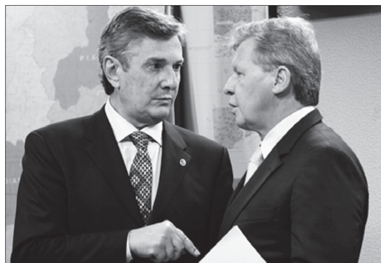
Collor (E), presidente da CI, pretende ouvir técnicos antes dos ministros. Virgílio acrescentou Fundação Cacique Cobra Coral entre as entidades convidadas