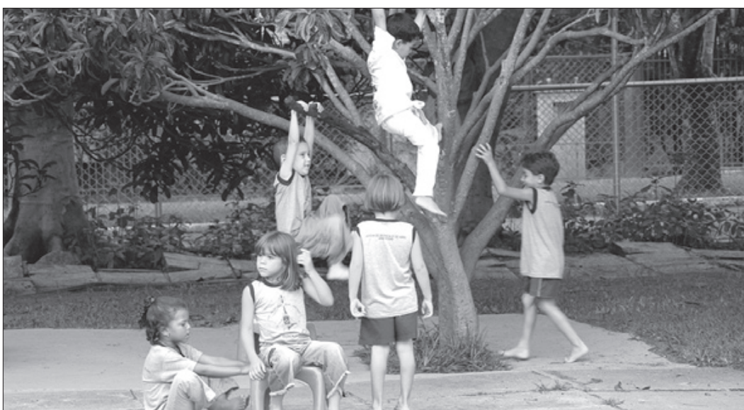
Crianças em escola de Brasília: caráter, personalidade e inteligência emocional se formam até os seis anos de idade

Senado FM 23/11, segunda-feira, às 7h30 Internet: 23/11, segunda-feira