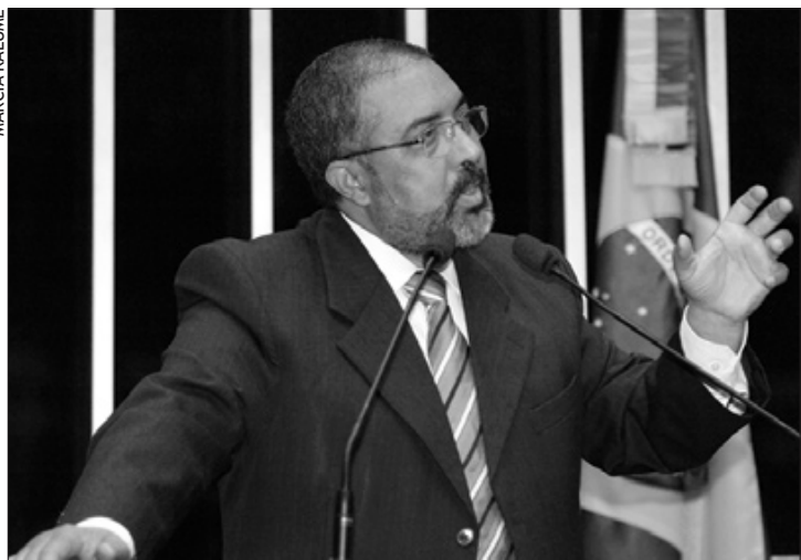
Paim cobra avanços maiores na área de segurança alimentar no Brasil, mas ressalta que o país exibe a mais baixa taxa de famintos na América Latina

Paim também apelou pela aprovação, até o final do ano, do Estatuto da Igualdade Racial.