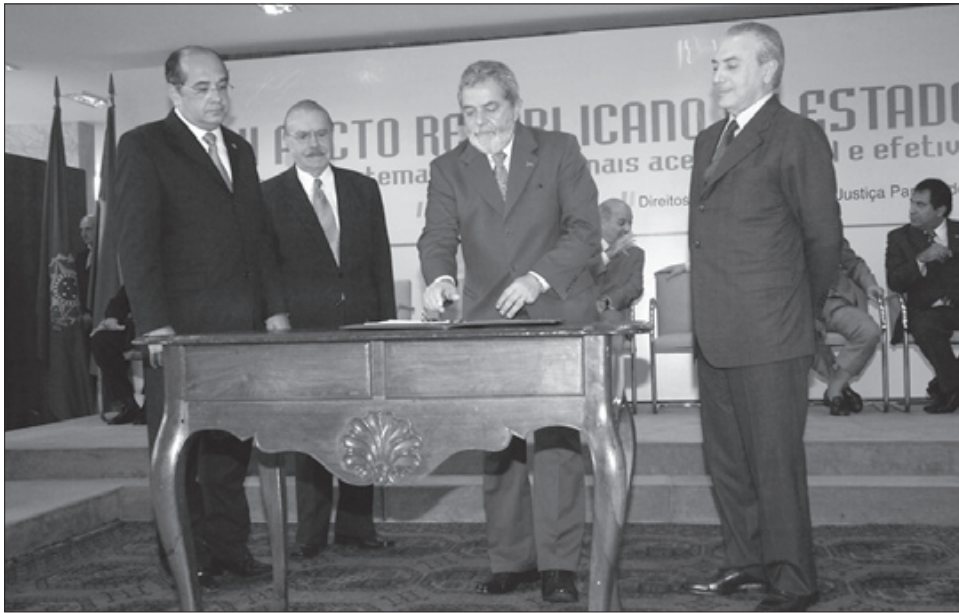
Após a promulgação da Emenda 45, foram firmados dois pactos entre os três Poderes para dar andamento às mudanças. O último, em abril, foi assinado por Gilmar Mendes (E), José Sarney, Lula e Michel Temer

Os méritos das questões são analisados posteriormente e, em alguns casos, como do nepotismo e do uso de algemas, as decisões levaram também à edição de súmulas vinculantes.