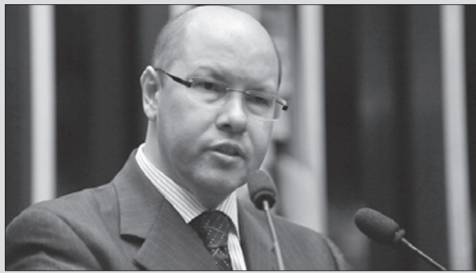
Presidente da CCJ, Demostenes acredita que a adoção de procedimentos eletrônicos também ajudará muito a tornar a Justiça mais ágil e eficaz

Jornal do Senado – Como o senhor avalia hoje a reforma constitucional do Judiciário de 2004?