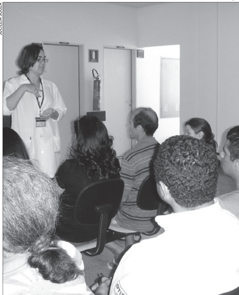
Os pacientes do Hospital Universitário de Brasília recebem informações antes do tratamento, contando com o apoio de psicólogos, nutricionistas e assistentes sociais