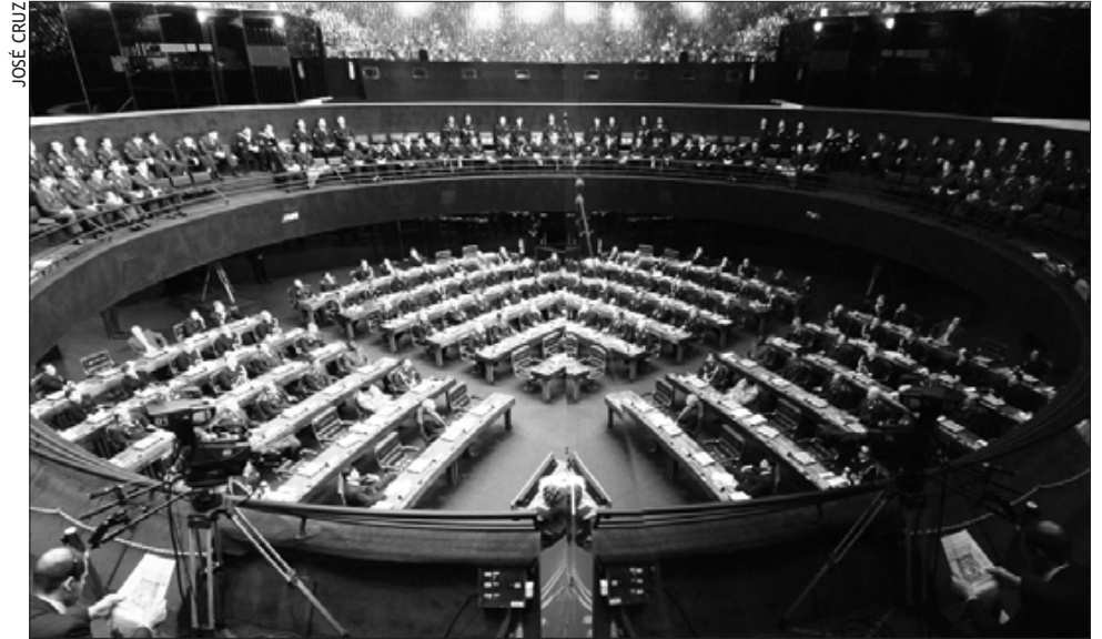
O governante iraniano visita o Congresso duas semanas após o presidente de Israel, Shimon Peres

A agenda do presidente do Senado prevê ainda a visita do presidente do Comitê Nacional da Conferência Consultiva Política do Povo Chinês, Jia Qinglin, na quinta-feira. Ele será recebido pela manhã, às 10h30, no Salão Nobre. O Comitê Nacional é um fórum de debates dos princípios do comunismo chinês e decide também a criação de novos organismos governamentais daquele país.