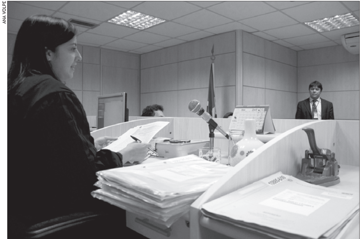
Juíza de primeira instância e sua pilha diária de processos: ação do CNJ tem ajudado a dar mais racionalidade ao Poder Judiciário

– O STF mais acertou que errou, não há dúvida. A súmula contra o nepotismo, para citar a mais evidente, é um grande acerto, enfrentando uma temática sobre a qual, infelizmente, o Congresso nunca teve condições de deliberar. Mas houve outras que, inclusive do ponto de vista dos pré-requisitos constitucionais, haveria alguma dúvida, como a que regulou o uso de algemas – afirma Dino.