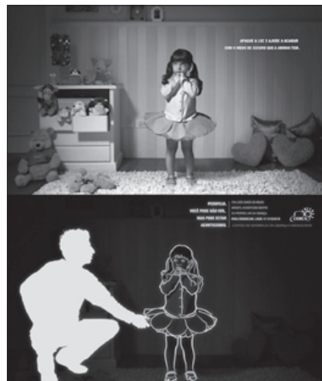
Cartaz da Campanha Nacional contra a Pedofilia estimula a vigilância e a denúncia de criminosos

Há países que adotam a castração genital de criminosos sexuais, como a República Tcheca, onde pelo menos uma centena de homens já foram submetidos a esse procedimento “irreversível e mutilador”. O governo tcheco assegura que as castrações tiveram consentimento por escrito dos condenados.