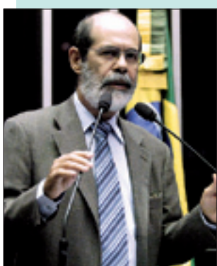
Senador acredita que união pode vencer eleições de 2010

deles vai colocar os processos de forma rápida à disposição de juizes e advogados.