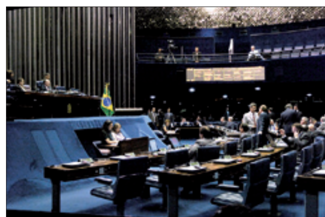
Indicação de diretor do BC recebeu apoio de governo e oposição

O presidente da Petrobras, José Sergio Gabrielli, disse ontem que considera equívoco dos auditores do TCU o diagnóstico de superfaturamento em obras da Refinaria Abreu e Lima, em Pernambuco. Gabrielli participou de audiência pública na Comissão Mista de Orçamento para prestar informações sobre a construção da refinaria. 6