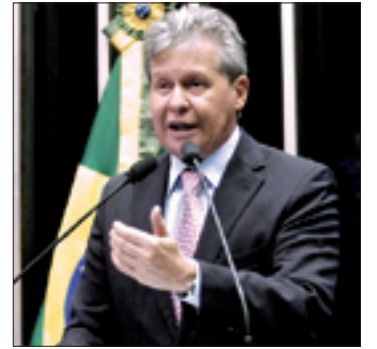
Tentativa de investigar Petrobras foi tachada de “impatriótica”, diz Virgílio

Virgílio afirmou ainda que, no dia 9, um avião da Força Aérea Brasileira (FAB) que estava prestes a pousar em Brasília teve de retornar a São Paulo para