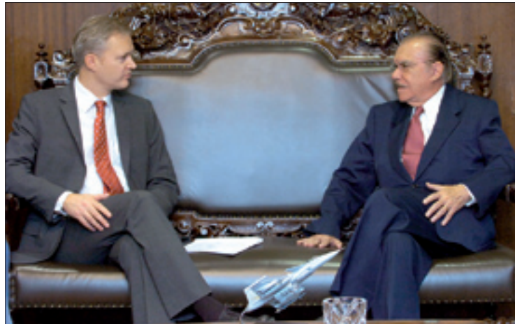
Tolgfors (E) apresenta a Sarney vantagens que Brasil terá se escolher aviões suecos

Ao deixar o gabinete do presidente do Senado, Tolgfors disse que discutiu com Sarney as relações Brasil-Suécia em geral e fez elogios à experiência brasileira em combustível limpo.