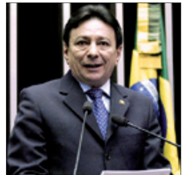
Papaléo: setor contribui para entrada de divisas e criação de empregos

Papaléo salientou que o turismo é uma das mais rentáveis fontes de recursos, contribuindo