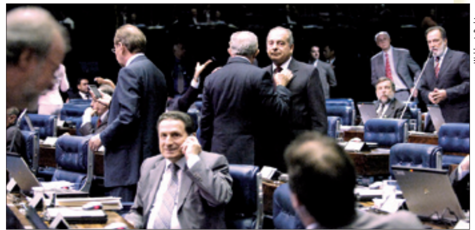
Aprovado em Plenário, projeto da Câmara que obriga consulta à população vai a promulgação