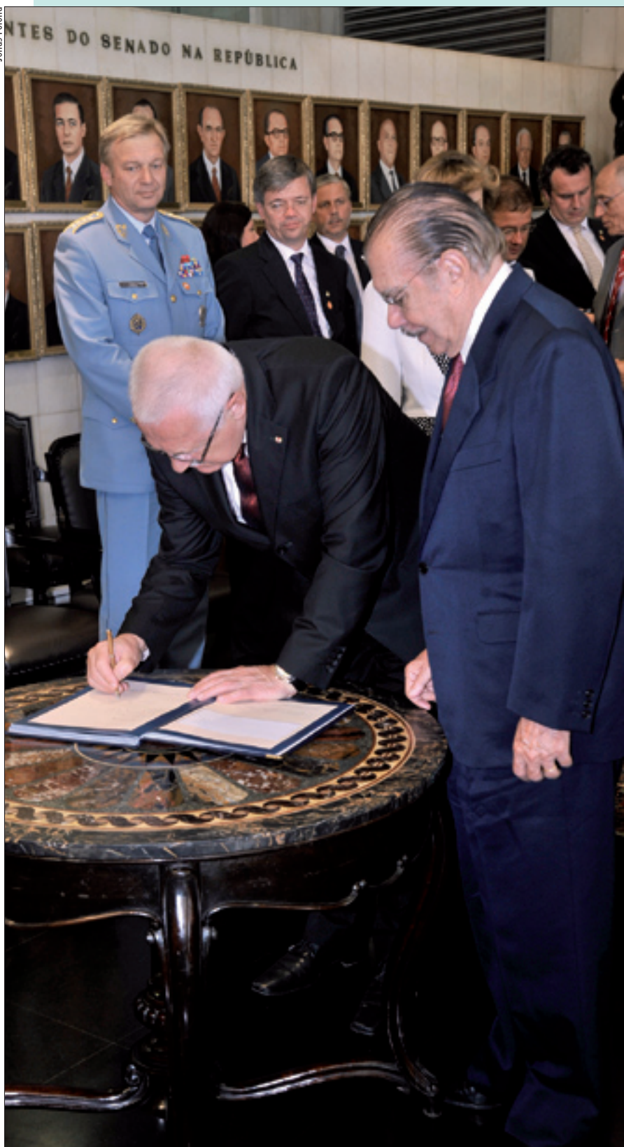
No Salão Nobre, Václav Klaus (E), observado por Sarney, assina o livro de visitantes

dir sobre mudança no fuso horário. O estado do Ceará e o município de Ponta Grossa poderão contratar novos empréstimos. 3