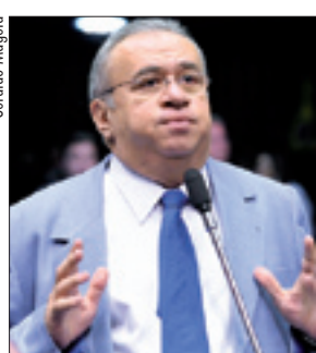
Heráclito: BB utilizou R$ 100 milhões para cobrir déficit

O parlamentar pediu esclarecimentos sobre