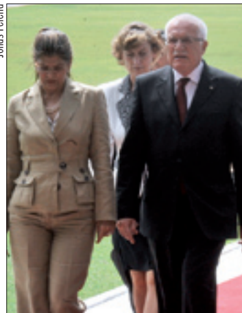
Klaus: Brasil e República Tcheca podem firmar acordo na fabricação de aviões

Klaus agradeceu, afirmando que os dois países podem ter uma grande e crescente cooperação em áreas como a fabricação de aviões e que seu país tem grande conhecimento