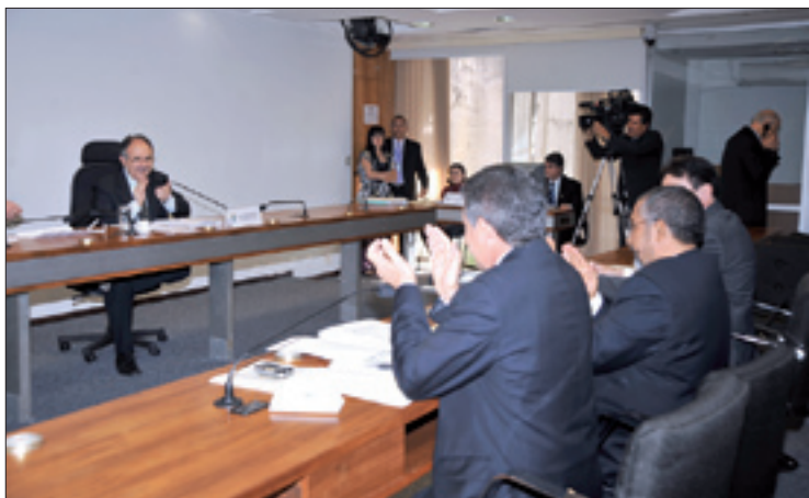
Debatadores, na audiência da CDH, revelam deficiências do sistema público de saúde

Paim prometeu também levar a proposta à Câmara, onde tramita o Estatuto da Pessoa com Deficiência (PL 3.638/00), de sua autoria, para que os deputados incluam as necessidades dos autistas no projeto.