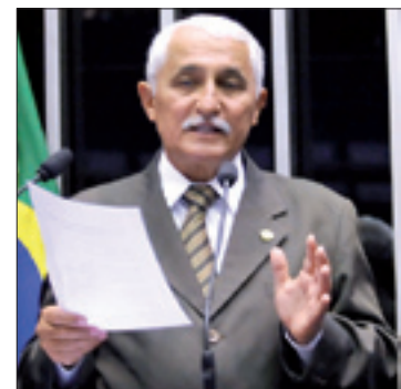
Augusto elogia, entre outras ações, o Programa Terra Legal

– Nossa dependência externa e o controle das multinacionais sobre sua comercialização [de fertilizantes] têm penalizado a produção agrícola em até 40% – criticou.