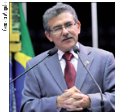
Segundo o líder do PSOL, Supremo acertou ao deixar decisão para Lula

Eduardo Azeredo (PSDB-MG) disse que a Justiça italiana "tem tradição de respeito aos direitos humanos". Magno Malta (PR-ES) frisou conhecer pessoalmente o sistema prisional italiano, que, segundo ele, tem melhores condições de atender um prisioneiro como Battisti que o brasileiro.