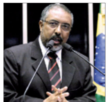
Paulo Paim ressalta que jovens são um grupo social de múltiplas identidades

– Acredito que os sonhos e os desafios dos nossos jovens das periferias, das fábricas, das favelas, do campo e da cidade, do