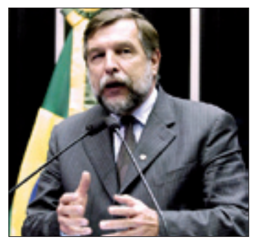
Segundo Arns, novos funcionários vão contribuir para modernizar o Judiciário

Arns afirmou que as pessoas com deficiência auditiva geralmente se devotam ao trabalho de forma muito concentrada e entusiasmada e que o trabalho