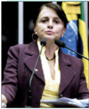
Serys: país ainda não está livre do preconceito racial