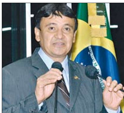
O ex-governador do Piauí afirma que é preciso investir muito em educação