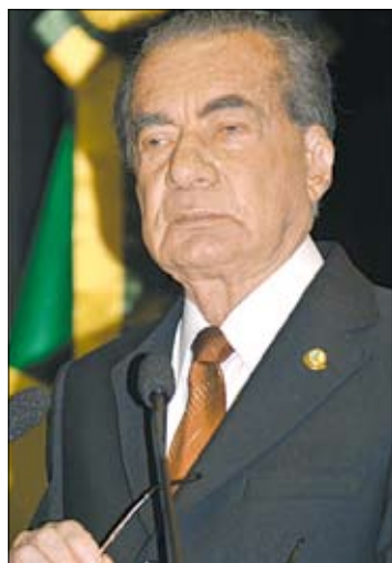
José Cruz/Senado Federal