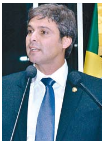
Para Lindbergh, é consenso que país precisa aumentar sua competitividade

Lindbergh fez um apelo aos senadores para que, independentemente de agremiação partidária e alinhamento ideológico, e de quais sejam suas visões acerca da condução da política macroeconômica, considerem o atual cenário internacional de dificuldades, com o elevado preço das commodities e a guerra cambial, que devem ser avaliados nas definições de