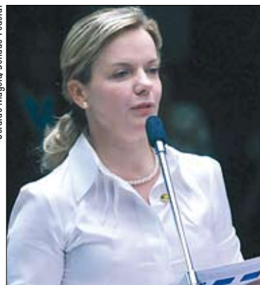
Senadora reiterou compromisso com a ampliação dos direitos das mulheres

Ela reiterou propostas de campanha, como o comprometimento com a defesa de mais direitos para as mulheres, o fortalecimento da agricultura e o desenvolvimento econômico e social do Paraná, a preservação do meio ambiente e melhorias na saúde, educação e segurança.