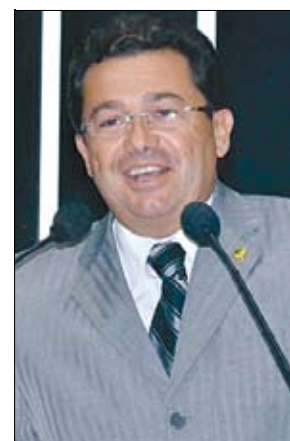
Senador promete cumprir a vontade dos paraibanos

Para ele, o profissional da saúde não pode exercer o seu papel de zelar pela vida dos cidadãos “com as mãos trêmulas de ansiedade e incerteza”.