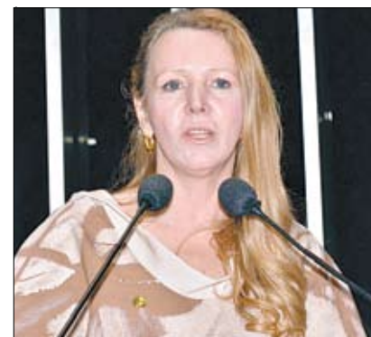
“Ajudamos a redemocratizar o país”, diz a senadora, na vida pública desde 1979

– Posso dizer com orgulho que o Piauí não é mais o estado mais pobre do Brasil – afirmou ele, sendo cumprimentado por Gleisi Hoffmann (PT-PR), Vanessa Grazziotin (PCdoB-AM) e Antonio Carlos Valadares (PSB-SE).