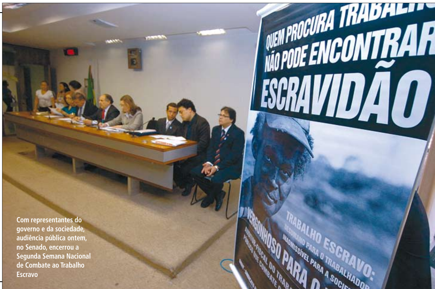
Com representantes do governo e da sociedade, audiência pública ontem, no Senado, encerrou a Segunda Semana Nacional de Combate ao Trabalho Escravo

As duas frentes nacionais empenhadas em combater o trabalho escravo no país pretendem se reunir com a presidente Dilma Rousseff para pedir o empenho do Executivo na aprovação da PEC que prevê o confisco de terras onde essa irregularidade for constatada. A escolha do fim da miséria como prioridade do governo federal será um dos argumentos usados. 8