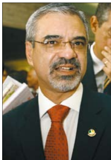
Cristiano Gallo/Senado Federal