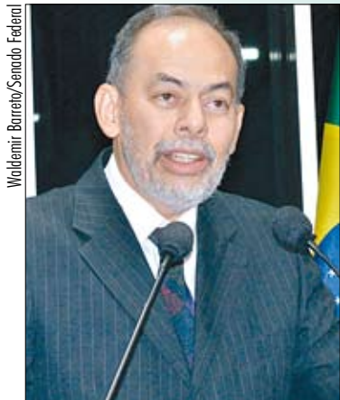
Crescimento econômico brasileiro deve ser mantido, diz Inácio Arruda