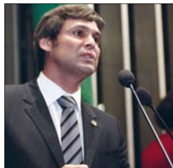
Lindbergh destaca preocupação com plano de emergência para acidentes

O senador ainda destacou a precariedade do Sistema Nacional de Defesa Civil.