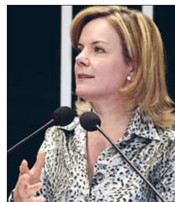
Senadora também leu em Plenário nota do ministro das Comunicações

Com relação ao programa Pró Infância, a senadora explicou que foram assinados 419 termos para a construção de 718 creches, 54 delas já concluídas. Estão previstos R$ 800 milhões em 2011 para a implementação do programa.