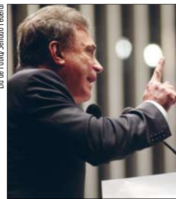
Para senador, problemas da saúde no país são incompetência e corrupção

O pior, acrescentou o líder do PSDB, é que apenas 2,5% das