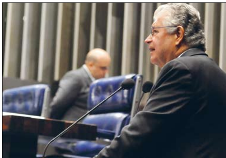
Senador acredita que um novo sistema deve substituir o antigo gradativamente

– A proposta que apresento se suporta nas ideias do nosso gênio da raça, o velho Guerreiro Ramos, que é a criação de um sistema que não torne obsoleto ou agrida de forma bruta o sistema anterior, e que se afirme no seu exercício, substituindo