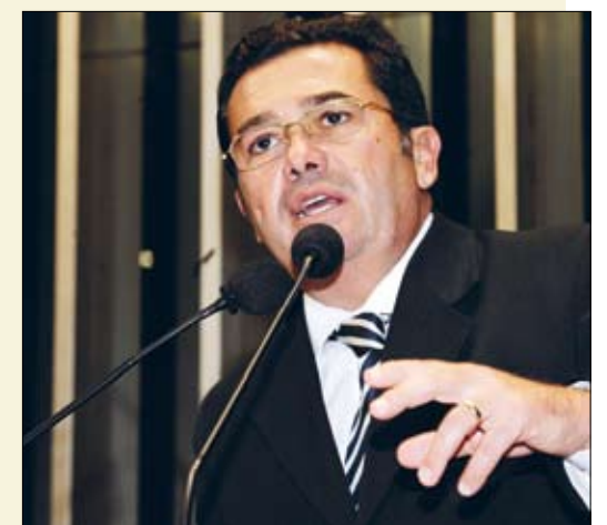
Vital do Rêgo quer debater, na Comissão de Assuntos Sociais, sugestões de políticas públicas

O senador considera que o fenômeno da migração e o aumento do consumo de drogas, especialmente do crack, estão diretamente relacionados ao aumento da criminalidade.