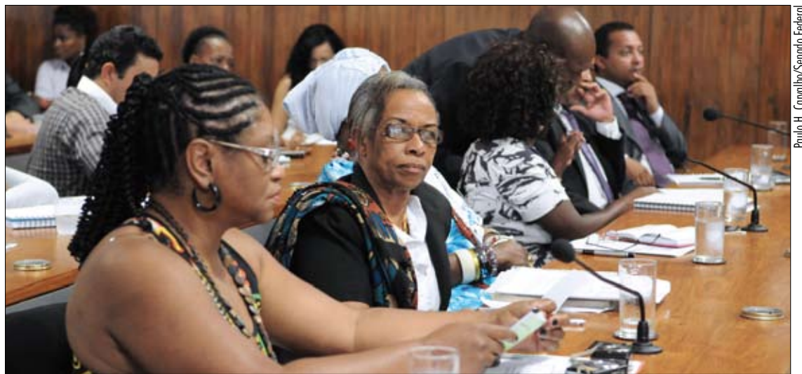
Representantes de diversas entidades participam do encontro na CDH: igualdade racial entrou na agenda do Estado

– Se não fizermos isso, não vamos tocar no cerne da nossa questão, que é a “naturalização” da desigualdade a partir de uma clivagem racial.