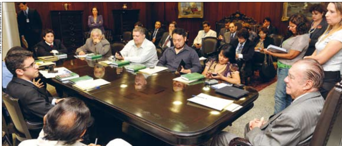
Acompanhado por gestores das áreas de Comunicação Social e Informática do Senado, Sarney (D) recebe blogueiros

SESSÕES ON-LINE: Confira a íntegra das sessões no Plenário e nas comissões Plenário: www.senado.gov.br/atividade/plenario/sessao Comissões: www.senado.gov.br/atividade/comissoes/sessao