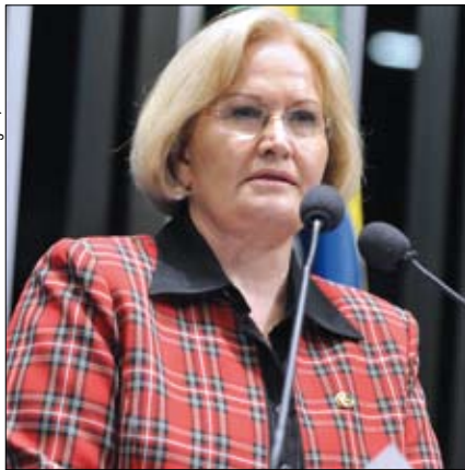
Senadora alerta que continua apreensão dos prefeitos em relação aos restos a pagar