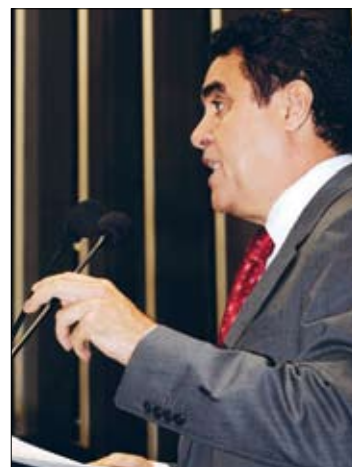
Santiago diz que malha ferroviária do Brasil é insuficiente e subutilizada

– Poderíamos ter menor número de caminhões poluindo, deteriorando nossas rodovias. O número de acidentes seria bem menor e muitas vidas seriam poupadas se as políticas de transporte tivessem priorizado a utilização das ferrovias – afirmou.