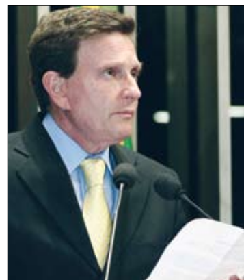
Proposta reduz tempo de contribuição para 25 anos, lembra Marcelo Crivella

Crivella também aproveitou o pronunciamento para comemorar os 176 anos de Campos dos Goytacazes, maior município do Rio de Janeiro, que tem hoje 463 mil habitantes.