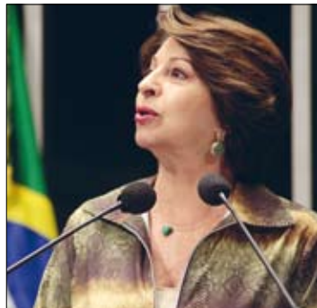
Segunda senadora, tragédia japonesa recolocou insegurança na pauta