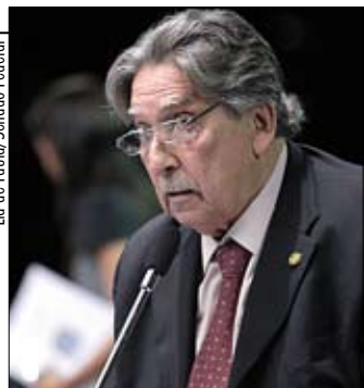
Cafeteira pede ajuda do ministro da Defesa para solucionar problema

O senador Epitácio Cafeteira (PTB-MA) se disse ontem preocupado com a interdição do terminal de passageiros do aeroporto de São Luís. Segundo ele, o aeroporto começou a ruir devido a problemas apresentados na execução das obras feitas pela Infraero. Cafeteira fez um apelo ao ministro da Defesa, Nelson Jobim, para que tome as providências necessárias para sanar os problemas causados pela