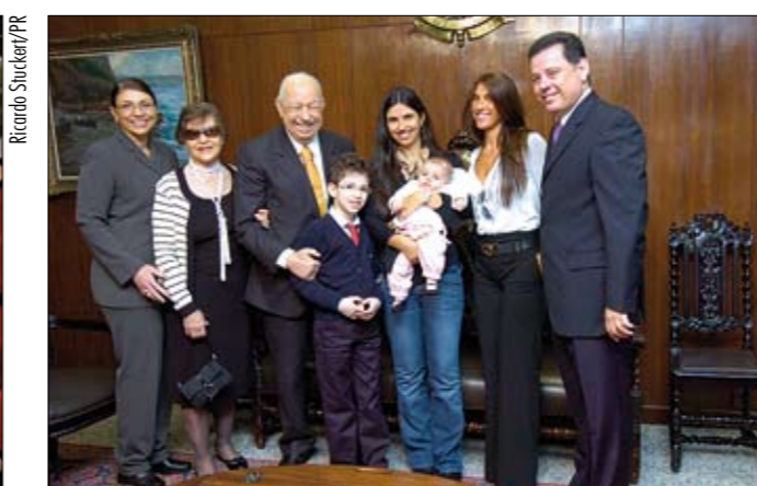
Em uma de suas muitas internações, recebendo a visita de Lula e Dilma. No Senado, com a mulher, filhos e netos, na entrega do Diploma José Ermírio de Moraes