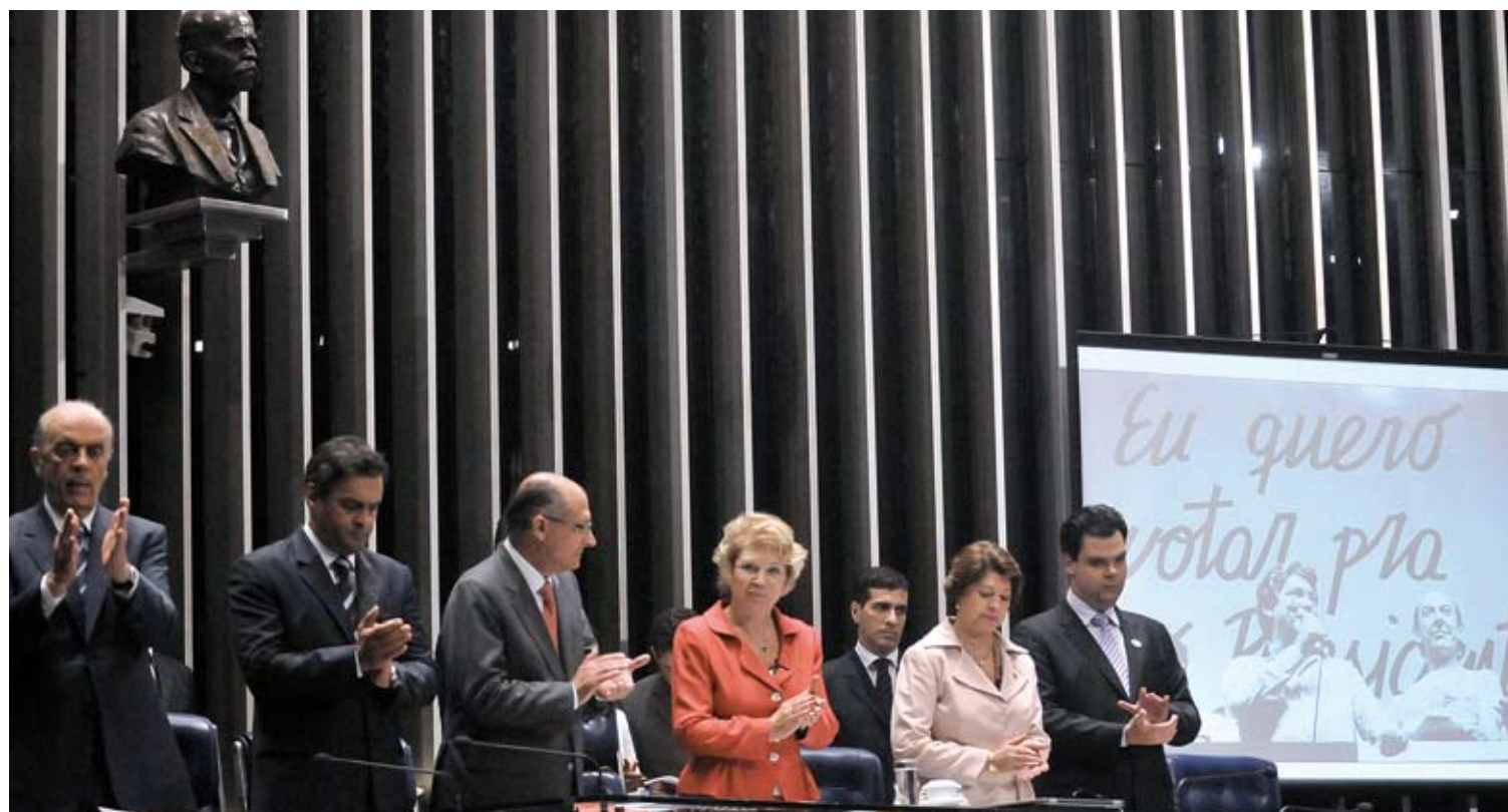
José Serra, Aécio Neves, Geraldo Alckmin, Marta Suplicy, Marisa Serrano e Bruno Covas, neto do homenageado: destaque às qualidades de homem público

Mario Covas "era um homem que tinha uma cultura profunda e, ao mesmo tempo, se aprofundava nos debates". Manifestava a todos "sua personalidade brilhante, seu patriotismo, sua coragem, sua bravura cívica".