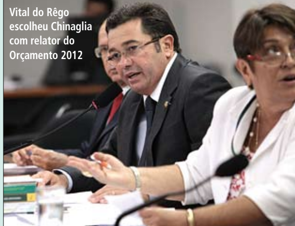
Vital do Rêgo escolheu Chinaglia com relator do Orçamento 2012

O primeiro vice-presidente da comissão será o deputado Sérgio Guerra (PSDB-PE), e o segundo vice, o senador Cyro Miranda (PSDB-GO).