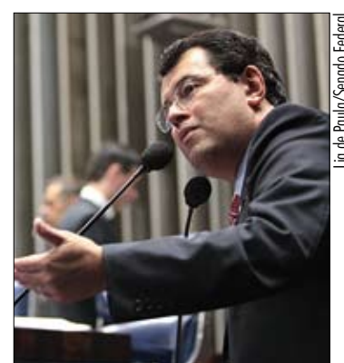
Senador quer avanços para os amazônidas e o agronegócio

Ele relatou que, no último fim de semana, realizou-se em Manaus o 2º Fórum Mundial de Sustentabilidade, com a presença de lideranças nacionais e internacionais como o ex-presidente americano Bill Clinton.