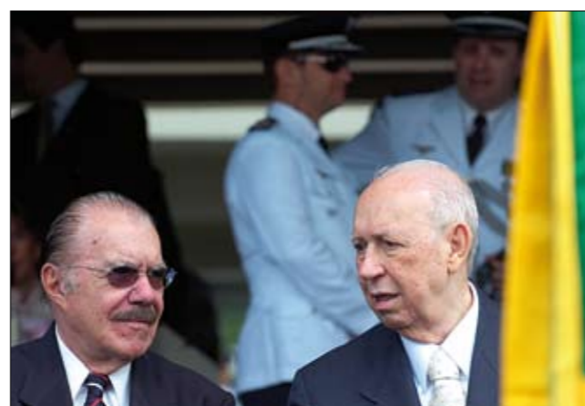
Ao lado do presidente do Senado, José Sarney, em uma das suas interinidades na Presidência. Subindo a rampa do Congresso, como vice eleito de Lula, e na sessão de abertura do ano legislativo, em fevereiro de 2010

retorno para esta tarde. O governo federal decretou luto de sete dias. O senador Fernando Collor (PTB-AL) lamentou o falecimento em nota. – O Brasil perde um dos homens mais lúcidos da nossa política. Um homem contemporâneo do seu tempo.