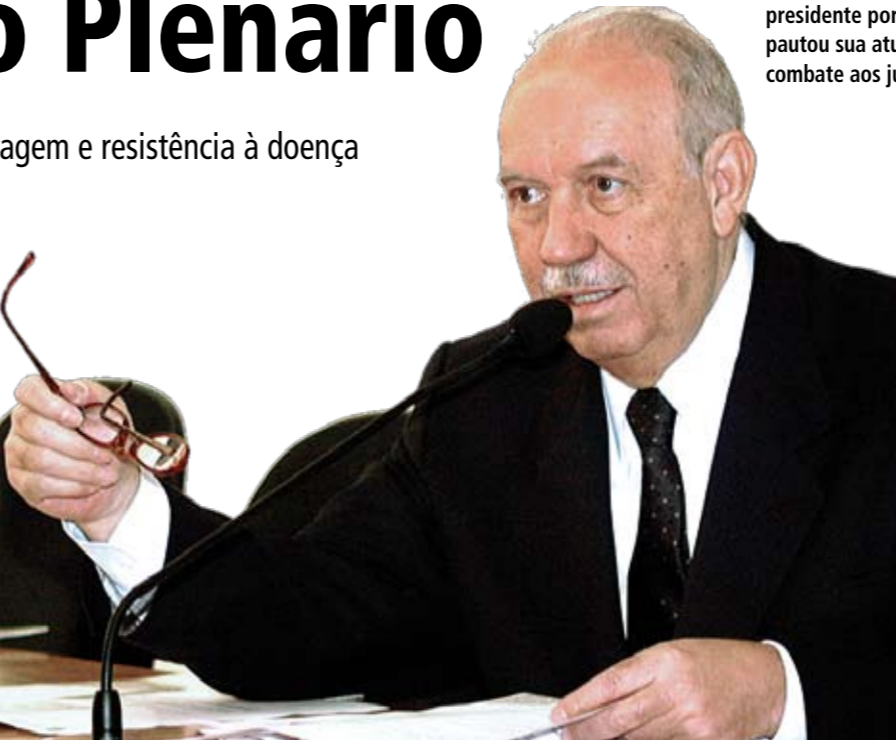
José Alencar foi vice-presidente por oito anos e pautou sua atuação pelo combate aos juros altos

Vários senadores e senadoras passaram então a homenagear José Alencar. A obstinação e o pensamento independente do político mineiro foram destacados como parte da herança que ele deixa para a população brasileira.