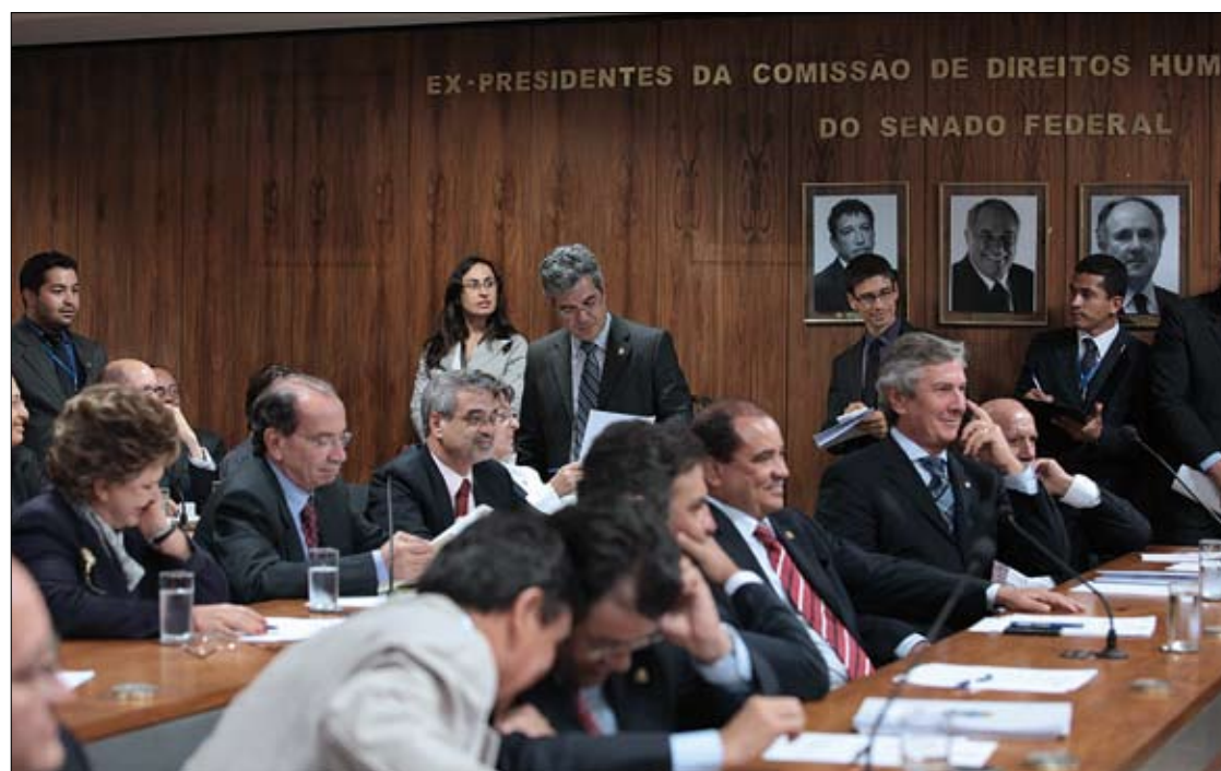
Na reunião de ontem, os senadores da Comissão Especial de Reforma Política rejeitaram o chamado distritão

Atualmente, o Brasil adota o sistema proporcional com lista aberta, podendo os eleitores votar em um candidato ou em um partido nos pleitos para deputados (estaduais, federais