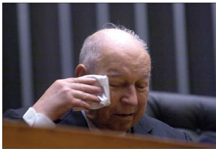
Homenageado ano passado pelo Plenário do Senado, José Alencar se emocionou

Ex-vice-presidente da República e ex-senador morreu ontem de câncer, após emocionar e inspirar o país com seu exemplo de coragem e resistência à doença