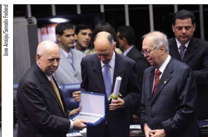
Em uma de suas muitas internações, recebendo a visita de Lula e Dilma. No Senado, com a mulher, filhos e netos, na entrega do Diploma José Ermírio de Moraes