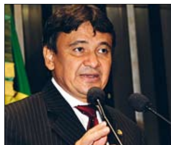
Wellington elogiou ministro da Saúde