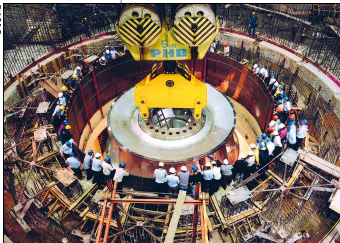
Parceiros na construção da hidrelétrica de Itaipu, Brasil e Paraguai assinaram acordo para o uso da energia produzida que o país vizinho não utiliza

Atualmente, o Congresso tem 120 dias para votar a medida provisória, mas a Constituição não estabelece um prazo má-