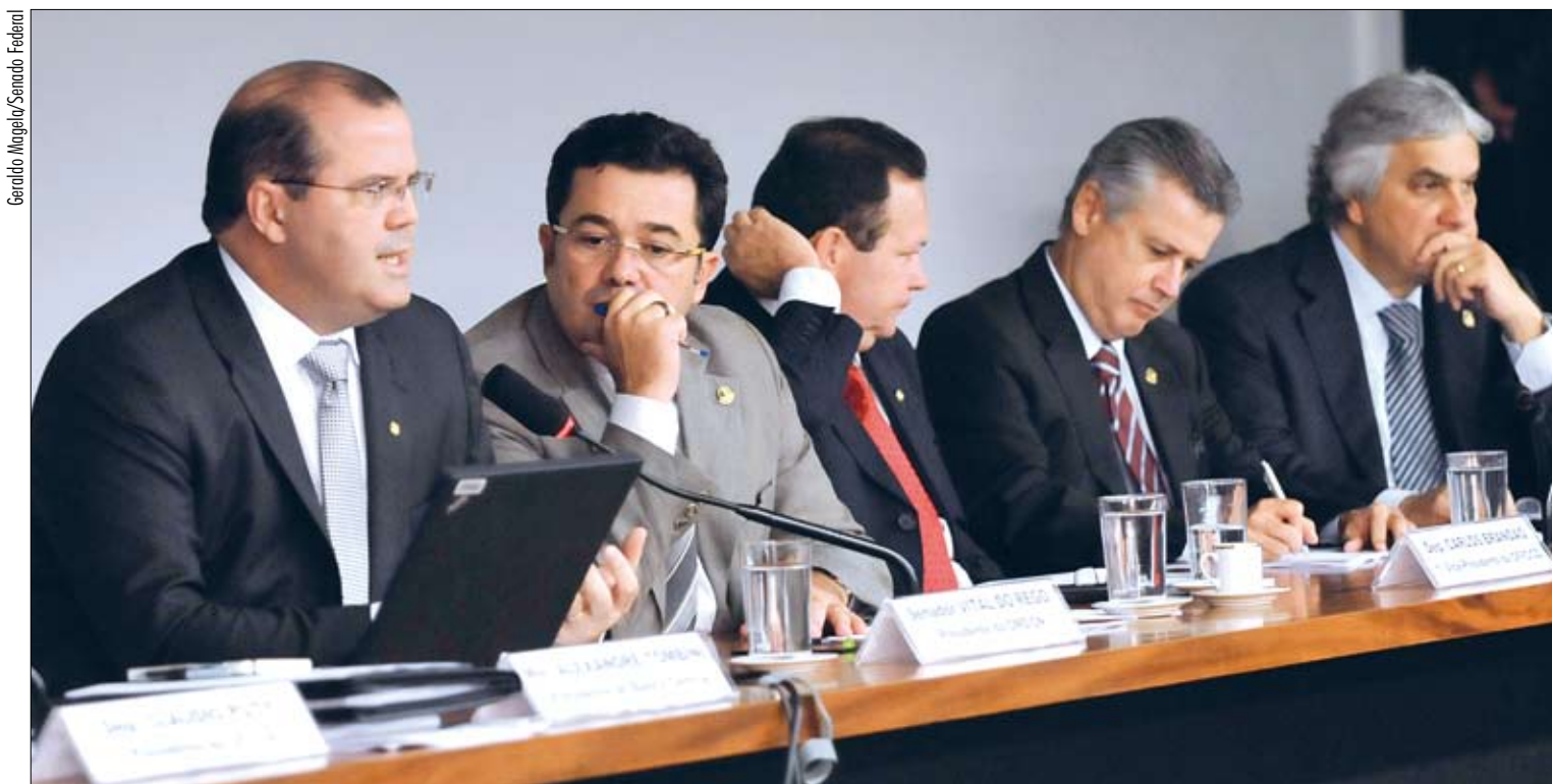
Na audiência pública conjunta, presidente do BC, Alexandre Tombini (E); Vital do Rêgo, deputado Carlos Brandão, Rodrigo Rollemberg e Delcídio Amaral

O FLUXO DE recursos externos para o país desde o início do ano alcançou US$ 54 bilhões, informou ontem o presidente do Banco Central, Alexandre Tombini, em audiência pública no Congresso. Ele destacou a atenção que a instituição está tendo com o fato de essas entradas envolverem forte movimento de captações diretas de empresas e de bancos, responsáveis por ingressos estimados em torno de US$ 30 bilhões.