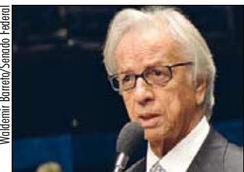
Segundo Itamar Franco, pacientes migram para opções onerosas

– Inexplicavelmente, o metotrexato não tem sido comercializado normalmente. Os pa-