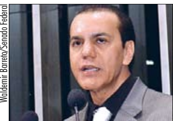
Saúde, segurança e educação estão entre as preocupações do senador

Nascido em Estrela do Norte (GO), o senador afirmou que viveu a infância de maneira simples e “sofrendo os rigores comuns a uma família sem recursos financeiros”. Saiu de casa aos 11 anos à procura de mais oportunidades de estudo e trabalho. Formou-se em Direito e Contabilidade. Ao lado dos dois filhos, comanda o