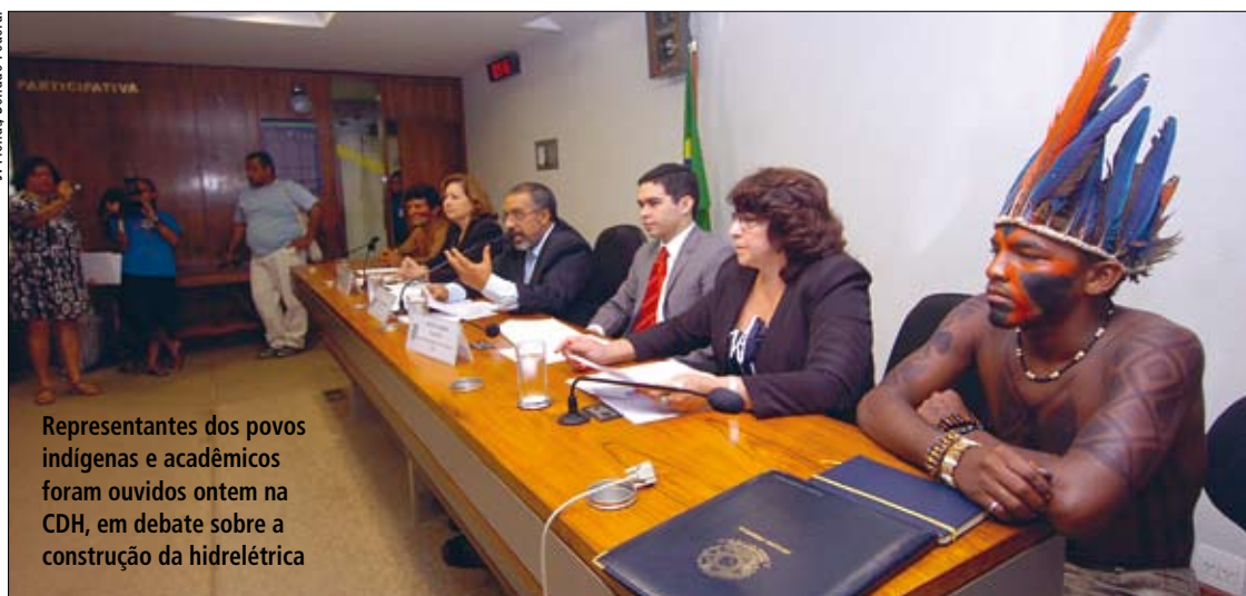
Representantes dos povos indígenas e acadêmicos foram ouvidos ontem na CDH, em debate sobre a construção da hidrelétrica