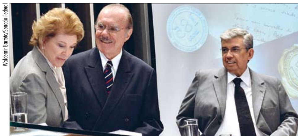
Marta Suplicy e José Sarney, com o ministro e senador licenciado Garibaldi Alves

O presidente Sarney disse também que todos os brasileiros deveriam ter profunda admiração por esta instituição legislativa, destacando momentos históricos em que o órgão mostrou a sua atuação decisiva, como na aprovação da Lei Áurea.