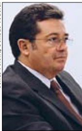
Vital do Rêgo

– Quem quiser, vá conhecer a realidade de um prefeito, que não consegue fechar nunca sua folha, sua relação despesa/receita, porque todos os dias recebe mais encargos – sugeriu o senador. Ele apontou alternativas para o problema como desoneração da folha de pagamento, simplificação do ITR, fortalecimento dos municípios com maior repasse da União dos impostos arrecadados e definição da alíquota do ICMS via lei complementar.