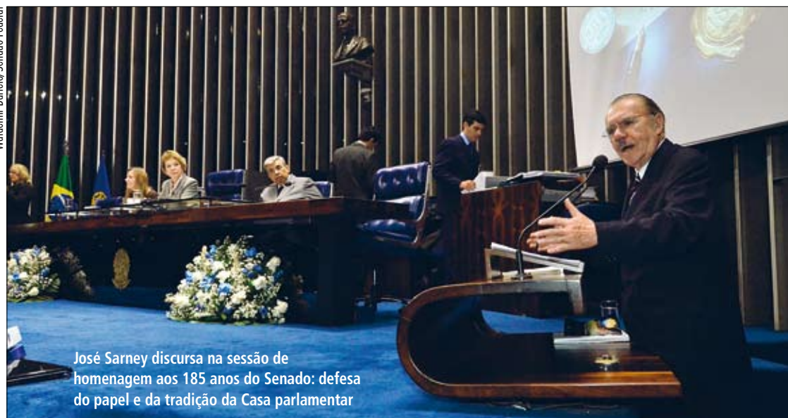
José Sarney discursa na sessão de homenagem aos 185 anos do Senado: defesa do papel e da tradição da Casa parlamentar