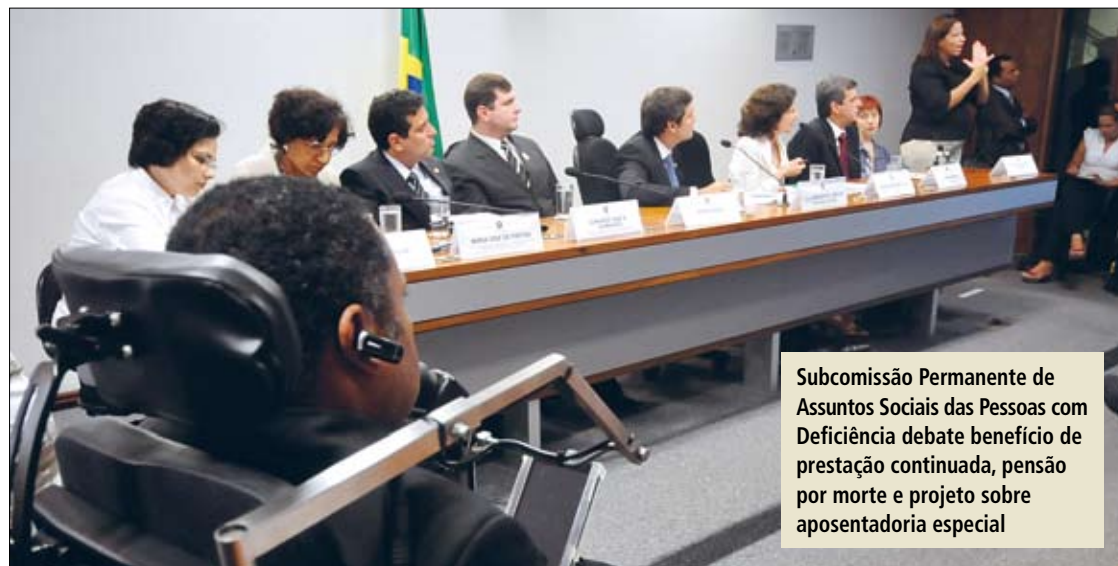
Subcomissão Permanente de Assuntos Sociais das Pessoas com Deficiência debate benefício de prestação continuada, pensão por morte e projeto sobre aposentadoria especial