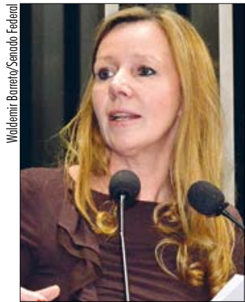
Para senadora, justificativas “não encontram base em fatos reais”

Para o senador, a superintendência é um instrumento importante para planejar a região, permitindo que o Centro-Oeste, “carente de uma instituição como esta, possa, de forma sustentável, buscar o desenvolvimento.