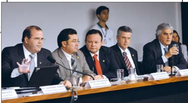
Alexandre Tombini (E), ao lado de senadores: vigilância sobre dólares