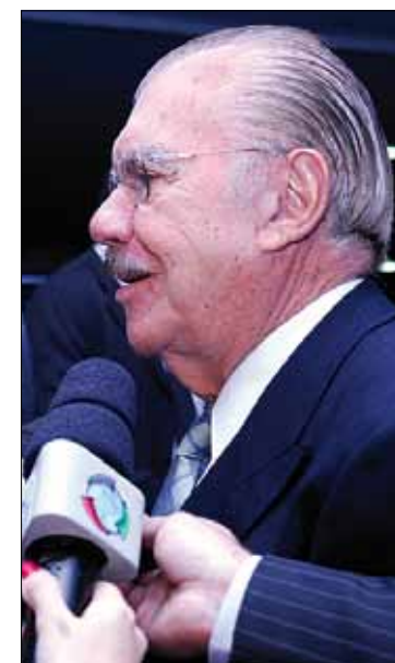
Sarney lamenta que ainda não exista consenso para a votação

Sarney pretendia se reunir ontem com a presidente da República, Dilma Rousseff, e o presidente da Câmara, Marco Maia, no Palácio do Planalto, para discutir projetos em tramitação no Congresso Nacional.