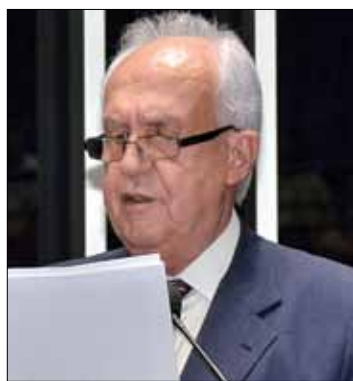
Jarbas Vasconcelos pede que "faxina ética de Dilma" seja verdadeira

Vasconcelos elogiou medidas recentes de Dilma e disse esperar que a "faxina" seja verdadeira e que não se limite a um partido.