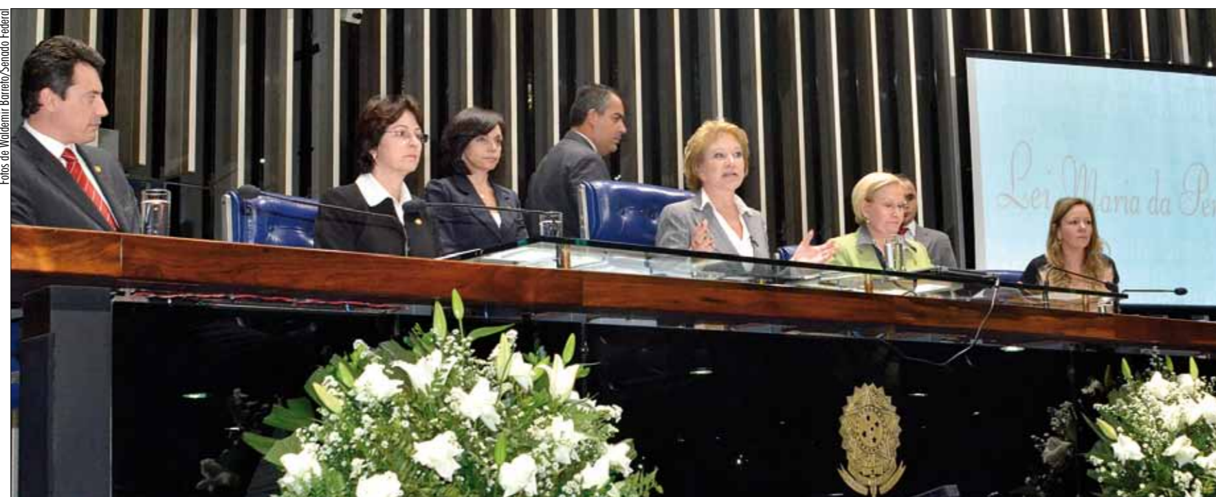
Marta Suplicy preside a sessão, entre os senadores Sérgio Souza, Ana Rita, Ana Amélia Lemos e Vanessa Grazziotin; com a nova lei, segundo ela, “bateu em mulher, vai para a cadeia”