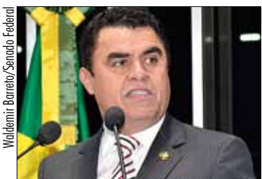
Santiago: interesse da população

Na quarta-feira, o senador antecipou que a base partidária solicitaria convites aos ministros da Agricultura, Wagner Rossi; do Desenvolvimento Agrário, Afonso Florence; e das Cidades, Mário Negromonte, além do diretor-geral da Agência Nacional do Petróleo, Haroldo Lima.