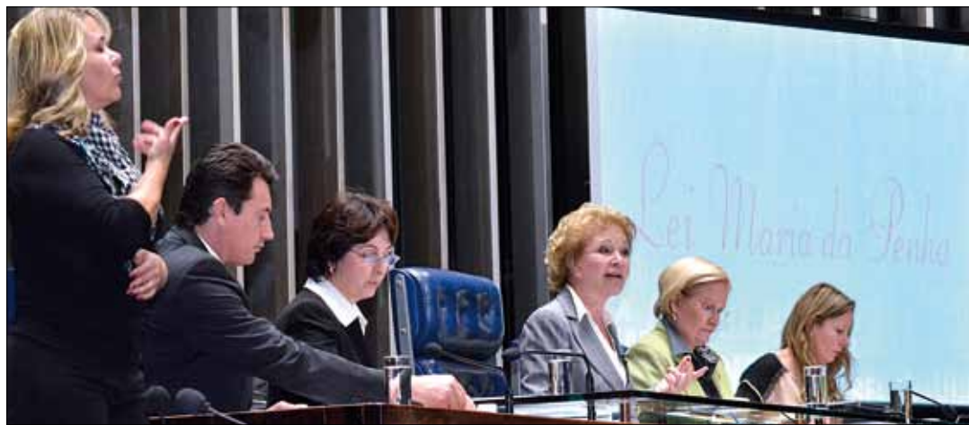
Marta Suplicy (C) abre homenagem à lei, ao lado de Sérgio Souza, Ana Rita, Ana Amélia e Vanessa Grazziotin

Medida provisória reduz de 11% para 5% a alíquota previdenciária a ser paga pelo microempreendedor individual. Proposta perde validade após o dia 18. 2