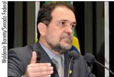
Senador aponta vontade de esclarecer