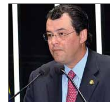
Eduardo Braga destaca importância da MP 540 para zona industrial de Manaus