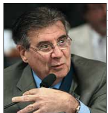
Cyro diz que governo Dilma passa por "inferno astral" prolongado

Também foi lido requerimento de convite ao ministro das Cidades, Mário Negromonte, que deve ser votado na próxima reunião.