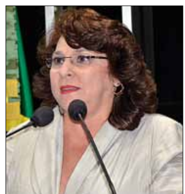
Para Marinor, só uma CPI pode apontar realmente os envolvidos no escândalo