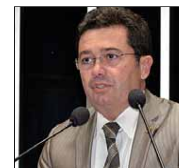
Para senador, veto é injustificado e causa incerteza nos outros Poderes

O senador registrou ainda que Dilma já disse que os benefícios fiscais da Zona Franca, que terminarão em 2023, deverão ser prorrogados por mais 50 anos.