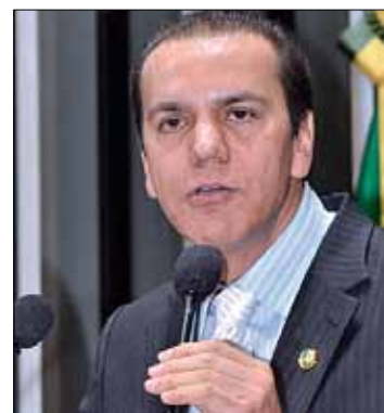
Para senador, não há guerra que mate mais do que a corrupção

– Não há guerra, tsunami , terremoto nem terroristas que matam mais do que a corrupção. São milhões de crianças morrendo nas filas dos hospitais. E, na verdade, não falta dinheiro. Faltam gestores com responsabilidade, porque o dinheiro existe, mas é desviado.