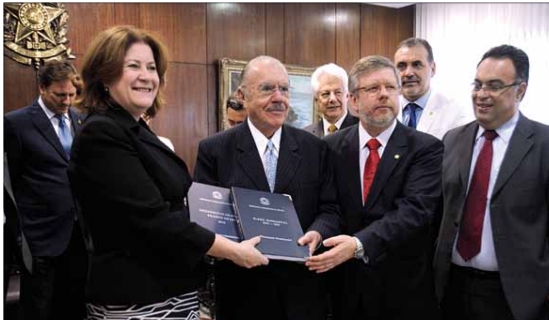
Ministra Miriam Belchior entrega proposta orçamentária aos presidentes do Senado, José Sarney, e da Câmara, Marco Maia

Fonte: Secretaria de Política Econômica/MF