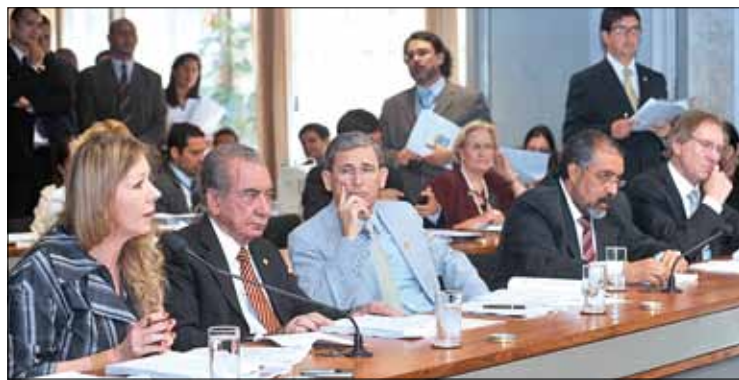
Vanessa Grazziotin se manifesta em votação na Comissão de Assuntos Sociais