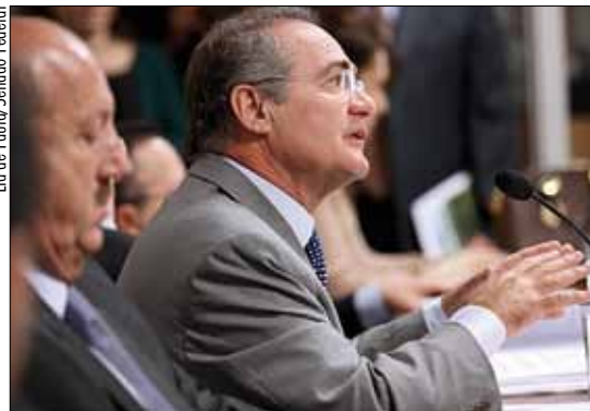
Renan Calheiros encontrou erro em processo da CCJ

– E, contra arquivamento, só há uma solução: recurso assinado por um décimo dos membros da comissão. Não interessa se foi erro de assessoria ou da mesa. Votamos pelo arquivamento. Essa seria a primeira vez que votaríamos duas vezes o mesmo projeto – protestou Demóstenes, acompanhado por Pedro Taques (PDT-MT) e Aloysio Nunes.