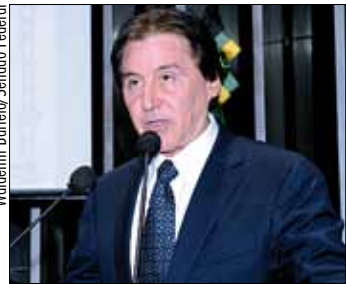
Senador ressalta papel de liderança

– A indústria de transformação do calçado vem assumindo posição de marcante destaque no processo de desenvolvimento econômico regional, gerando milhares de empregos no setor calçadista, constituído por mais de 300 empresas, en-