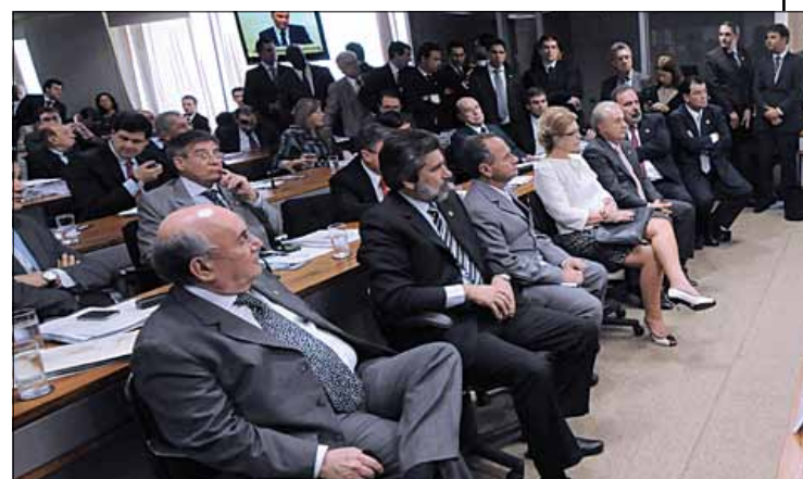
Senadores debatem royalties com governadores em reunião conjunta

Meta é chegar a acordo antes de votar a Emenda Ibsen e evitar que a questão vá ao STF