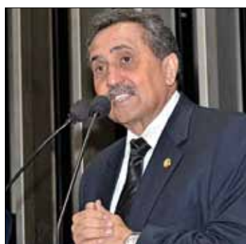
Senador destaca reconhecimento recebido pelos profissionais da área

O Dia do Nutricionista marca a criação, em 1949, da Associação Brasileira de Nutricionistas.