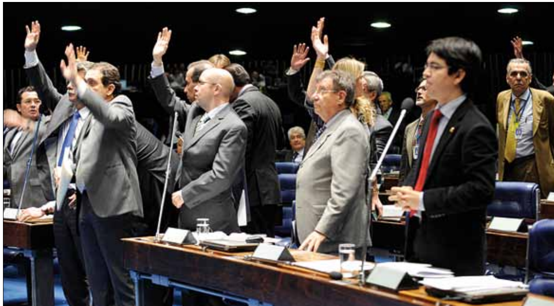
Senadores votam mudanças na estrutura e atribuições dos Correios, feitas por meio de medida provisória do Executivo

– A empresa passará a ter um escopo maior na sua atuação sem perder o monopólio postal e isso é extremamente importante. A medida provisória e o relatório do senador Vital do Rêgo foram no sentido de preservar essa condição do monopólio postal no Brasil.