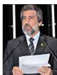
Raupp: Amazônia vista por dentro

O senador Valdir Raupp (PMDB-RO) comemorou a passagem dos 39 anos de fundação da Rede Amazônica de Rádio e TV. Ele afirmou que em nenhuma outra região do Brasil os meios de comunicação tiveram tanta relevância como na Amazônia.