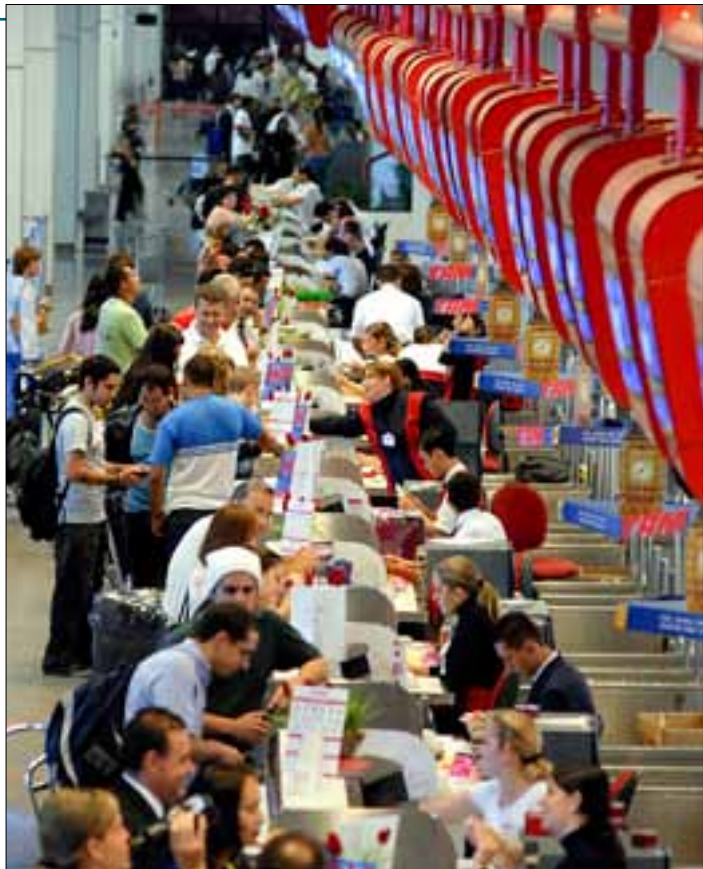
Guichês de companhias em Brasília: se voo for cancelado, reembolso será total

Também participaram da reunião os deputados Mauro Benevides (PMDB-CE) e Romanna Remor (PMDB-SC).