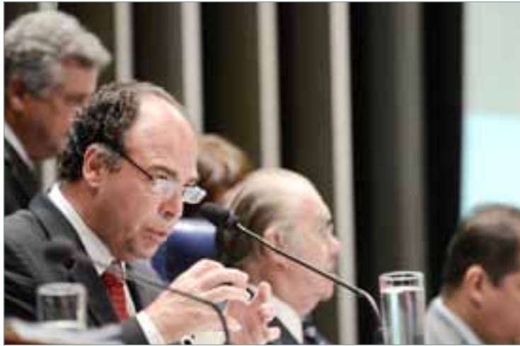
Ministro Fernando Bezerra presta esclarecimentos a senadores e deputados

Dos R$ 98 milhões empenhados pelo ministério em favor de Pernambuco, explicou o ministro, R$ 70 milhões foram destinados à construção de cinco barragens na bacia dos rios Sirinhaém e Mundaú, como forma de evitar desastres de grandes proporções similares aos de 2010. Uma das