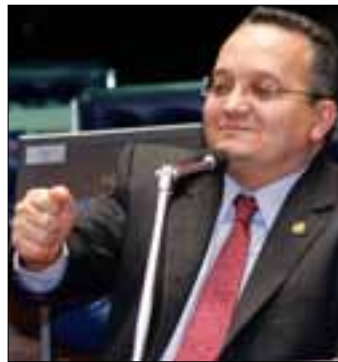
Ações judiciais recorrentes justificam regulamentação, diz Pedro Taques

De acordo com o projeto (PLS 757/11), o passageiro terá direito ao reembolso de 95% do valor do bilhete