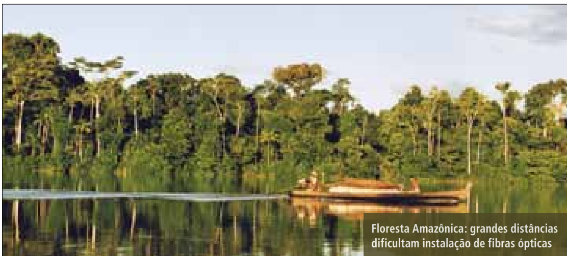
Floresta Amazônica: grandes distâncias dificultam instalação de fibras ópticas