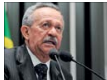
Benedito: mais atenção ao Nordeste

Entre as ações prometidas pelo governo, segundo o senador, estão a cessão de retroscavadeiras para o preparo de reservatórios que