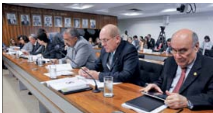
Senadores do colegiado discutiram também mudança de nome de ala do Senado

O relator, Benedito de Lira, reiterou seu voto contrário alegando abertura de precedente