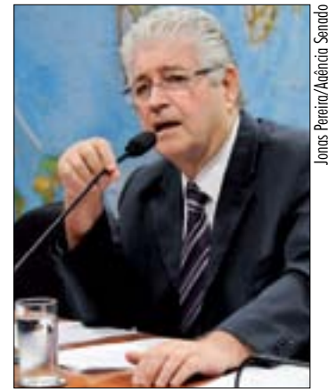
Para Requião, parlamentares precisam ser ouvidos sobre o tema

— Em vez de promover uma guerra comercial com a Argentina, precisamos conversar. Montar um projeto comum de desenvolvimento industrial. O caminho que se delineia é o da unidade, com a participação da Venezuela,