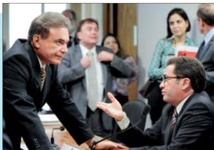
Alvaro Dias acusa a CPI, presidida por Vital do Rêgo, de “blindar” governadores

CPI da Mulher convoca dois secretários de Santa Catarina 4