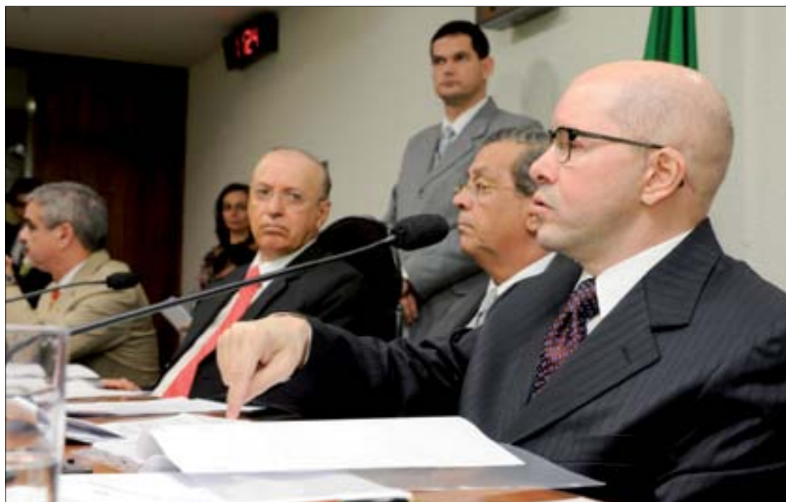
Senador Demóstenes Torres fala ao Conselho de Ética, observado pelo presidente do colegiado, Antonio Carlos Valadares