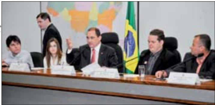
Senador Vicentinho Alves (C) fala durante debate sobre manutenção de aviões