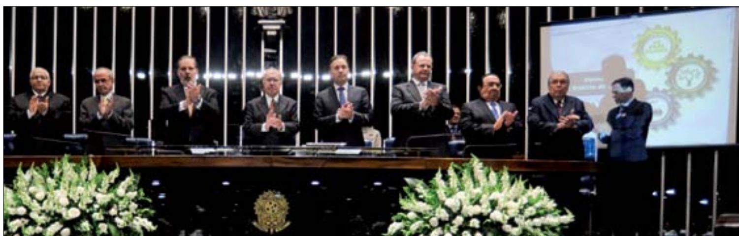
Para José Sarney, agraciados com o Diploma José Ermírio de Moraes em sessão especial do Senado são expressões do dinamismo empresarial brasileiro

Agrotóxico menos nocivo pode ganhar estímulo 3