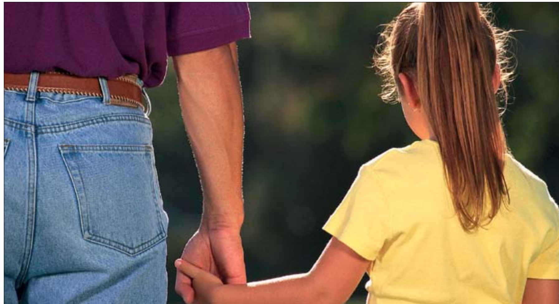
O pagamento da pensão alimentícia é uma obrigação do cônjuge que não detém a guarda e um direito dos filhos até completarem 18 anos ou, caso estejam cursando a universidade, 24 anos

Se os menores estiverem sob a guarda de terceiro, eles podem, amparados pelo