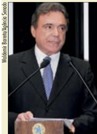
Senador atribui números baixos à "irresponsabilidade" eleitoral