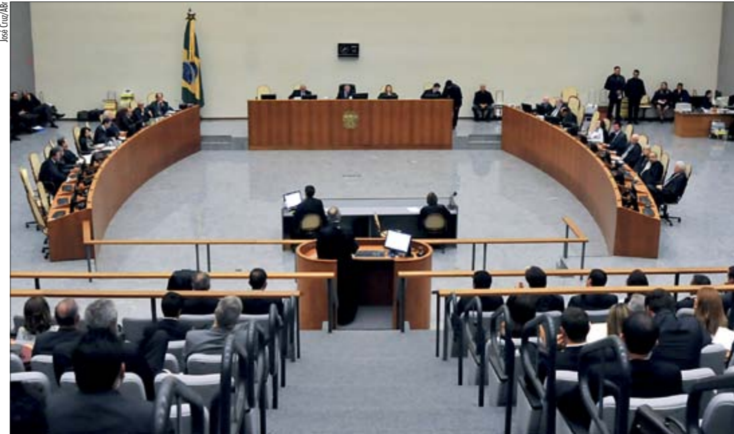
Plenário do Superior Tribunal de Justiça: pensão alimentícia é tema frequente na mesa de juizes, que podem decidir por pagamento em dinheiro ou in natura

Há ainda a ação de oferecimento de alimentos, em que o pai ou mãe ajuíza a ação, oferecendo a quantia que se propõe a pagar, mais os outros benefícios que puder entregar.