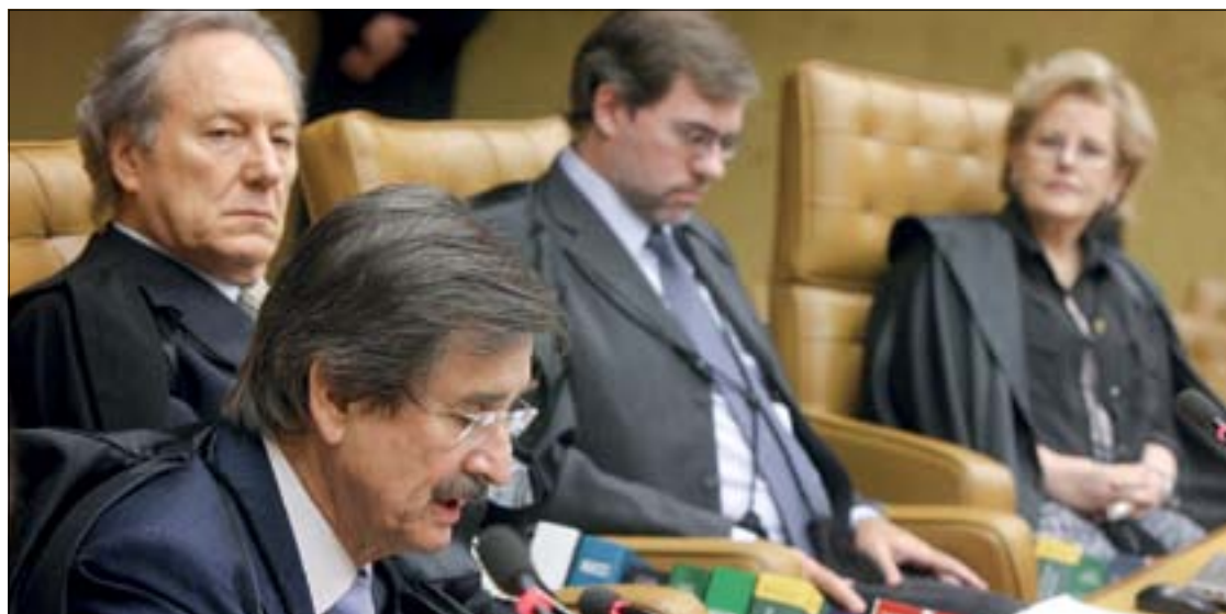
Cezar Peluso foi aposentado compulsoriamente pelo STF ontem, quando completou 70 anos: idade máxima pode subir

Por isso, além do direito ao silêncio, a defesa requereu que o depoente não fosse obrigado a assinar termo de compromisso para dizer a verdade e que pudesse ser assistido pelos advogados durante o depoimento.