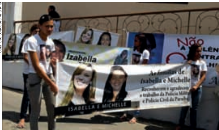
Mulheres de Queimadas (PB) pedem justiça: cinco vítimas, duas mortes

Formado por 11 senadores, 11 deputados e igual número de suplentes, a comissão é presidida pela deputada Jô Moraes (PCdoB-MG) e tem como relatora a senadora Ana Rita (PT-ES).