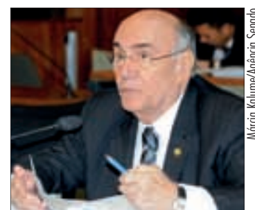
Falta vontade para regulamentar o ressarcimento, acusa senador

— A peça orçamentária que foi encaminhada para o Congresso, novamente, não traz nenhum real sequer para a rubrica da Lei Kandir de compensação dos estados exportadores — disse.