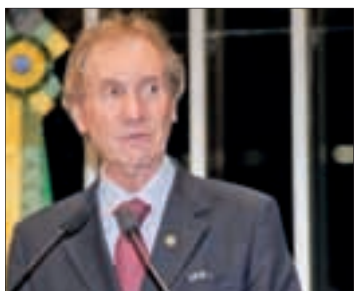
Senador celebra pacote que reduz impostos na folha de pagamento

Segundo o senador, o Pará é um dos estados que mais sofre com a Lei Kandir, já que 40% da economia vem da mineração e da exportação.