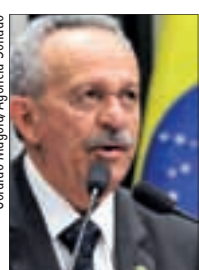
Geraldo Magela/Agência Senado