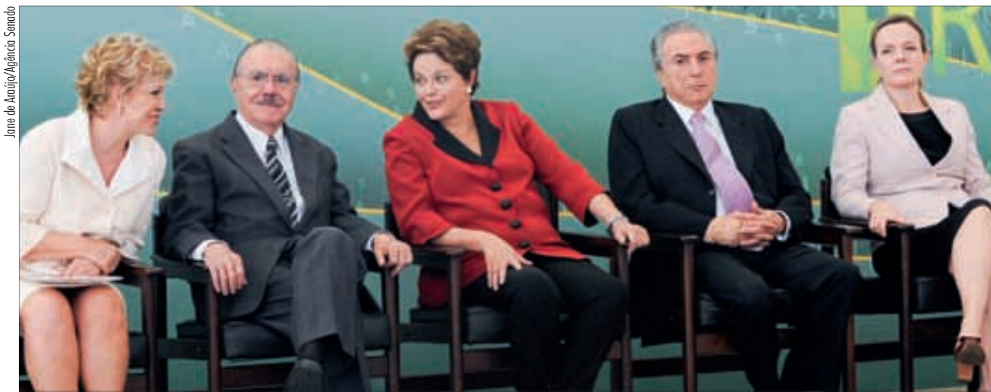
Marta Suplicy (E), José Sarney, Dilma Rousseff, Michel Temer e Gleisi Hoffmann durante a solenidade de posse da nova ministra da Cultura