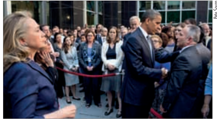
Hillary Clinton e o presidente Obama anunciam mais segurança nas embaixadas

Para Collor, o atentado não deve ser visto apenas como reação de grupos radicais islâmicos contra a exibição de um vídeo considerado ofensivo