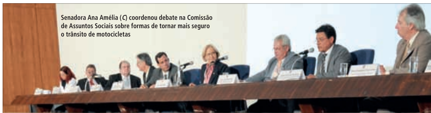
Senadora Ana Amélia (C) coordenou debate na Comissão de Assuntos Sociais sobre formas de tornar mais seguro o trânsito de motocicletas

Professor de Harvard fala no Interlegis sobre motivação no serviço público 2