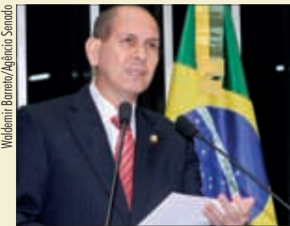
Anibal se compromete a servir ao país e a trabalhar “pela construção do diálogo”

— De 182 atletas da delegação nacional, 156, ou seja, 85%, são bolsistas — disse, ao cumprimentar o governo brasileiro, em especial a presidente Dilma Rousseff e o ministro do Esporte, Aldo Rebelo.