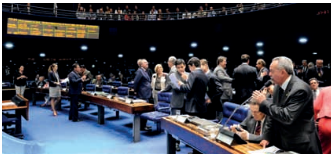
Senadores em Plenário no esforço concentrado: projetos importantes aprovados, como o que inclui vacina anti-HPV no SUS

688/11, que concede perdão de dívidas de crédito rural contratadas por pequenos produtores na área de atuação da Superintendência de Desenvolvimento do Nordeste (Sudene).