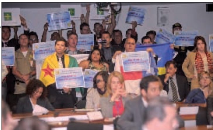
Em agosto, agentes penitenciários pediram à CCI a aprovação do projeto