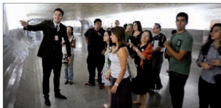
Grupos são conduzidos por equipe de monitores do Senado e da Câmara

Mais informações sobre a visita podem ser obtidas na página www.senado.leg.br/senado/visite , pelo e-mail visite@senado.gov.br ou pelos telefones (61) 3303-4671 e 3303-1581, de segunda a sexta-feira. Aos sábados, domingos e feriados, é só ligar para (61) 3216-1768, das 9h30 às 17h.