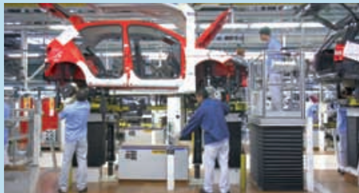
Pela MP, governo quer modernização e maior competitividade da indústria

A MP tem como relator o deputado Leonardo Quintão (PMDB-MG) e como relator-revisor o senador Romero Jucá (PMDB-RR).