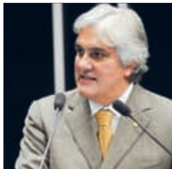
Delcídio propôs a participação da Comissão de Infraestrutura no debate

Também é de Ferraço requerimento aprovado pela CI para realização de audiência sobre o planejamento rodoviário e as concessões de rodovias