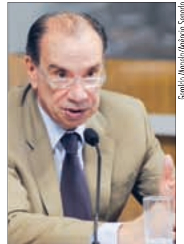
Relator, Aloysio Nunes rejeitou emendas para agilizar aprovação

Roberto Requião (PMDB-PR) também se mostrou cético sobre a eficiência da quarentena. Simon disse que um governo sério não precisaria de lei para enquadrar a conduta dos agentes. Ainda assim, ambos votaram a favor da proposta, da mesma forma que Pedro Taques (PDT-MT), José Pimentel (PT-CE) e Sérgio Souza (PMDB-PR).