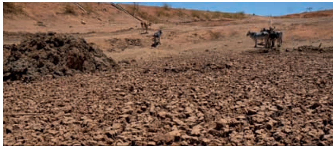
Seca prolongada fez vários municípios nordestinos decretarem emergência e motivou governo a ampliar auxílio financeiro

Com isso, os agricultores receberão R$ 1.240, se participantes do Garantia-Safra, ou R$ 720, se contemplados pelo Auxílio Emergencial. Os valores normais são, respectivamente, R$ 680 e R$ 400.