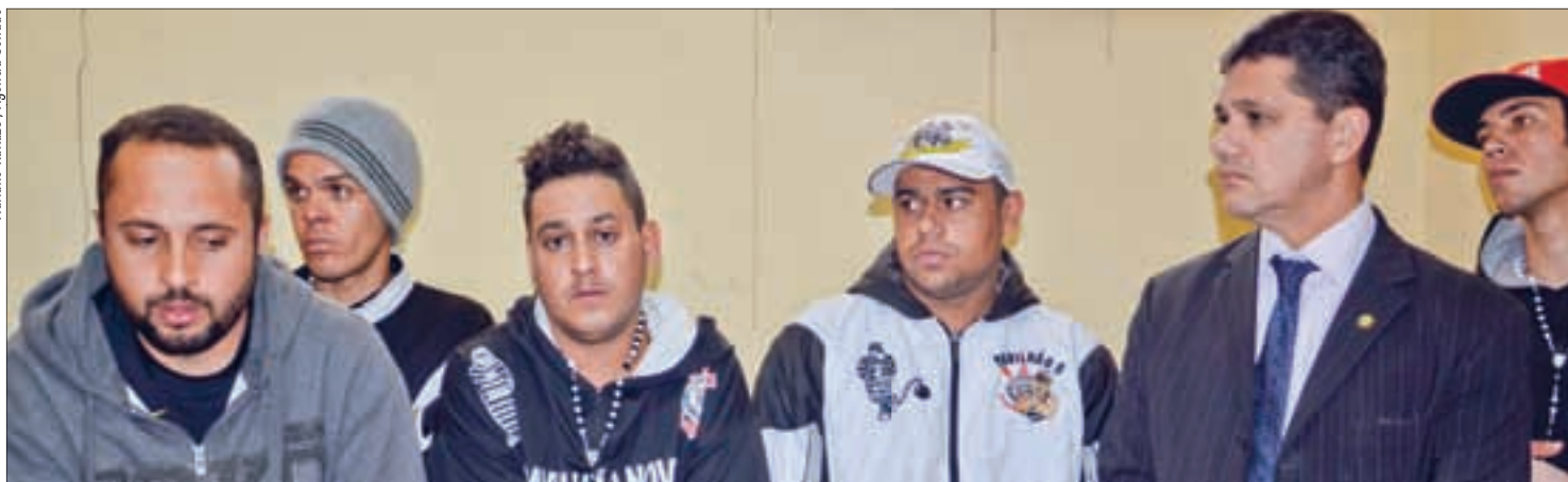
Senador Ferraz (2º à dir.) visitou os 12 torcedores presos no país vizinho e disse que eles estão sendo usados como barganha política pelo governo boliviano

Novos direitos das domésticas serão promulgados amanhã 6