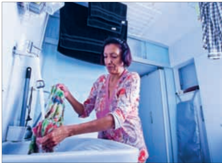
Trabalho doméstico, com promulgação da PEC, terá tratamento igual aos demais

Atualmente, o trabalhador doméstico tem apenas parte dos direitos garantidos pela Constituição aos trabalhadores em geral. Alguns dos direitos já assegurados são salário mínimo, pagamento de 13º salário, repouso semanal remunerado, férias,