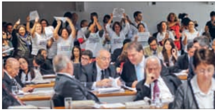
Criação de cargos aprovada pela CCJ na quarta ainda será votada pelo Plenário

As novas vagas estão previstas em projeto de lei da Câmara (PLC 123/2012). Estão sendo criadas 400 vagas no cargo de técnico administrativo da carreira de especialista em meio ambiente, para o Instituto Brasileiro do Meio Ambiente e dos