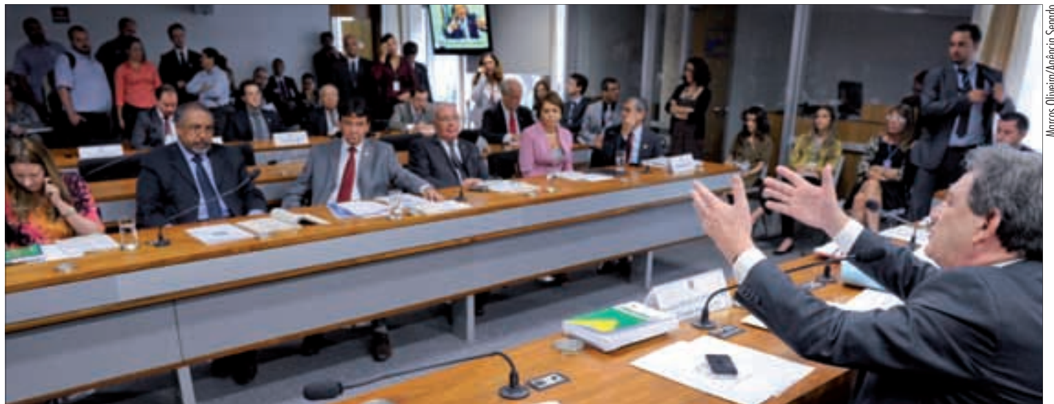
Identificação obrigatória de medicamentos e outros insumos adquiridos pelo SUS foi aprovada na Comissão de Assuntos Sociais, presidida por Waldemir Moka (D)

Houve necessidade de segunda votação porque, no lugar do texto original, foi aprovado um substitutivo, proposto pelo senador Romero Jucá (PMDB-RR), relator da matéria. De acordo com a proposta de Jucá, a forma de identificação dos medicamentos, materiais e equipamentos médicos-hospitalares será