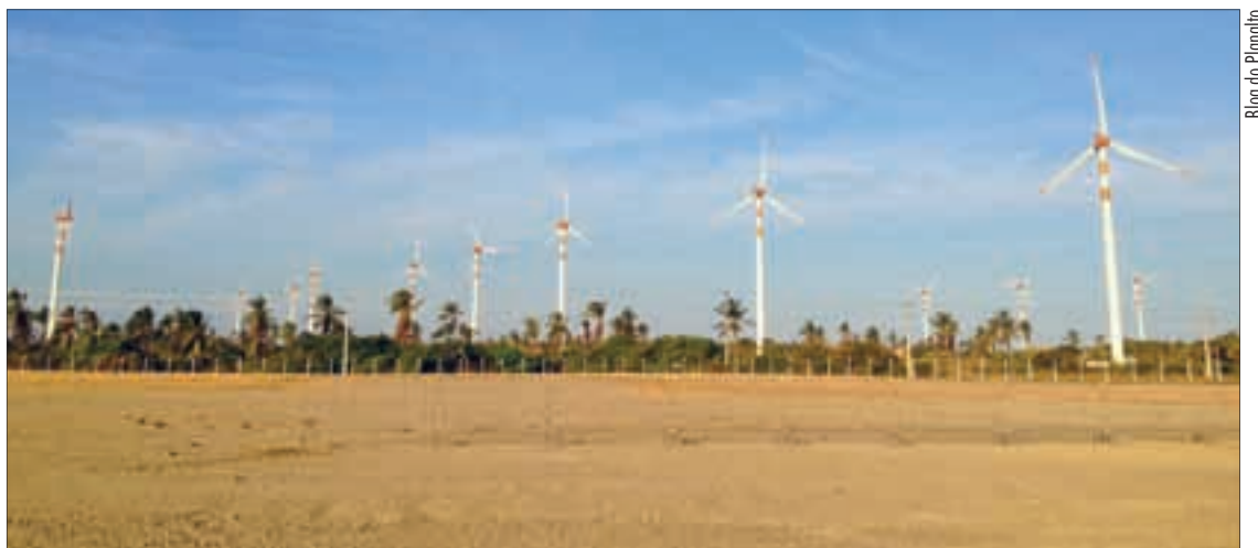
Blog do Planalto

Se assim for feito, a soma das áreas ocupadas por reservatórios hidrelétricos na Amazônia seria inferior a 0,6% da área total da região, resultando em uma alteração ambiental que o pesquisador considera “perfeitamente assimilável pelos ecossistemas”.