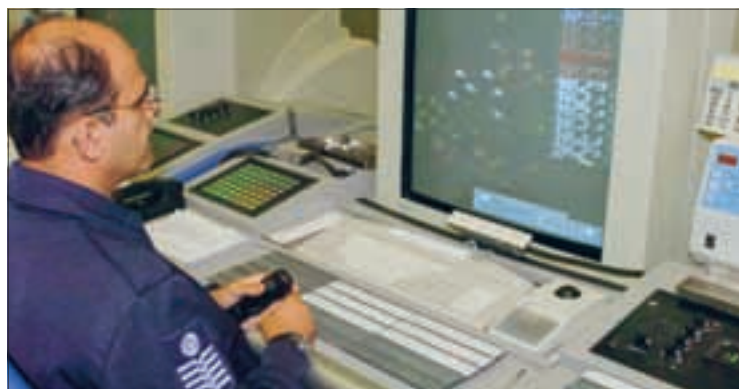
Aumento do efetivo de controladores acompanhou crescimento do tráfego aéreo

“Julgamos plena de mérito a iniciativa de dotar o setor aéreo brasileiro de maior quantidade de cargos na sensível área de controle de tráfego”, disse.