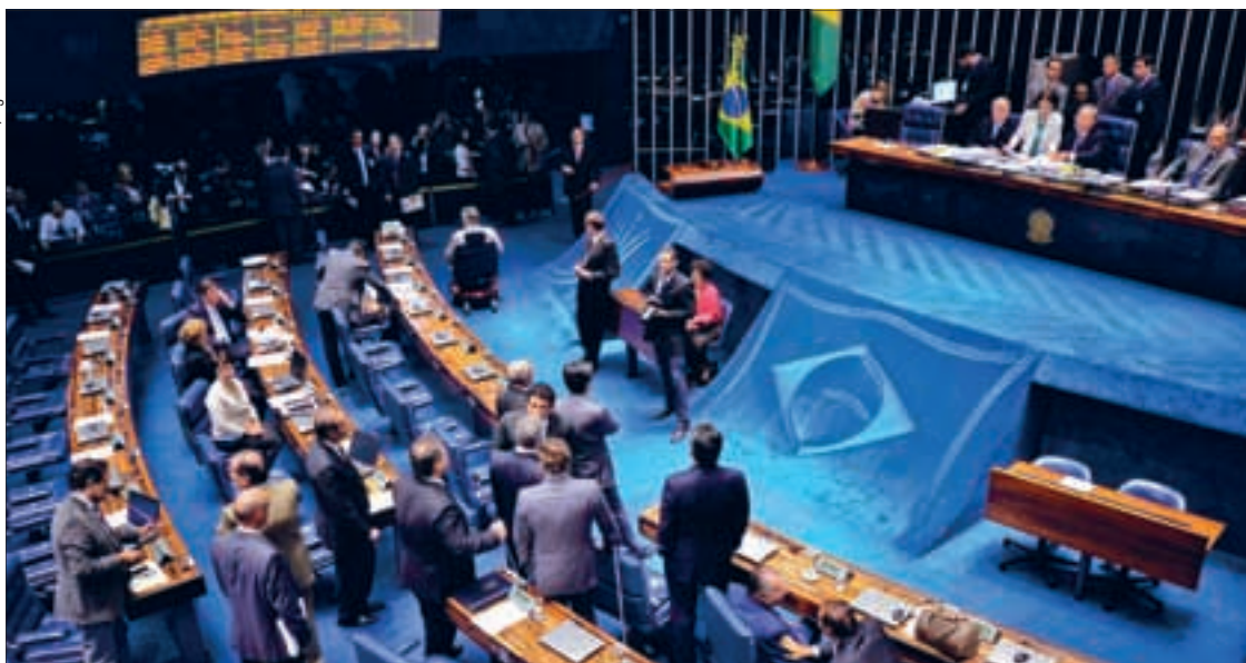
Plenário avaliará temas polêmicos nesta semana, como a repartição dos recursos do Fundo de Participação dos Estados

Regras de distribuição de recursos para estados, criação de tribunais federais e ajuda para regiões que sofrem com a estiagem devem dominar debates nesta semana