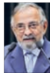
Pedro Franco/Agência Senado