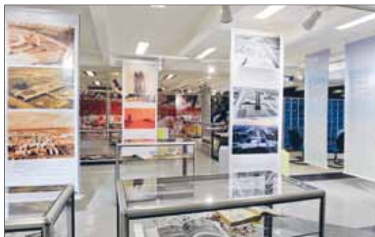
Fotografias mostram a capital federal na época da inauguração, em 1960

Casa com a história da cidade. Também fazem parte da exposição documentos, livros e periódicos antigos que tratam da transferência da capital do Rio de Janeiro para Brasília, além de objetos de propriedade de senadores e servidores da Casa.