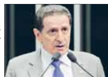
Além de pagarem pouco, operadoras exigem produtividade, diz o senador

Os 40 anos da Empresa Brasileira de Pesquisa Agropecuária (Embrapa) foram lembrados por Luiz Henrique (PMDB-SC). Para o senador, a empresa é a prova indiscutível de que, se o país se dedicar à pesquisa científica e tecnológica, conseguirá resultados positivos na área industrial, de serviços e da informação. Luiz Henrique disse que os resultados do Sistema Nacional de Pesquisa Agropecuária, comandado pela empresa, colocaram o Brasil na liderança do processo da produção agropecuária. Acrescentou que o ministro de Ciência e Tecnologia, Marco Antônio Raupp, pretende criar para o setor industrial uma empresa nos mesmos moldes.