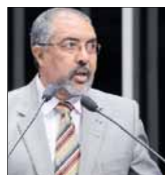
Paim não admite propostas que representem perda de direitos

necessidade de modernizar a CLT, porém, marca o 70º aniversário. Textos que buscam a flexibilização das normas são defendidos pelas entidades patronais e motivam protestos das centrais sindicais, enquanto dividem opiniões entre os parlamentares. Exemplos disso são o PL 951/2011, do deputado Júlio Delgado (PSB-MG), que cria o Simples Trabalhista e reduz encargos sociais da contratação de funcionários por micros e pequenas empresas; e o PL 4.330/2004, do deputado Sandro Mabel (PL-GO), que regulamenta a terceirização. Também polêmico é o PL