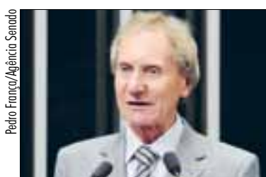
Casildo pede ainda mais atenção ao biodiesel e ao bioquerosene

Para reverter a situação, disse o senador, o atual governo do estado, em parceria com a Secretaria dos Portos da Presidência da República, vai investir R$ 5 milhões na modernização do porto e incluí-lo no Plano Nacional de Logística Portuária.