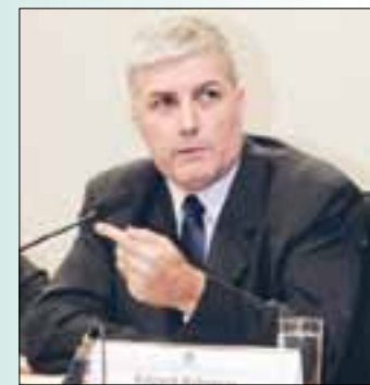
Rebouças explica que é ínfima a parcela da publicidade infantil

Rebouças defendeu a regulamentação da publicidade infantil e rebateu quem considera censura qualquer debate sobre regulação da mídia. Ele advertiu que o foco na regulamentação da publicidade infantil não pode ser só a TV, já que a internet tem cada vez mais audiência entre os pequenos.