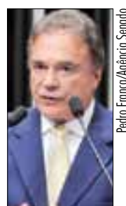
Pedro Franco/Agência Senado

— Os sistemas rodoviários e ferroviários estão esgotados. O sistema portuário brasileiro é um dos mais lentos do mundo.