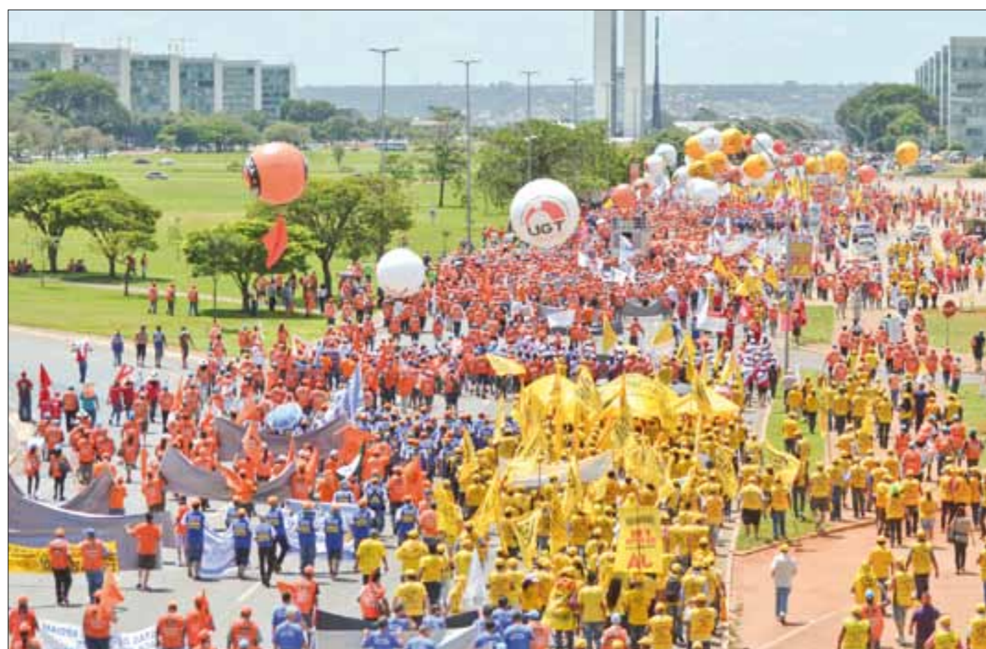
Redução da jornada de trabalho e fim do fator previdenciário estão na pauta das centrais sindicais, que protestaram em Brasília na semana passada

necessidade de modernizar a CLT, porém, marca o 70º aniversário. Textos que buscam a flexibilização das normas são defendidos pelas entidades patronais e motivam protestos das centrais sindicais, enquanto dividem opiniões entre os parlamentares. Exemplos disso são o PL 951/2011, do deputado Júlio Delgado (PSB-MG), que cria o Simples Trabalhista e reduz encargos sociais da contratação de funcionários por micros e pequenas empresas; e o PL 4.330/2004, do deputado Sandro Mabel (PL-GO), que regulamenta a terceirização. Também polêmico é o PL