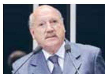
Senador aponta liderança conquistada pelo país na produção agropecuária

— Na semana passada tivemos o pior resultado semanal da balança comercial desde 1998.