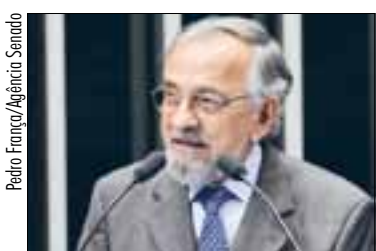
Capiberibe: porto passou 10 anos abandonado devido a manobra política

Também está na pauta da CMA projeto (PLS 626/2011) de Flexa Ribeiro (PSDB-PA) que permite o cultivo sustentável da cana-de-açúcar em áreas já exploradas por outras atividades agrícolas e nos biomas Cerrado e Pampa situados na Amazônia Legal. A proposta, relatada pelo senador Acir Gurgacz (PDT-RO), já foi aprovada pela Comissão de Desenvolvimento Regional e Turismo (CDR) e pela Comissão de Agricultura e Reforma Agrária (CRA).