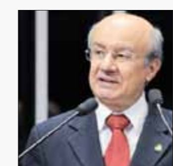
Pimentel ressalta pleno emprego e bom momento para assalariado

— A CLT foi e continua sendo uma questão de justiça com o trabalhador brasileiro. Por requerimento de Paim e de Antonio Carlos Valadares (PSB-SE), o Senado realizará em maio sessão especial para comemorar os 70 anos da CLT.