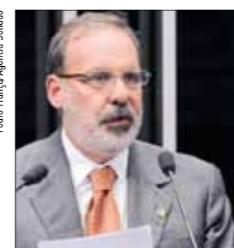
Armando quer que legislação dê mais força a acordos coletivos

1.463/2011, que institui o Código de Trabalho, em substituição à CLT. Na justificativa do projeto, o autor, deputado Silvío Costa (PTB-PE), diz que o protecionismo exagerado da legislação brasileira é um