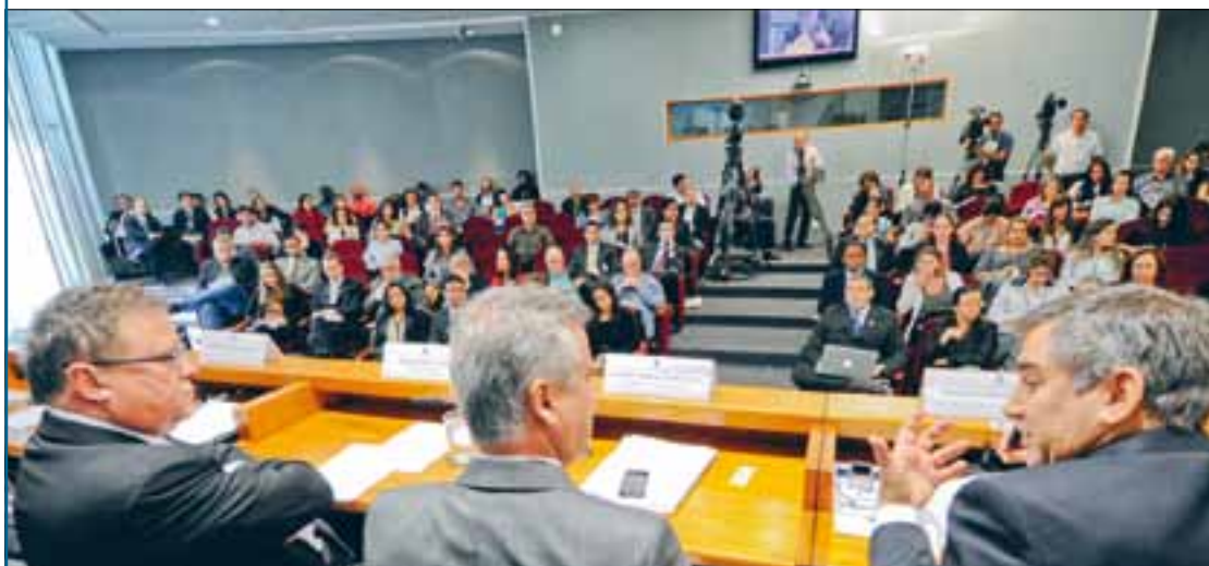
Ministro Gilberto Carvalho (D) participa do seminário ao lado dos senadores Blairo Maggi (E) e Rodrigo Rollemberg

as ONGs que dê segurança jurídica às organizações e ao Estado. Tema faz parte de projeto de Aloysio Nunes Ferreira que será relatado por Rodrigo Rollemberg. 6