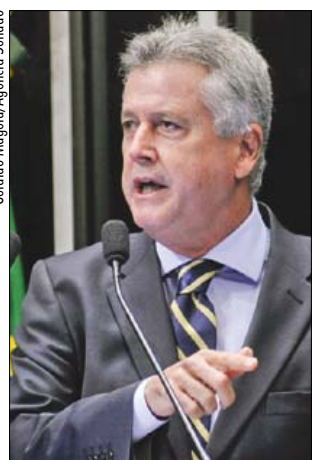
Para Rolleberg, alterações visam especulação imobiliária

O senador também disse que o Eixo Monumental poderá ser “privatizado” e passar a abrigar empreendimentos comerciais. Para ele, são “tantas as agressões” que até parece que as autoridades do governo do DF estão “enlouquecendo”.