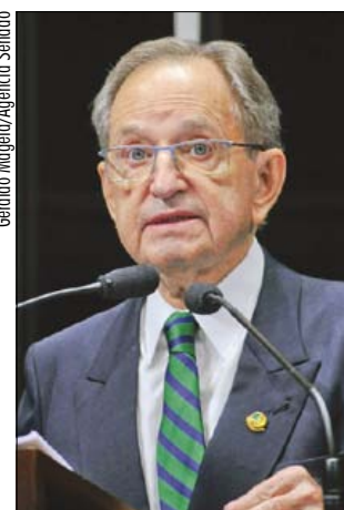
Medida poderia renovar quadro e reduzir custos, avalia senador

Figueiró destacou a redução de custos com o adoção do PDI, pois deixarão a estatal servidores que recebem o teto salarial e os novos serão admitidos pelo piso. O senador lembrou o papel da Embrapa na modernização da agropecuária brasileira e na conquista da liderança do país no setor.