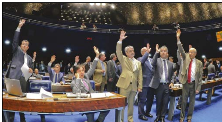
Destaques à PEC do Orçamento Impositivo começaram a ser votados no dia 6

Já a PEC 43/2013, cuja votação foi anunciada na quarta-feira pelo presidente Renan Calheiros, deixou de ser