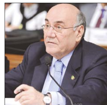
Flexa lembra que cooperativas prestam serviços em muitas cidades

O projeto estabelecia inicialmente que apenas as empresas estariam sujeitas à obrigação, mas o relator, senador Flexa Ribeiro (PSDB-PA), incluiu as cooperativas.