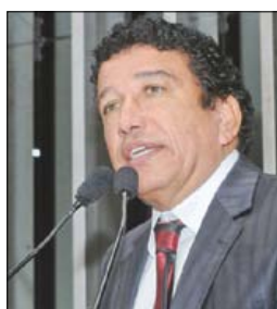
Malta quer reabilitar menores pelo esporte

A matéria está sendo analisada pela Comissão de Constituição, Justiça e Cidadania (CCJ) e o voto do relator, Ricardo Ferraço (PMDB-ES), é pela rejeição. Em Plenário, Malta informou que deverá sugerir a Ricardo Ferraço, na tentativa de viabilizar a aprovação da PEC, uma alteração para incluir a previsão de criação de centros de treinamento esportivo nos quais os jovens infratores com idade a partir de 13 anos possam ser internados para praticar esportes de alto rendimento simultaneamente ao cumprimento das penas criminais a que foram condenados.