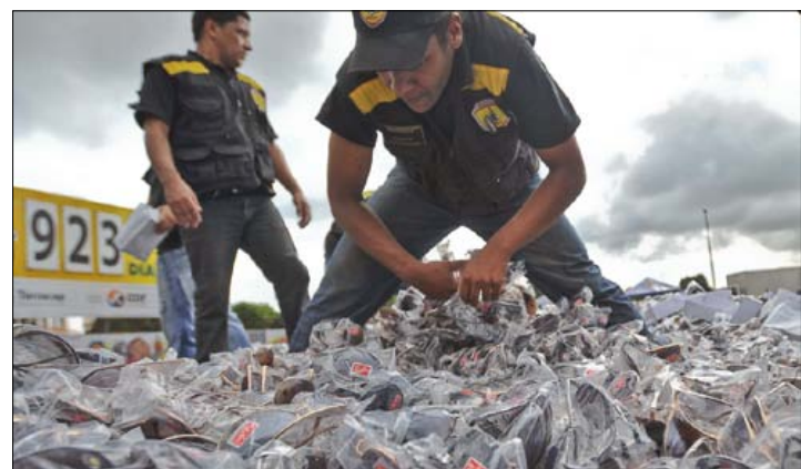
Destruição de material pirata poderá ser determinada pelo juiz, segundo projeto

O texto aprovado também proíbe que o próprio réu venha a ser o fiel depositário da apreensão. O relator propõe que seja permitida a venda antecipada dos bens apreendidos, ficando o valor apurado depositado em conta judicial até que se resolva a ação penal. Se o réu for absolvido, a quantia lhe seria restituída. Se for condenado, o valor da alienação ficaria para o Fundo Penitenciário Nacional. Se a investigação for arquivada por falta de determinação do autor do crime, os bens apreendidos poderão ser revertidos para instituições de ensino, pesquisa ou assistência social.