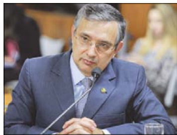
Amorim afirma que aumento foi um dos menores dos últimos anos

Na proposta de Orçamento para 2014 enviada pelo