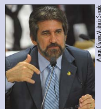
Raupp propõe preservar a redação aprovada pelo Senado

— Nós vamos votá-la imediatamente no Plenário do Senado. E como se trata de propaganda eleitoral, a expectativa nossa é falar com a ministra Cármen Lúcia [presidente do Tribunal Superior Eleitoral] para que tenhamos a implantação já na próxima eleição — disse Renan.