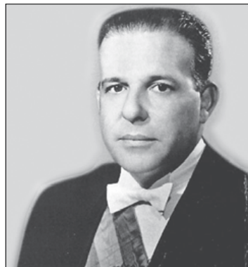
Jango estava no Brasil quando a Presidência foi declarada vaga

Segundo o projeto, de Pedro Simon (PMDB-RS), o Congresso não poderia, na madrugada de 1º para 2 de abril de 1964, ter declarado vaga a Presidência quando João Goulart estava em território nacional e local conhecido. Um dos signatários do projeto, Randolfe Rodrigues (PSOL-AP), definiu aquela sessão como “antirregimental, anticonstitucional e ilegal”.