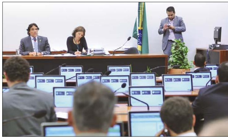
Senador Lobão Filho (E) preside reunião ordinária da Comissão Mista de Orçamento

Outro projeto aprovado (PLN 42/2013) abre crédito de R$ 51 milhões para o Instituto Chico Mendes de Conservação