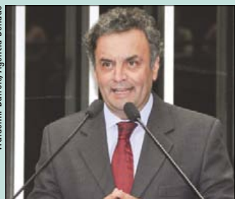
Aécio Neves, autor do pedido, cobra outras respostas do Executivo

— Isso é crime de responsabilidade. Esses prazos devem ser cobrados pelo Senado — protestou.