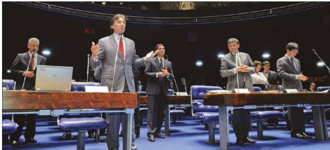
Discussões foram extensas e principal divergência entre os senadores foi quanto às situações para o voto aberto

A PEC 43/2013 tramita com a PEC 20/2013, de Paulo Paim (PT-RS), que suprime da Constituição todas as referências ao voto secreto no Parlamento, mas não estende a medida às demais Casas legislativas do país, e com a PEC 28/2013, de Antonio Carlos Valadares (PSB-SE), que suprime o voto secreto nas deliberações