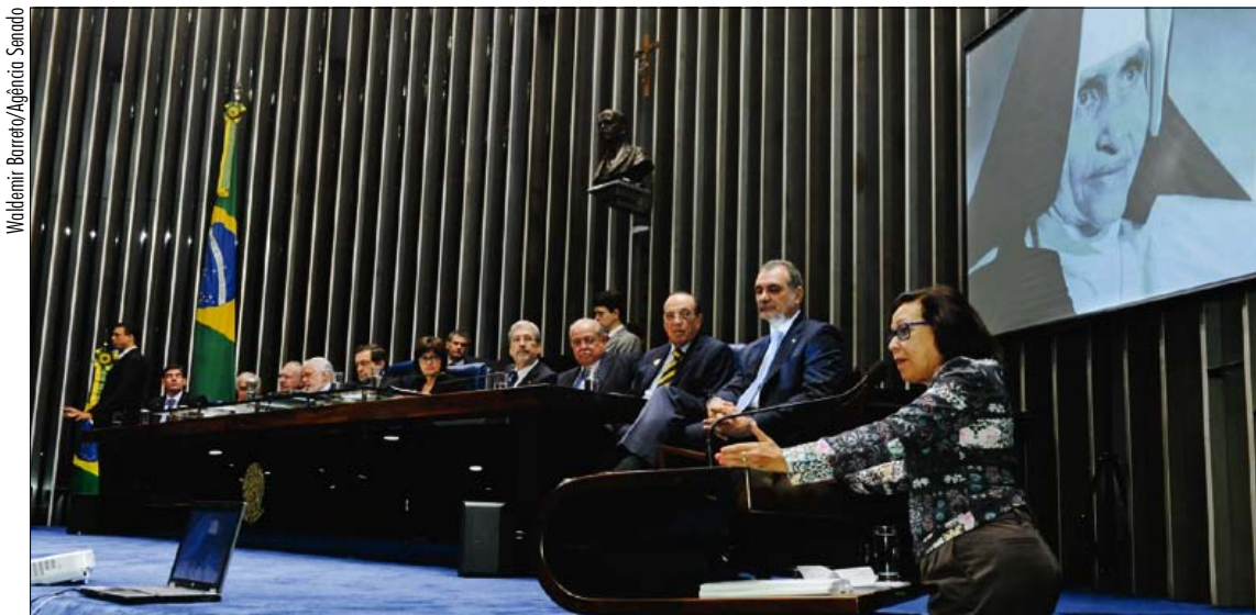
Na sessão de homenagem, Lidice da Mata fala sobre a ação evangelizadora e as ações de caridade da religiosa baiana

Luta de Irmã Dulce pelos doentes pobres e desamparados foi celebrada ontem em sessão solene comemorativa ao centenário de nascimento da religiosa, beatificada pelo papa Bento XVI em 2011