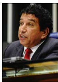
Magno Malta/Agência Senado

A Portaria 415, publicada na semana passada, inclui na tabela do Sistema Único de Saúde (SUS) a interrupção da gravidez nos casos previstos em lei (gestação decorrente de estupro, feto