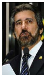
Waldemir Barreto/Agência Senado

— No Brasil, o baixo crescimento da economia causa preocupação. Na indústria, observa-se um encolhimento; já a agropecuária continua avançando — afirmou.