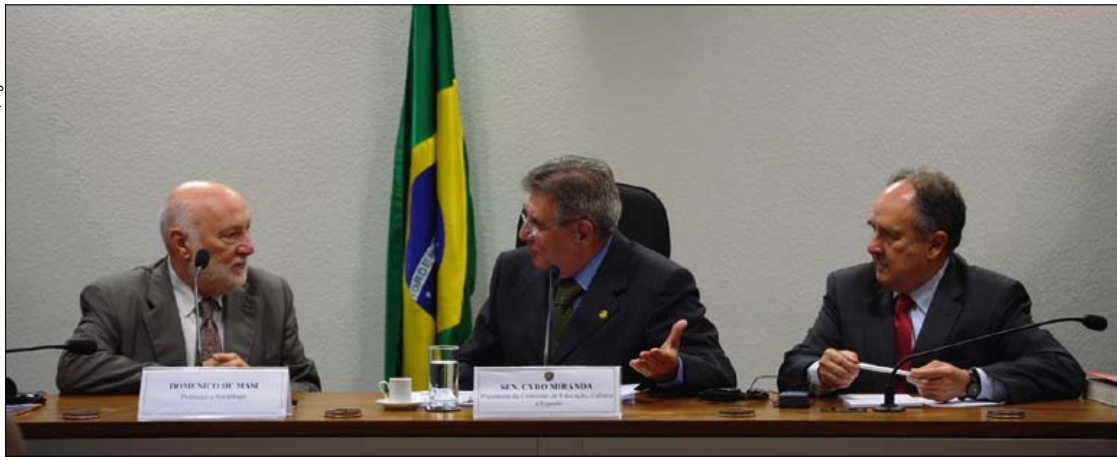
O sociólogo italiano Domenico De Masi participa de audiência, ao lado dos senadores Cyro Miranda e Cristovam Buarque