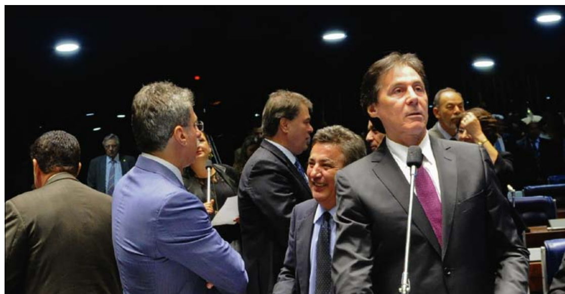
Plenário do Senado durante sessão deliberativa que aprovou a isenção de tributos incidentes na importação de álcool

A MP também especifica que a compensação do saldo credor de créditos acumulados de PIS-Pasep e de Cofins com débitos perante o fisco federal será permitida em relação a custos, despesas e encargos vinculados à produção e à comercialização de álcool. Dessa forma, fica excluída a hipótese de custos relativos à importação.