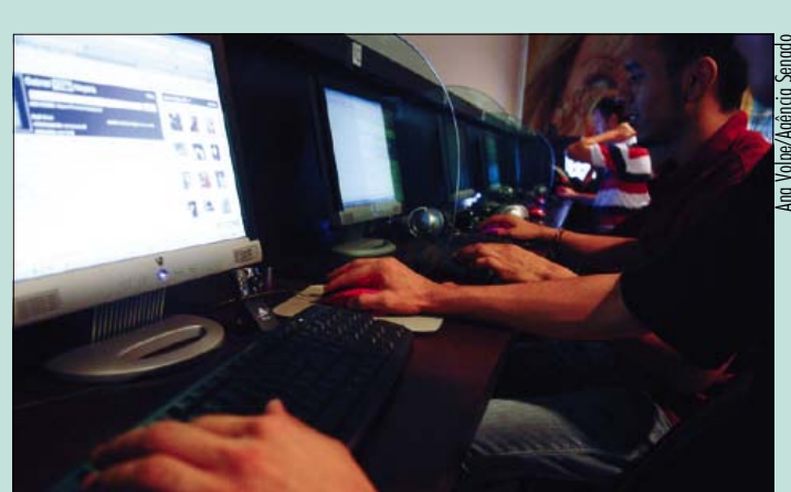
Meta do plano nacional é conectar 40 milhões de domicílios à internet

Sobre a falta de cobertura da telefonia móvel em diversas regiões do país, ele explicou que licitações passadas não exigiam que também os distritos, e não apenas a sede dos municípios, fossem atendidos. Nas licitações para o serviço 4G, disse, está prevista a oferta obrigatória de acesso a internet e telefonia até 30 quilômetros a partir da borda da área urbana.