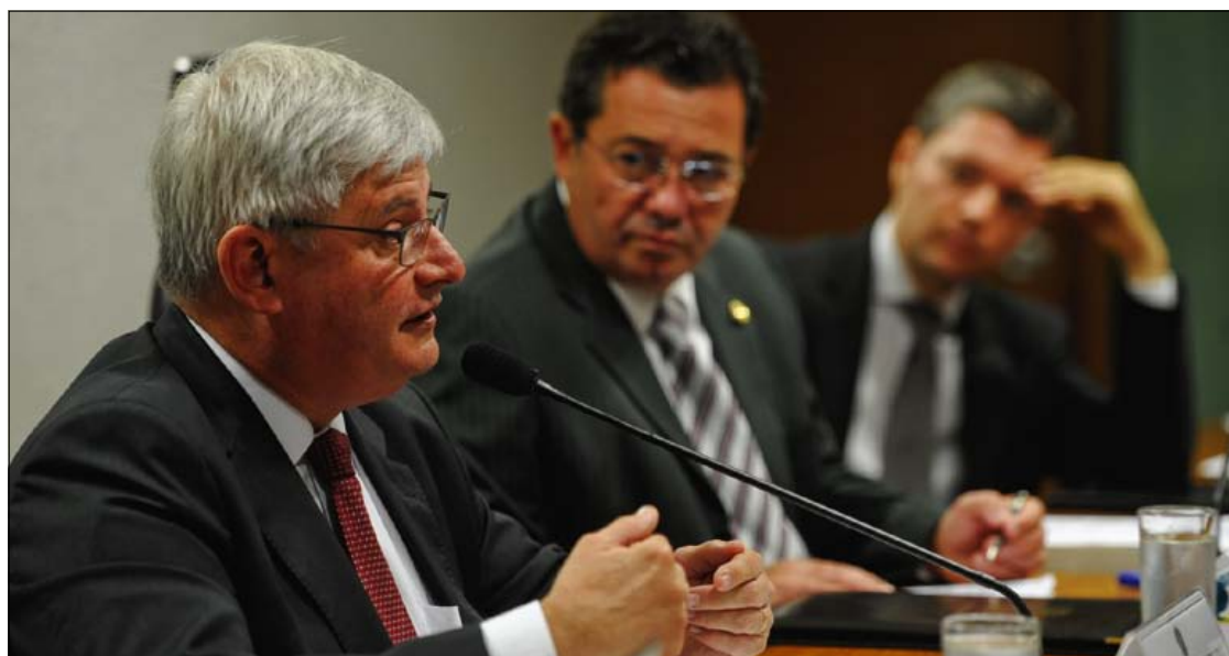
Rodrigo Janot elogia, em audiência presidida por Vital do Rêgo (C), pontos do texto atual para reforma do Código Penal

Para Janot, depois do atentado de 11 de setembro de 2001, em Nova York, não se pode dizer que o Brasil está livre de um ato bárbaro.