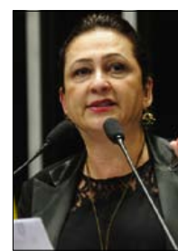
Kátia Abreu/Agência Senado

A senadora Kátia Abreu (PMDB-TO), em pronunciamento em Plenário ontem, apelou ao Ministério Público para que exija providências do governo quanto ao atendimento na área da saúde no Tocantins. Segundo a parlamentar, os tomógrafos dos hospitais da rede pública em Araguaína e Gurupi estão parados há cinco e quatro anos, respectivamente, e as obras do Hospital Geral de Gurupi estão empenhadas há três anos sem que “nem sequer um tijolo” tenha sido colocado.