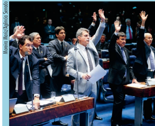
Plenário do Senado tem 20 proposições na pauta para votação entre 15 e 17 deste mês, com temas variados

programas de rádio e TV em época de eleição e à veiculação de sondagens eleitorais às vésperas do pleito. Os conselheiros entenderam haver violação à liberdade de expressão. 3