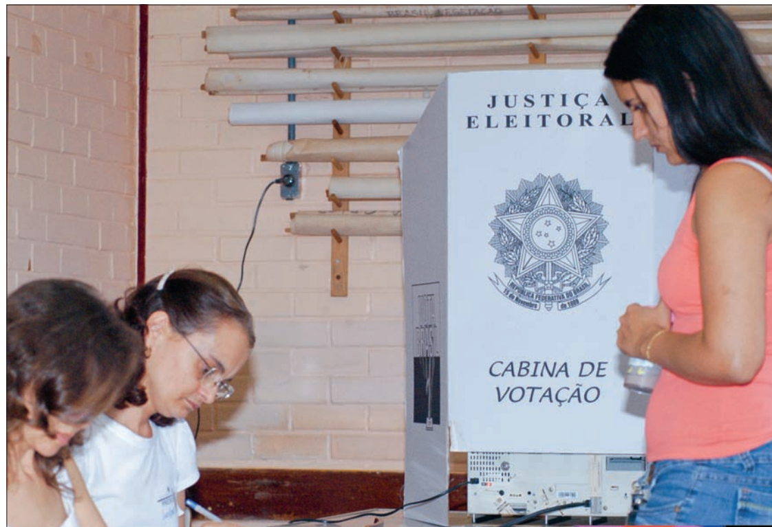
Eleitora vota em escola no Guará (DF): para conselho, propostas que limitam pesquisas violentam liberdade de expressão

O Conselho de Comunicação Social realizará a próxima e última reunião da atual gestão em 6 de agosto. A instituição, criada pela Constituição de 1988, é integrada por representantes das empresas e dos trabalhadores e funciona como órgão de consulta do Congresso Nacional para temas na área de comunicação.