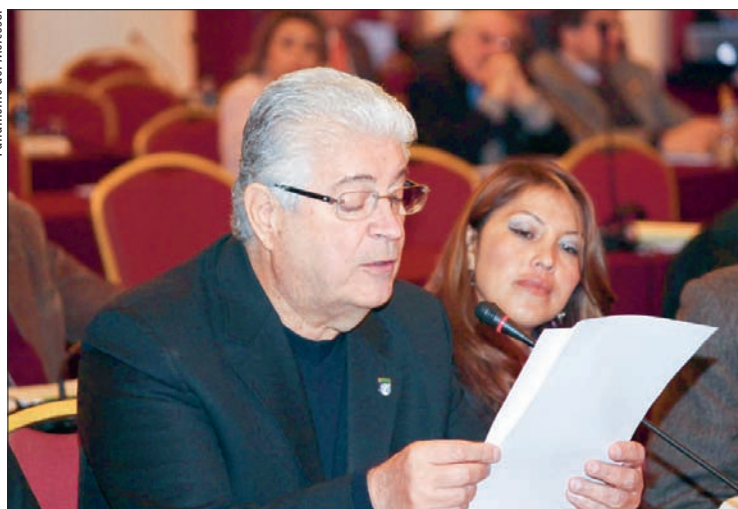
Requião lembra que fundos abutres representam 0,45% dos credores da Argentina