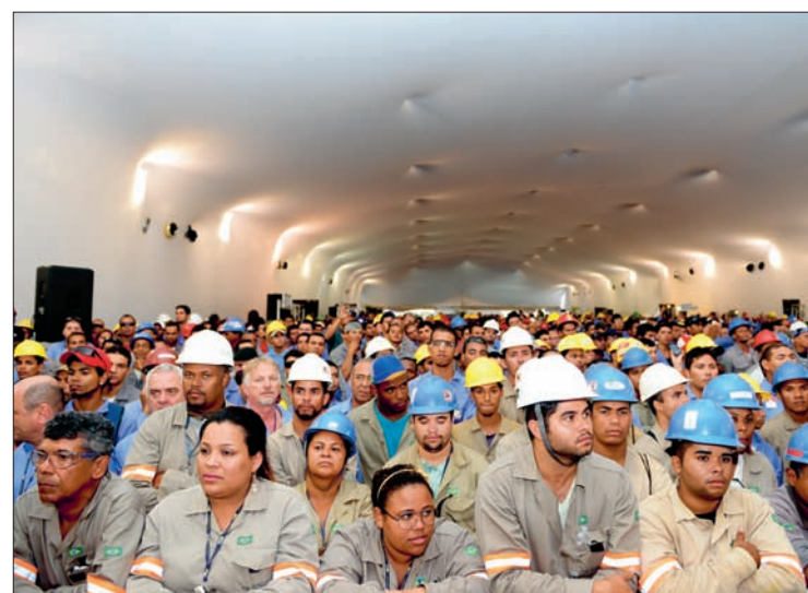
Sindicato dos petroleiros afirma que plataforma P-62 foi lançada ao mar incompleta

Já ouvido pela CPI, um dos acusados, o ex-diretor de Abastecimento da Petrobras Paulo Roberto Costa disse que a empresa errou ao divulgar dados preliminares relativos ao custo do empreendimento.