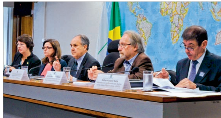
Audiência sobre o uso da maconha foi uma das 14 realizadas mês passado

Outra proposta a ser votada é o PLS 559/2013, que altera a Lei de Licitações (Lei 8.666/1993), cujo texto original teve como relator Pedro Simon (PMDB-RS). O projeto elimina a carta-convite e a tomada de preços no processo licitatório. A intenção é estabelecer um novo marco legal para contratações no setor público, o que implicaria a revogação da Lei de Licitações e da Lei 12.462/2011, que instituiu o Regime Diferenciado de Contratações Públicas. A reforma da legislação foi uma das bandeiras defendidas por Renan Calheiros ao assumir a Presidência do Senado no ano passado.