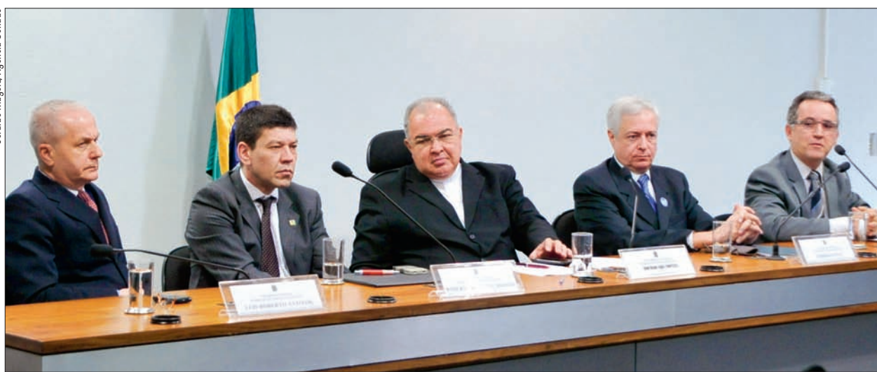
Dom Orani Tempesta (C) preside reunião do conselho, que, na segunda-feira, também debateu a flexibilização do horário da Voz do Brasil

Nos dias 15, 16 e 17, o Senado fará um novo esforço concentrado, com análise de mudanças na Lei de Licitações e no Código de Defesa do Consumidor, entre outras. Para destrancar a pauta, três medidas provisórias precisam ser votadas. Uma autoriza o Banco Central a ceder imóveis para construção de sistema viário no Rio de Janeiro, outra altera funções comissionadas no Ministério da Justiça e a terceira abre crédito extraordinário de R$ 5,1 bilhões a órgãos do Executivo. 2