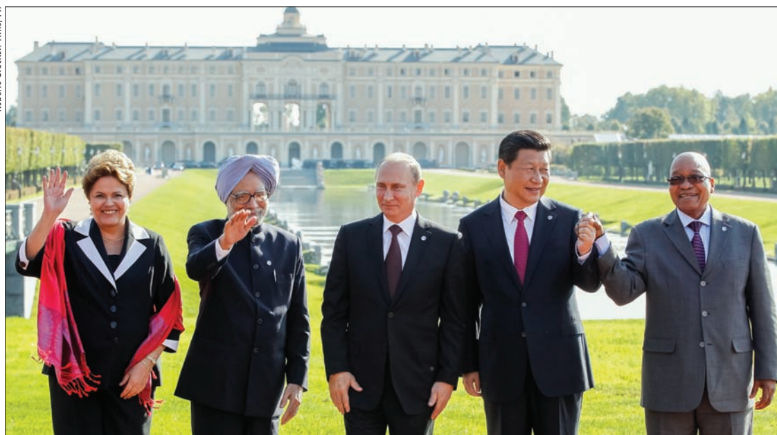
O presidente da China, Xi Jinping (2º à dir.), ao lado dos demais presidentes do G20: mandatário estará em Brasília