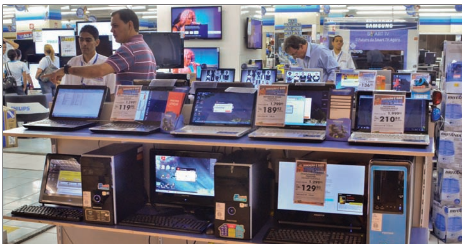
Computadores à venda em loja de eletrodomésticos: setor de informática pode ter benefício prorrogado