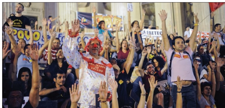
Professores da rede pública do Rio fazem protesto: projeto afeta manifestações

um projeto de lei com teor semelhante (PLS 44/2014), mas que exclui expressamente os movimentos sociais reivindicatórios da classificação como terrorismo.