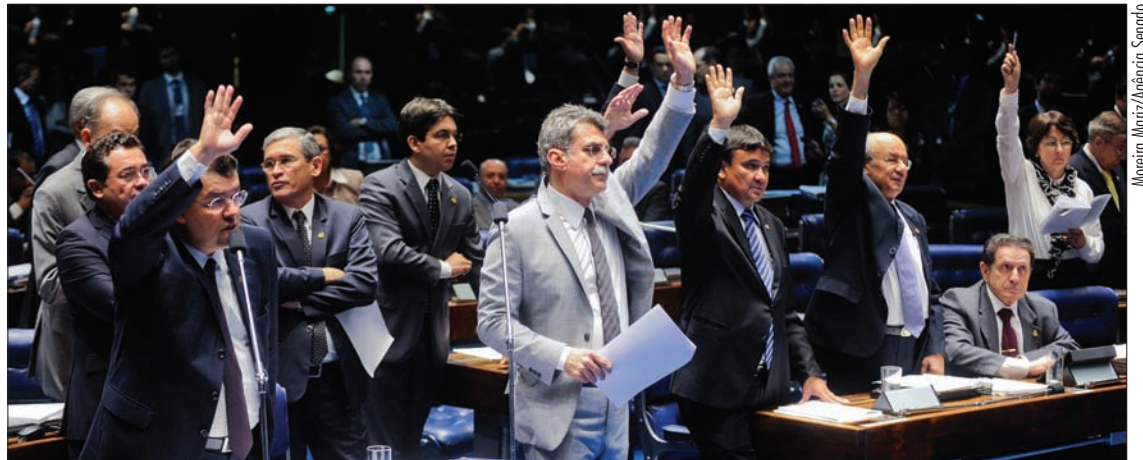
Plenário retoma análise de projetos e tenta cumprir pauta de votações antes do início do recesso, marcado para o dia 18

O PLS 150/2013 — Complementar, de Paulo Paim (PT-RS), concede aposentadoria especial a pescadores e trabalhadores afins a partir de 25 anos de contribuição previdenciária.