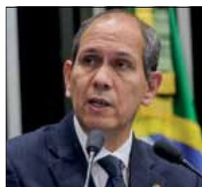
Senador citou as iniciativas do Acre na área ambiental

— Esse sistema de incentivo por serviços ambientais coloca o