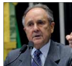
Cristovam defende que União arque com educação básica

A Comissão de Educação, Cultura e Esporte (CE) aprovou nesta semana projeto de Cristovam que determina a realização de um plebiscito sobre a possibilidade de transferência da responsabilidade pela educação básica ao governo federal (PDS 460/2013). Atualmente,