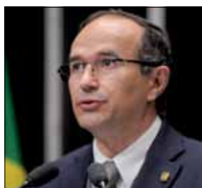
Senador, que é de Caruaru, se preocupa com setor têxtil

O senador, que substituiu Armando Monteiro (PTB-PE), adiantou qual será o foco principal de atuação dele na Casa.