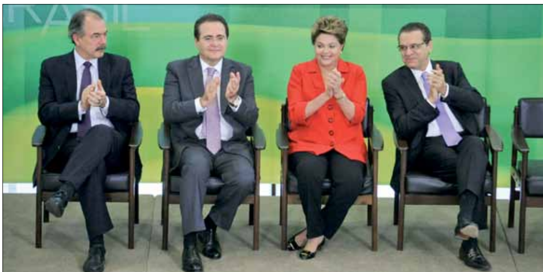
Aloizio Mercadante, Renan Calheiros e Henrique Alves acompanham cerimônia de sanção da lei pela presidente Dilma