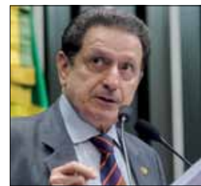
Senador elogia agilização de processos de casos de abuso

A resolução recomenda aos juízes de todo o país que ajam com maior rapidez nos processos relacionados a casos de abuso, exploração sexual, tortura e maus-tratos de crianças e adolescentes. O prazo máximo recomendado pelo CNJ para o julgamento desses crimes