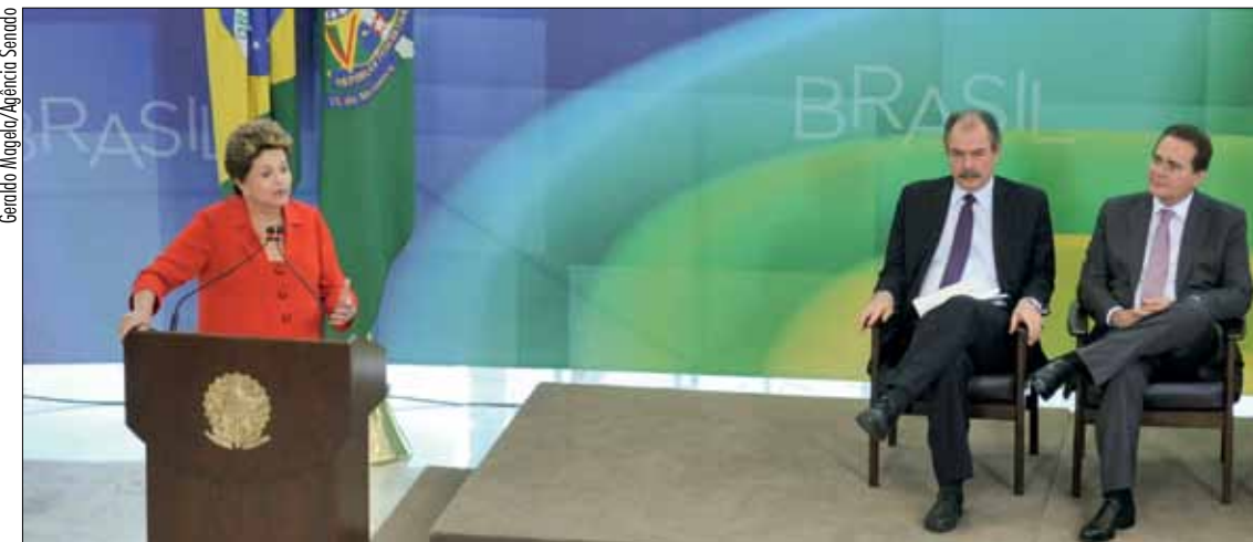
Ao lado do ministro Mercadante, o presidente do Senado, Renan Calheiros (D), acompanhou Dilma na sanção do projeto

por reportagem em revista de terem combinado previamente depoimentos à CPI no Senado. 3